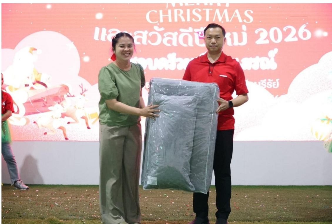
ร่วมกิจกรรมวันขึ้นปีใหม่