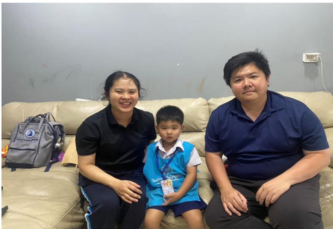
กิจกรรมเยี่ยมบ้าน