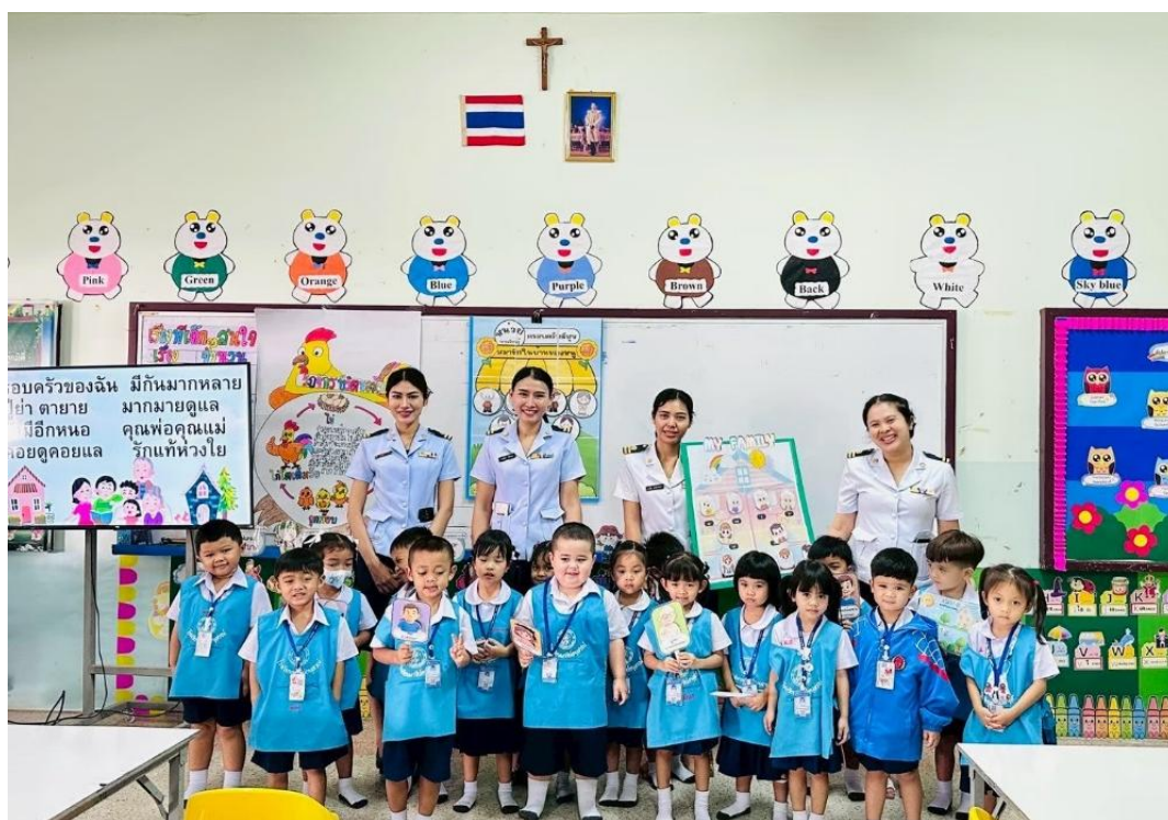
นิเทศห้องเรียน