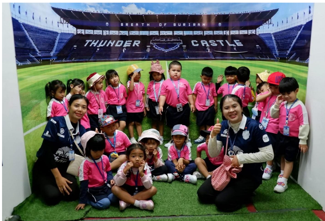
เด็กๆไปทัศนศึกษาที่ศูนย์วัฒนธรรมอีสานใต้