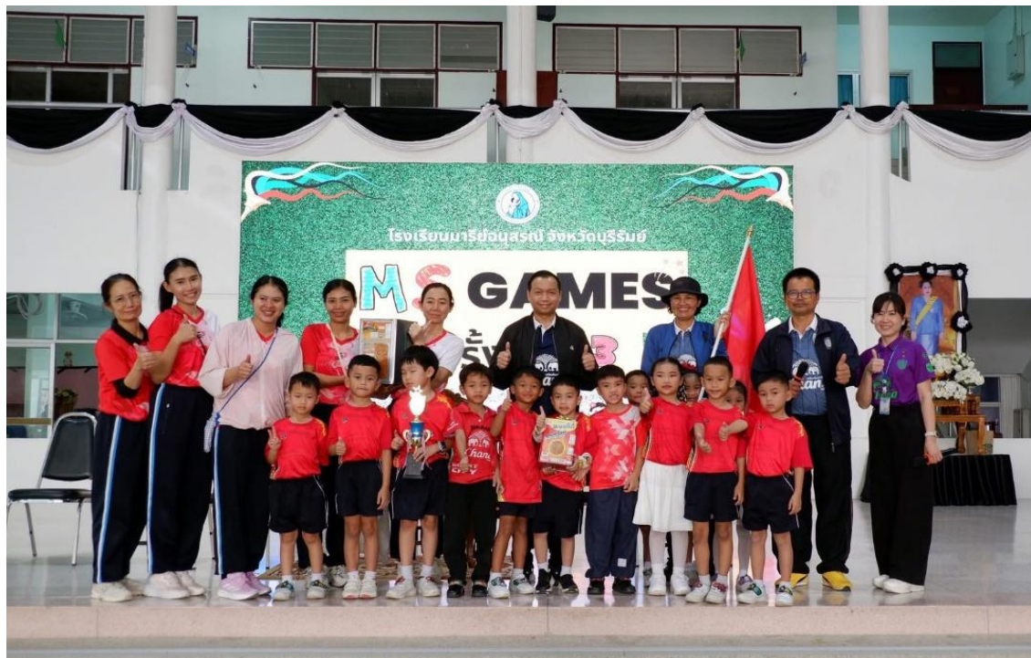
กิจกรรมการแข่งขันกีฬา