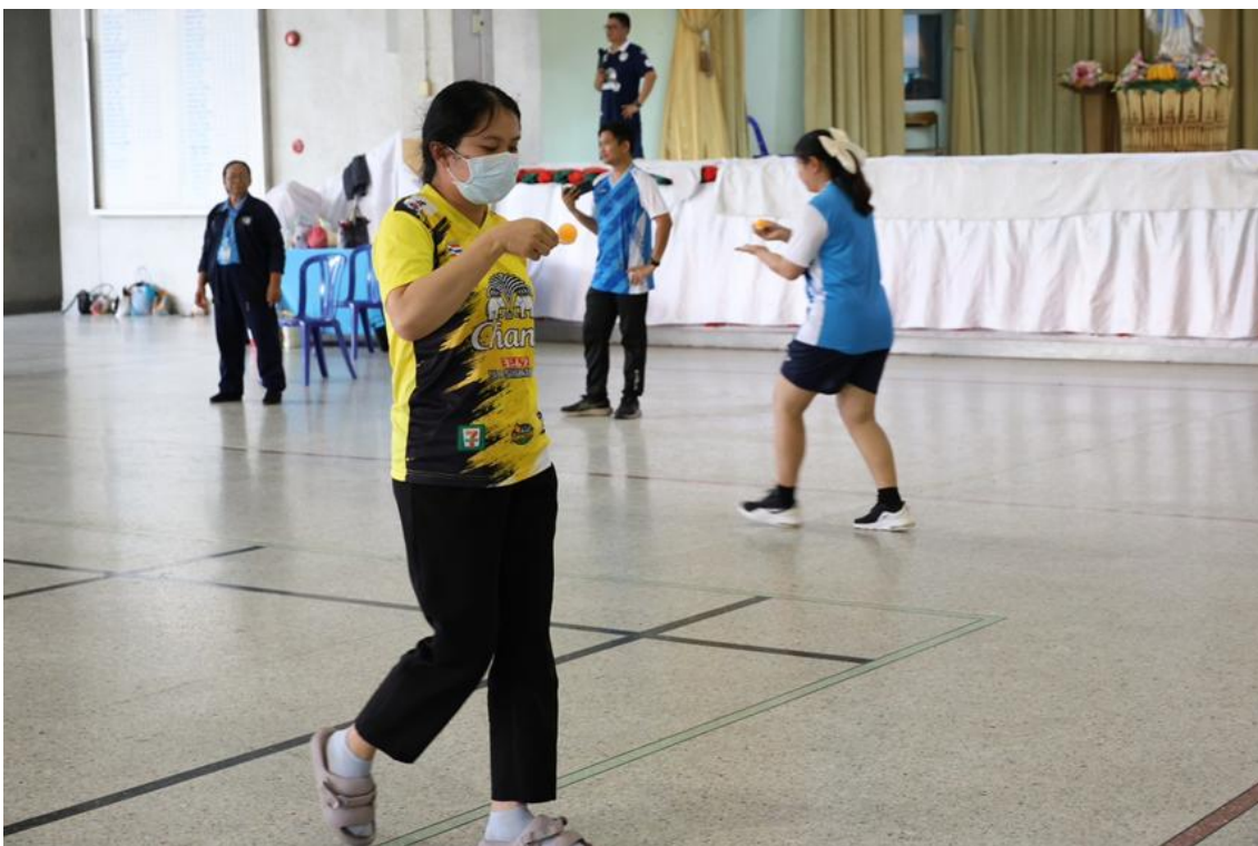
กีฬาสมัครเล่น