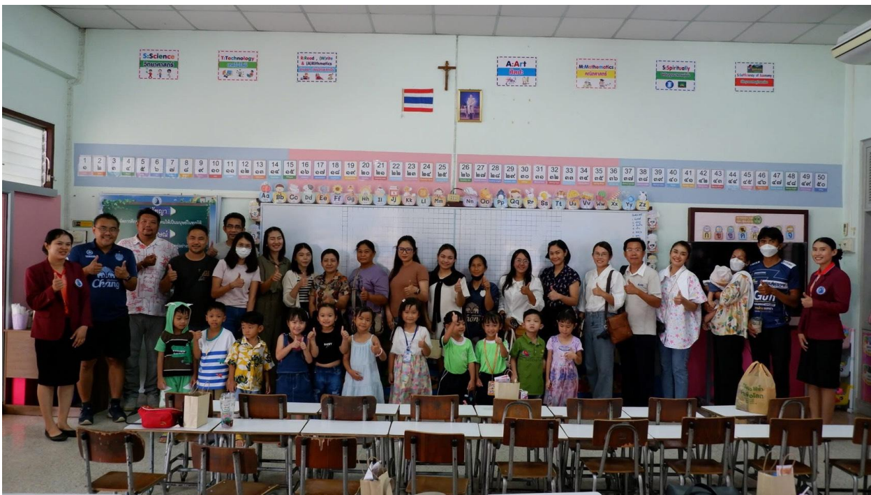
ประชุมผู้ปกครอง ปีการศึกษา 2568