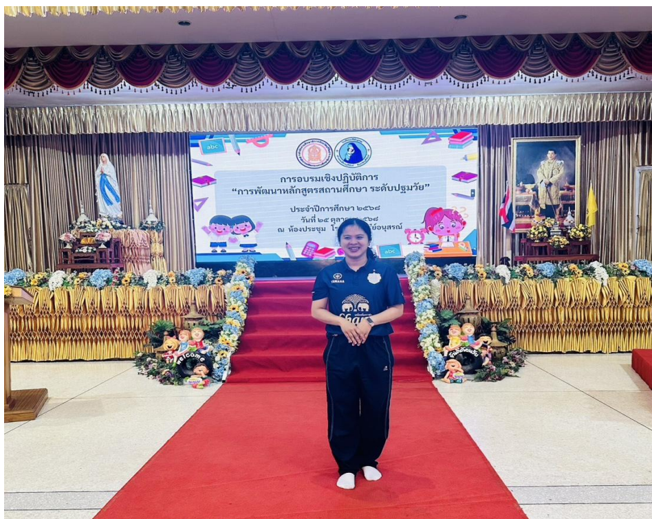
อบรมออกเชิงปฏิบัติการ การพัฒนาหลักสูตรสถานศึกษาปฐมวัย