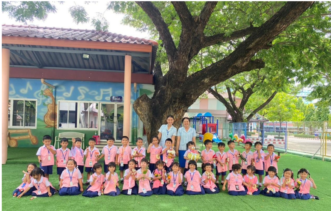
ร่วมกิจกรรมวันไหว้ครู