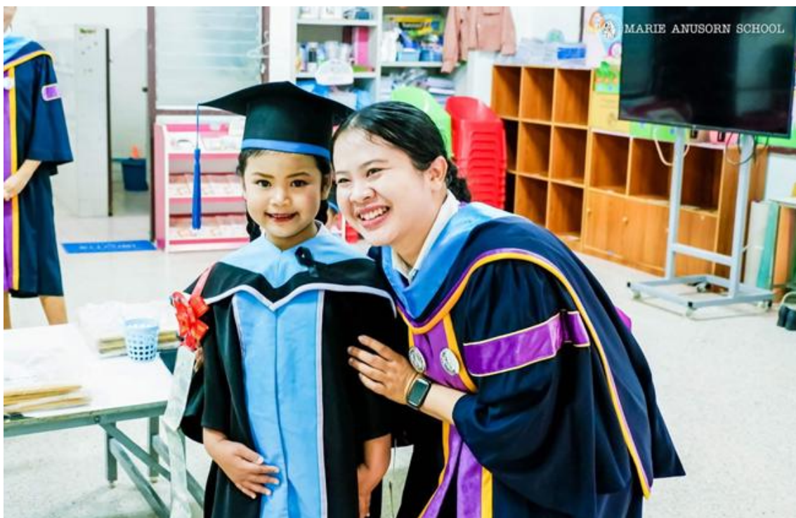
ร่วมกิจกรรมยุวบัณฑิต ปีการศึกษา 2568