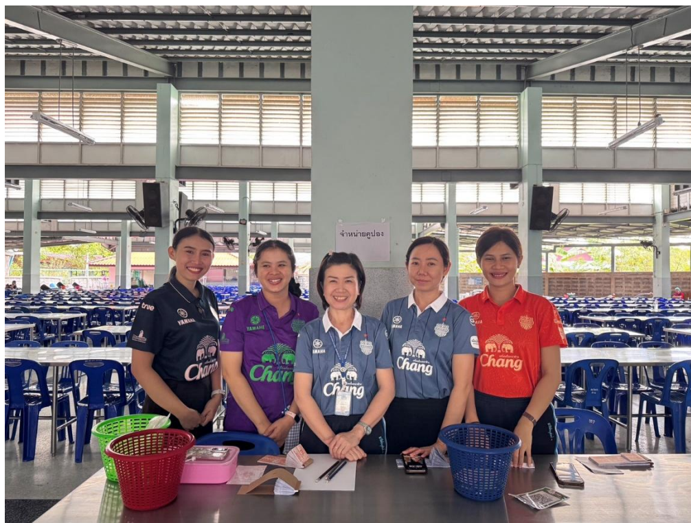
กิจกรรมโรงเรียน