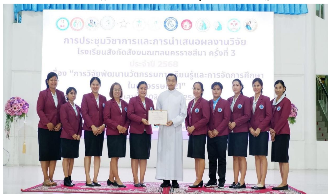
การประชุมวิชาการและการนำเสนอผลงานวิจัย โรงเรียนสังกัดสังฆมณฑลนครราชสีมา ครั้งที่ 3