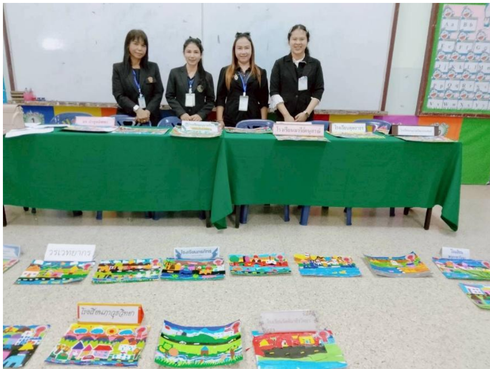
กรรมการตัดสิน ฉีกตัดปะ