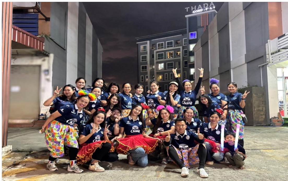
กองเชียร์กิจกรรมมาราธอน