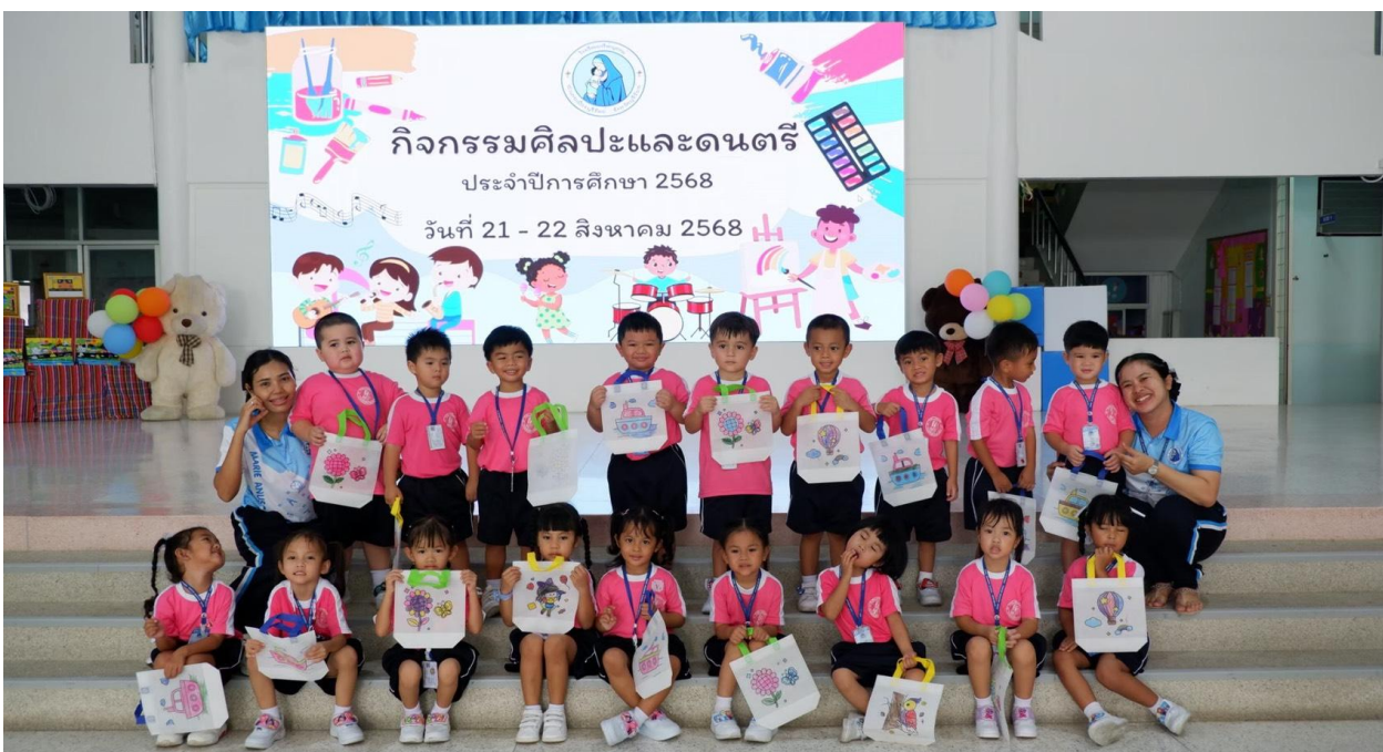
กิจกรรมศิลปะและดนตรี