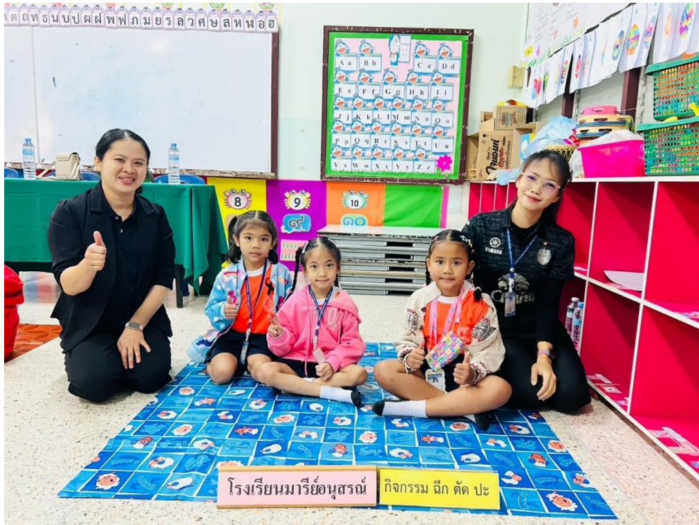
ร่วมกิจกรรมแข่งทักษะ ฉีกตัดปะ ที่โรงเรียนมารีย์อนุสรณ์