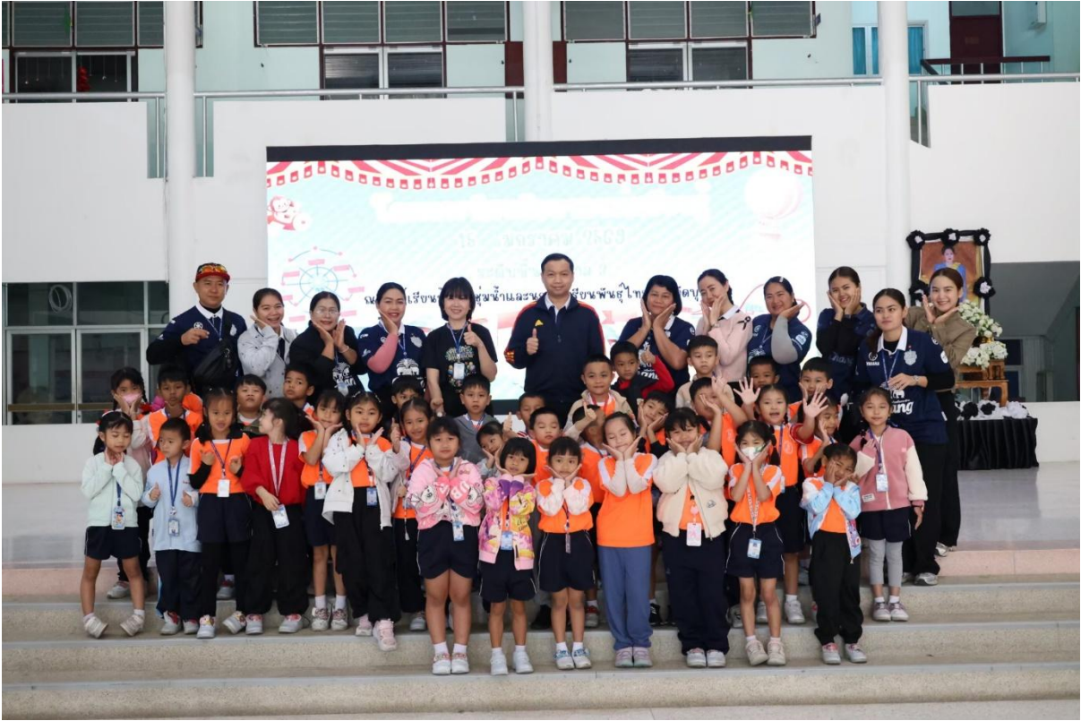
เข้ากิจกรรมทัศนศึกษาประจำปีการศึกษา 2568