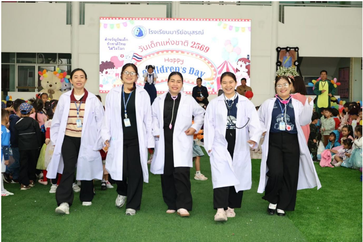
เข้ากิจกรรมวันเด็กแห่งชาติ ปีการศึกษา 2568