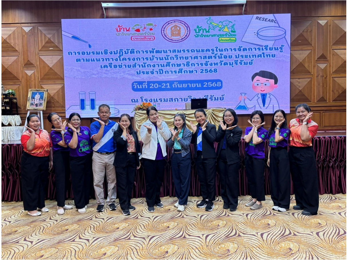
เข้าร่วมอบรมเชิงปฏิบัติการพัฒนาสมรรถนะการจัดการเรียนรู้ โครงการบ้าน นักวิทยาศาสตร์น้อย ประเทศไทย