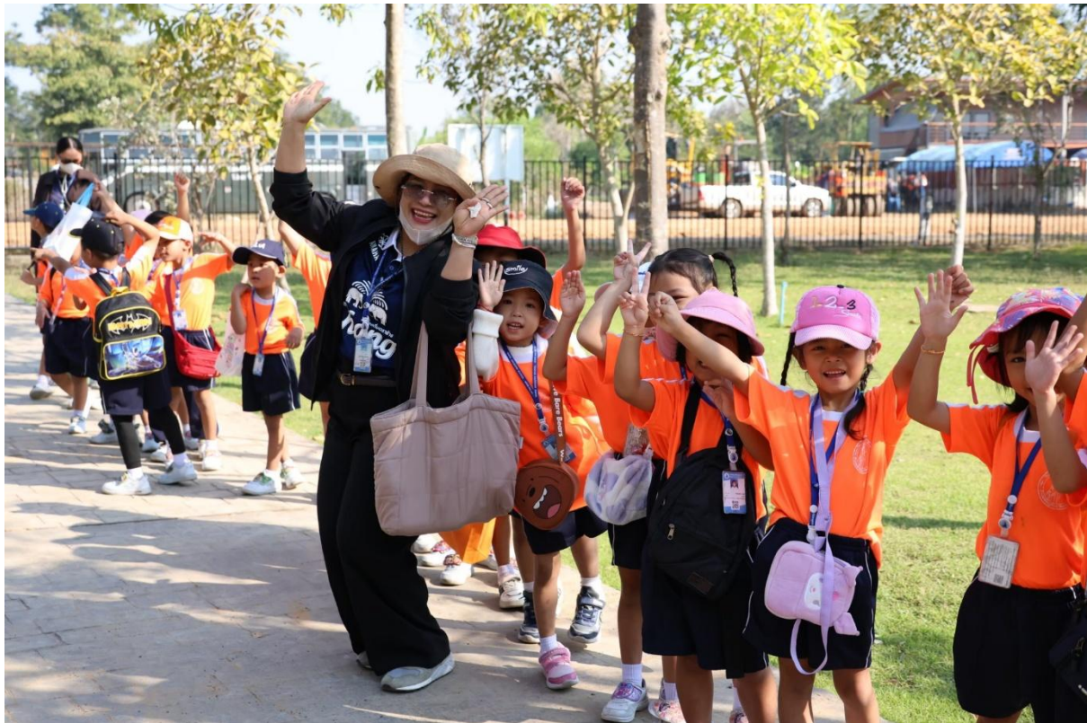
เข้ารับการประเมินนิเทศติดตามการสอน ห้องอนุบาล 3/5