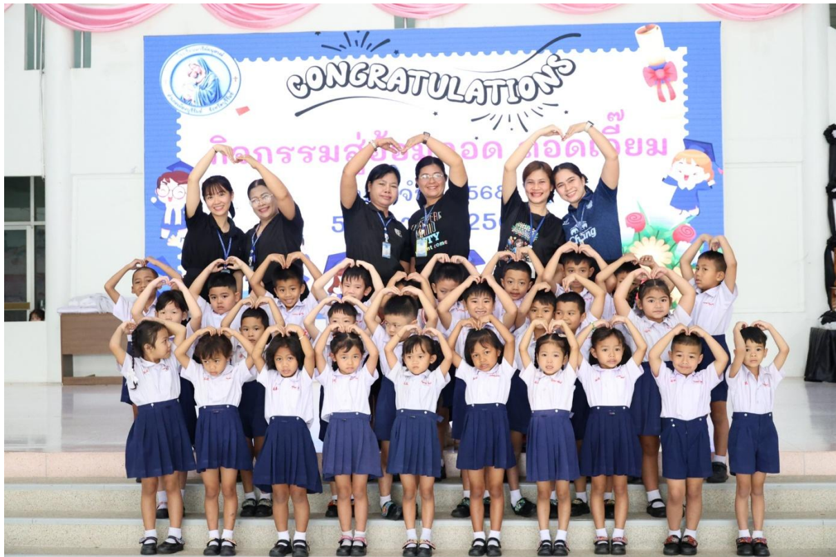
เข้าร่วมกิจกรรมถอดเอี่ยม เด็กจบอนุบาล 3 ปีการศึกษา 2568