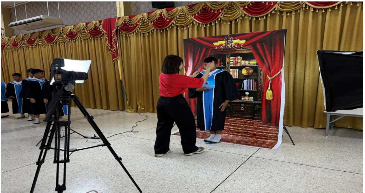
ปฏิบัติหน้าที่ที่ได้รับมอบหมายของฝ่ายเทคโนโลยีทางการศึกษา