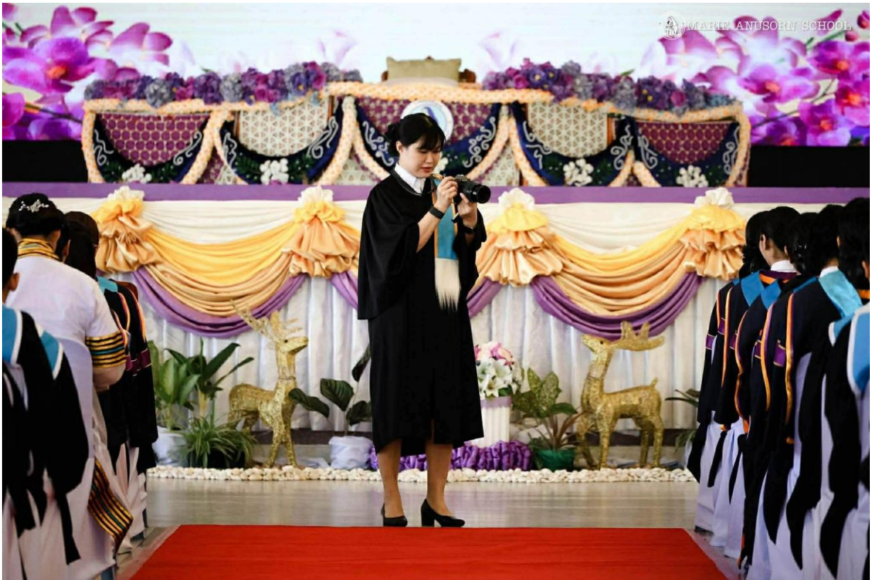
ได้รับมอบหมายทำหน้าที่จัดทำภาพ บันทึกภาพงานรับวุฒิบัตรระดับชั้นอนุบาล 3 ประถมศึกษาปีที่ 6 และมัธยมศึกษาปีที่ 3 ประจำปีการศึกษา 2568