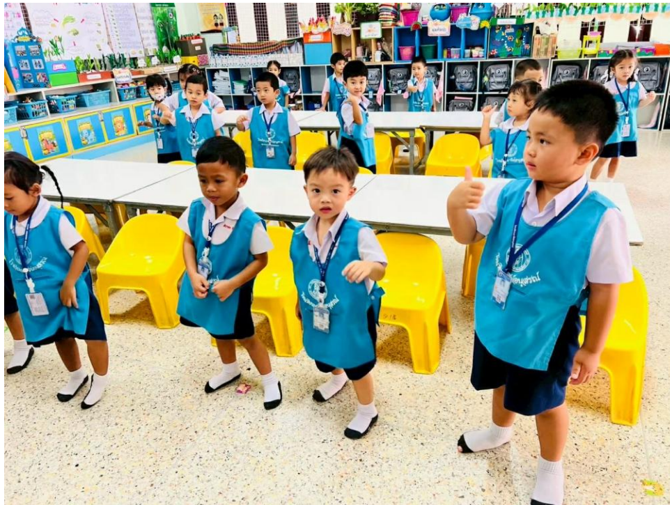
ปฏิบัติหน้าที่ครูผู้สอนในรายวิชาภาษาอังกฤษ ระดับชั้นอนุบาล