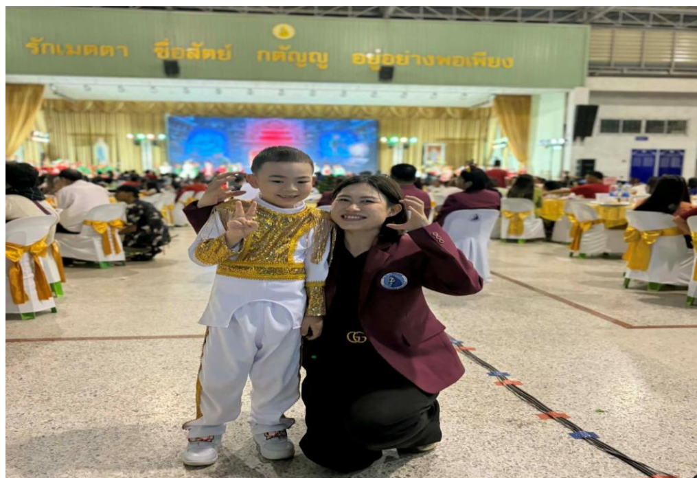
ได้รับมอบหมายทำหน้าที่บันทึกภาพกิจกรรมคริสต์มาส