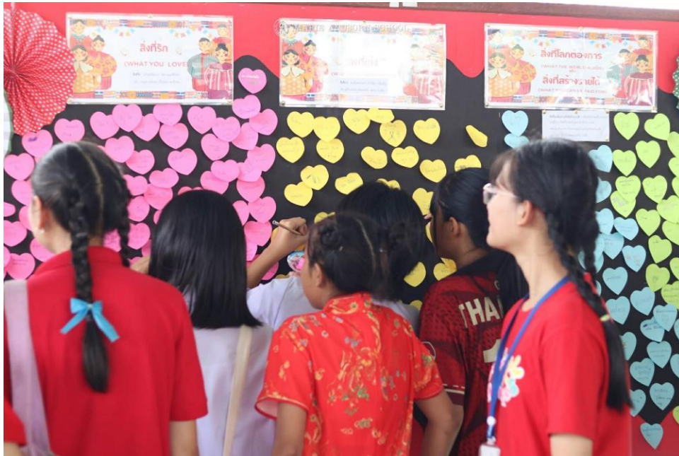
ได้รับมอบหมายทำหน้าที่บันทึกภาพกิจกรรม Open House and Happy Chinese New Year 2026