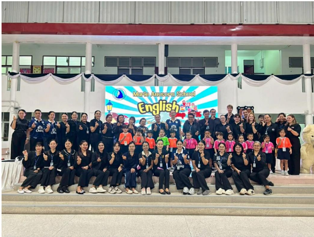
ได้รับมอบหมายทำหน้าที่จัดกิจกรรม English Camp ระดับปฐมวัย