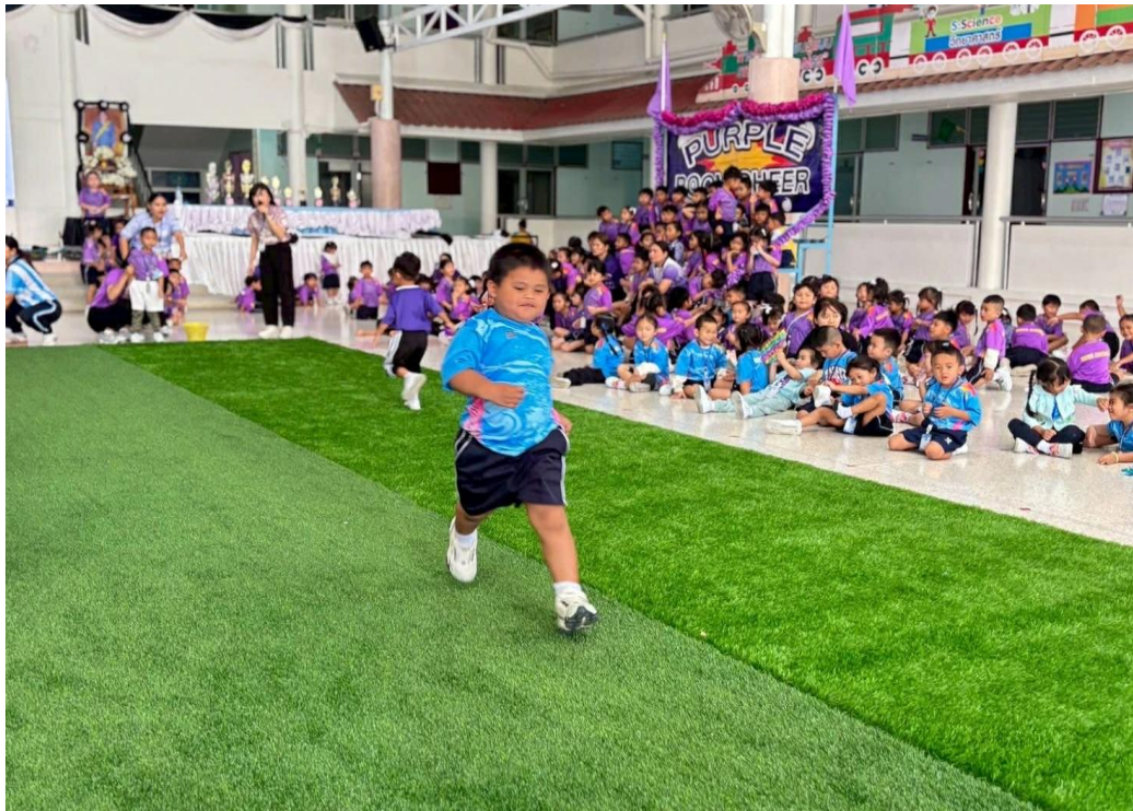
ได้รับมอบหมายทำหน้าที่บันทึกภาพกิจกรรมกีฬาสี่ลูกรัก