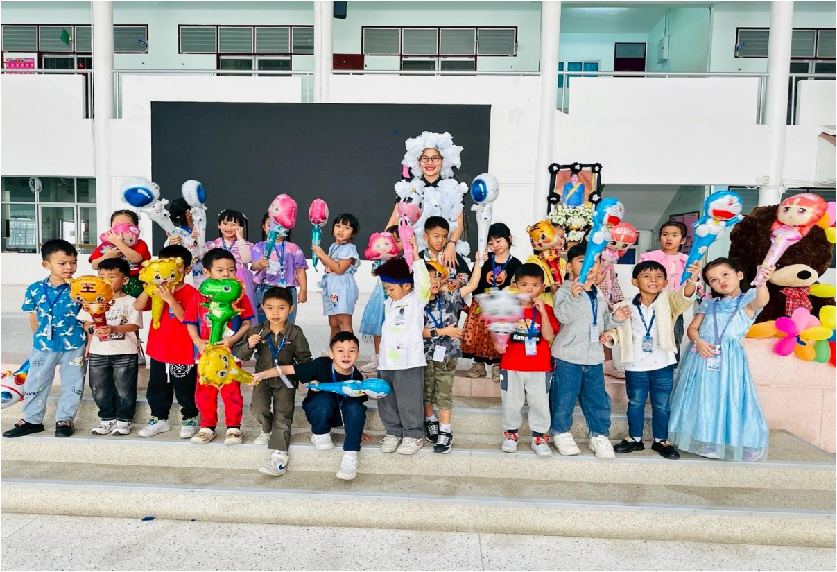
เด็กๆร่วมกิจกรรมวันวิทยาศาสตร์กับเพื่อนๆ