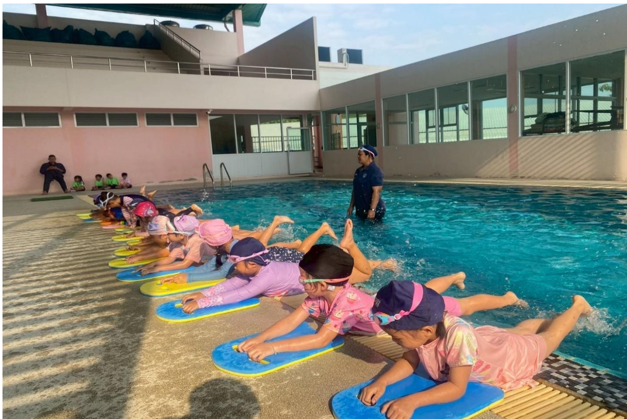
เด็กๆ เรียนวิชาว่ายน้ำกับมิสสอนงค์และเพื่อนๆ อย่างสนุกสนาน