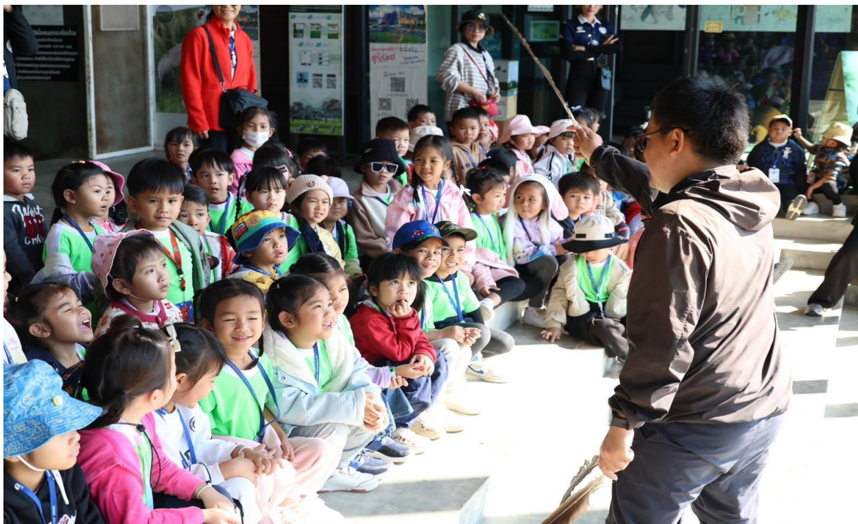
เด็กๆ ทัศนศึกษาที่ศูนย์การเรียนรู้นกกกระเรียนกับคุณครูและเพื่อนๆ