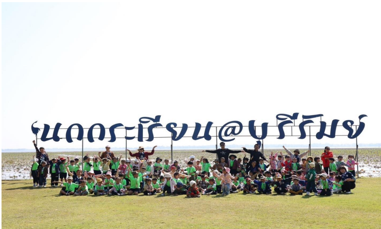
เด็กๆ ทำศนศึกษาที่ศูนย์การเรียนรู้นกรกระเทียมกับคุณครูและเพื่อนๆ