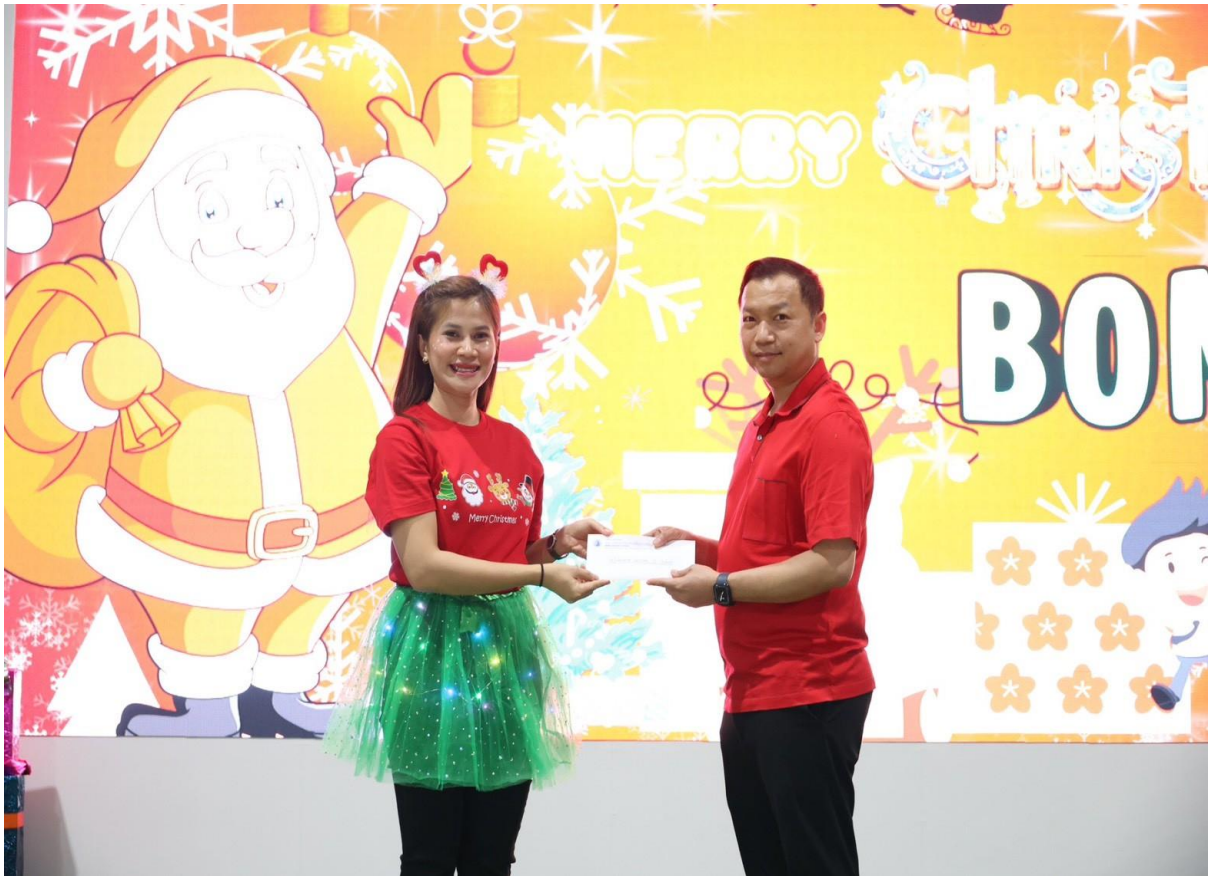
ร่วมกิจกรรมวันปีใหม่กับทางโรงเรียนและรับโบนัสประจำปี