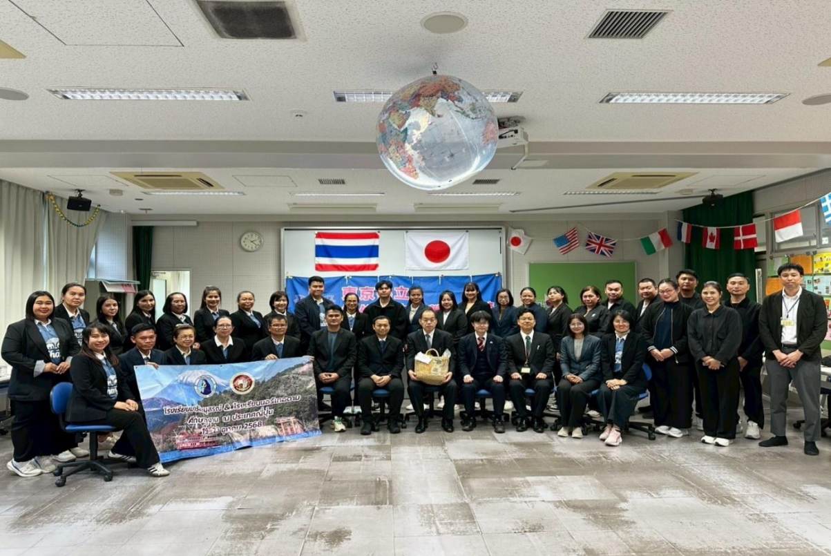
ไปทัศนศึกษาดูงานที่ประเทศญี่ปุ่น 5 วัน 4 คืน