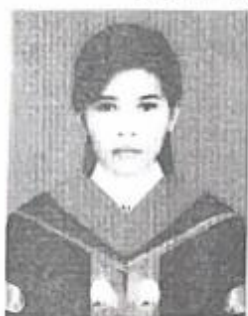
หมายเลขบัตรประชาชน

ให้ไว้ ณ วันที่..... ๑ .....เดือน..... พฤษภาคม..... พ.ศ. ๒๕๖๒