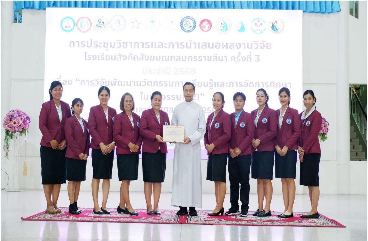
อบรมประชุมวิชาการและนำเสนอผลงานวิจัย ที่โรงเรียนมารีย์อนุสรณ์