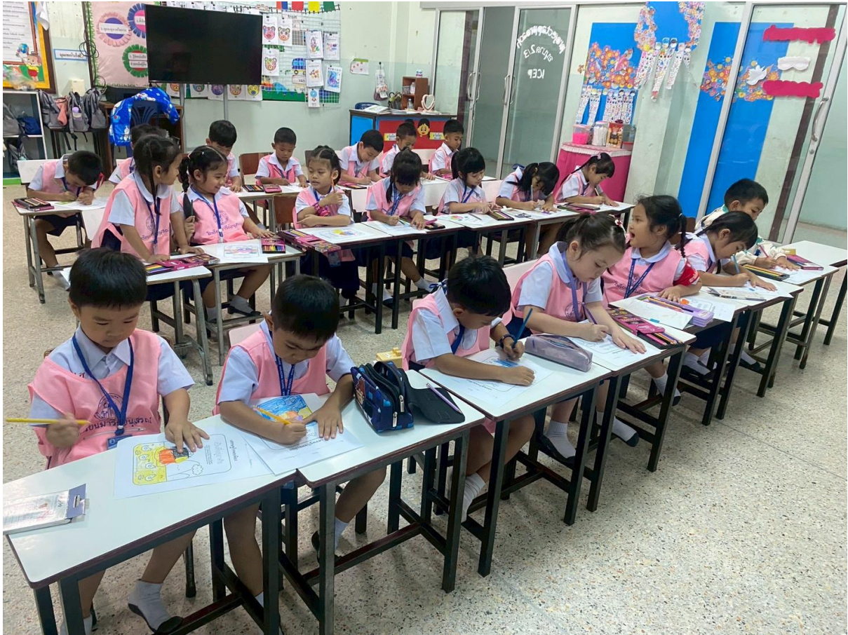
เด็กๆทำกิจกรรมกับเพื่อนๆในห้องเรียน