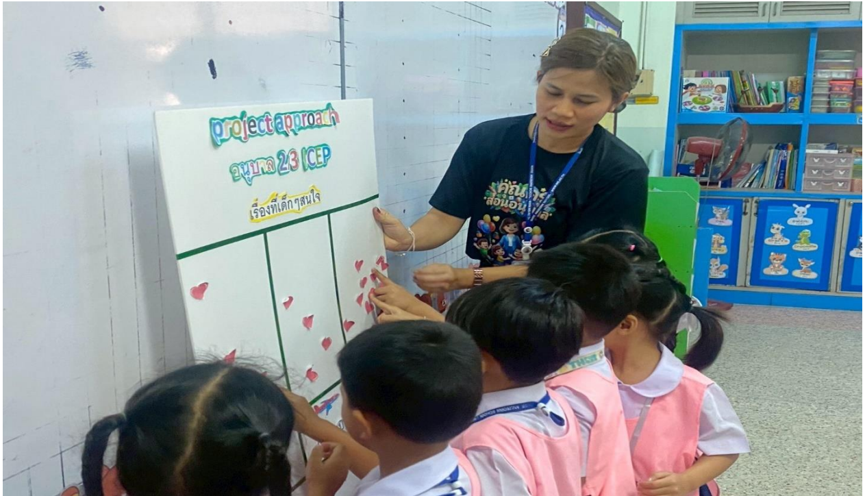
เด็กๆ เรียนรู้เรื่อง Project Approach เรื่อง หน้ากาก