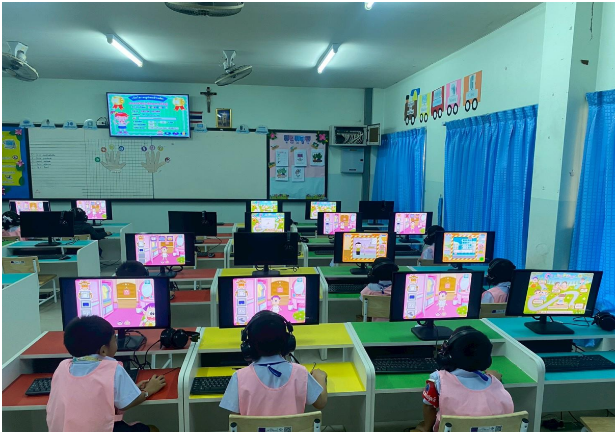
เด็กๆเรียนวิชาคอมพิวเตอร์กับมิสณุ่น