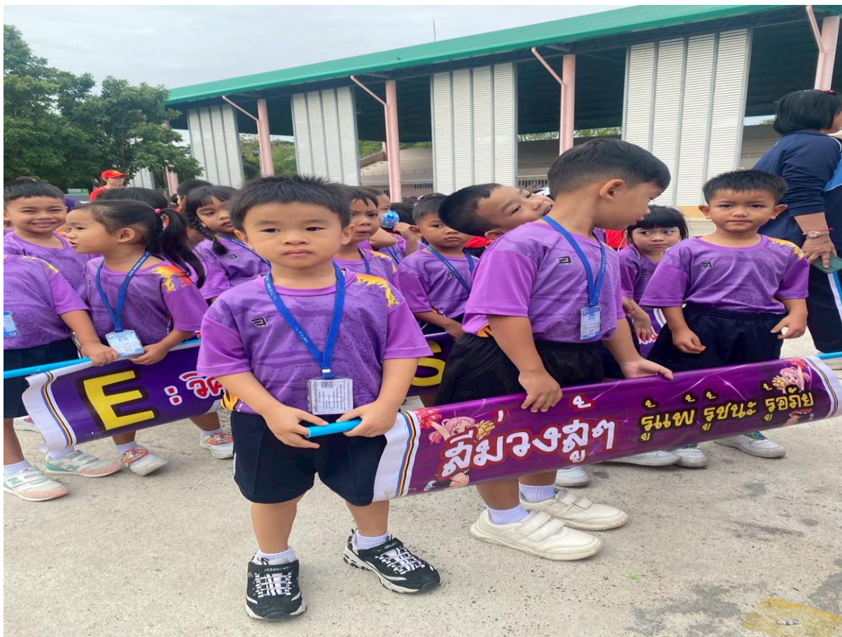
เด็กๆ ร่วมกิจกรรมงานกีฬาสี่กับเพื่อนๆ