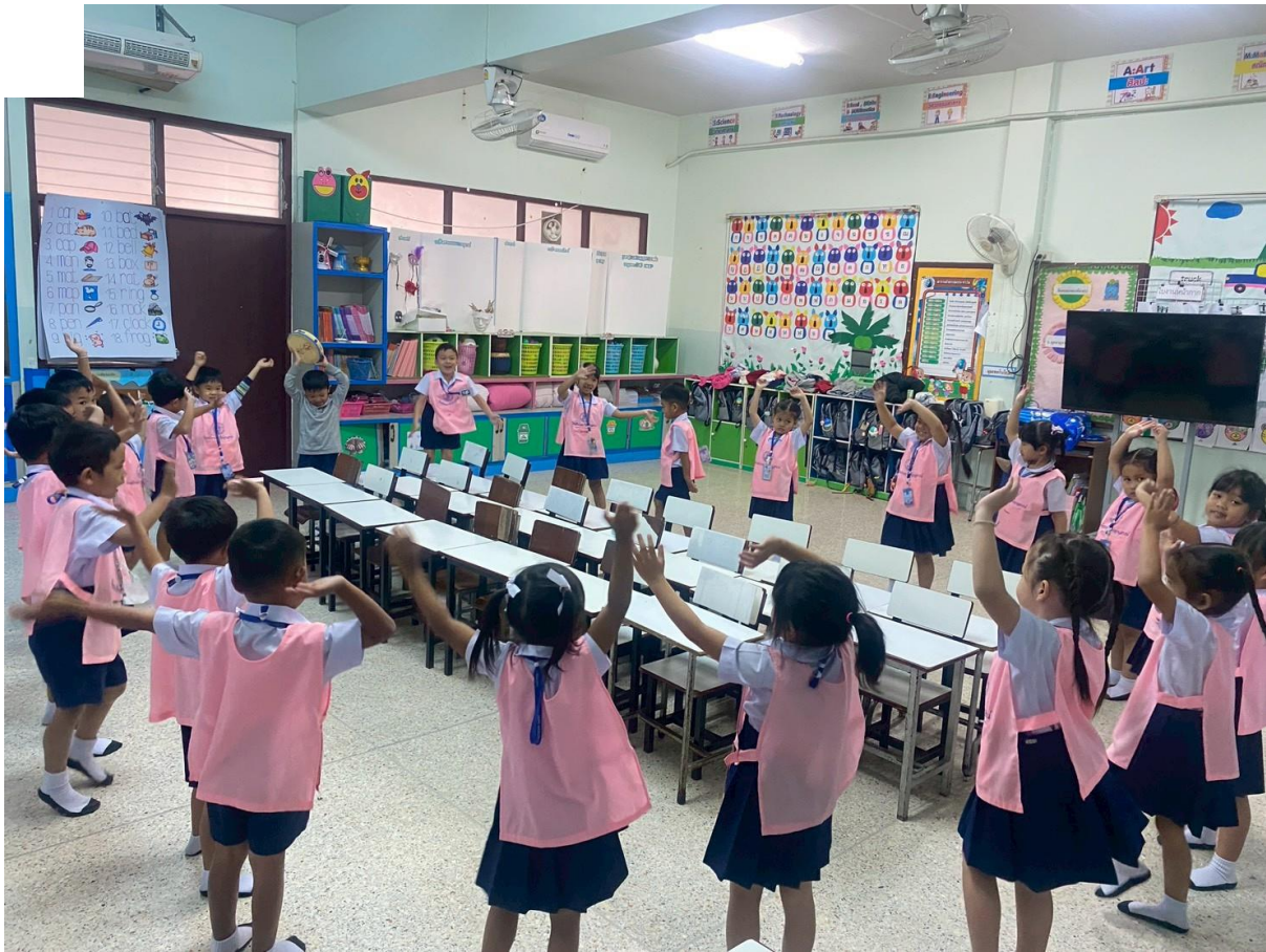
เด็กๆ ทำกิจกรรมเคลื่อนไหวร่างกายกับเพื่อนๆ ทั้งในห้องเรียนและนอกห้องเรียน