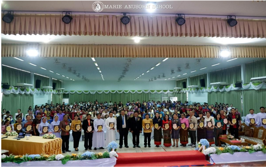
ได้รับมอบหมายทำหน้าที่ถ่ายภาพวันการศึกษาเอกชน