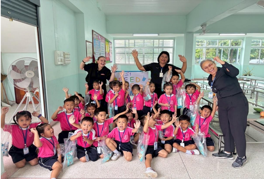
ได้รับมอบหมายทำหน้าที่ถ่ายภาพจัดกิจกรรม English Camp ระดับปฐมวัย