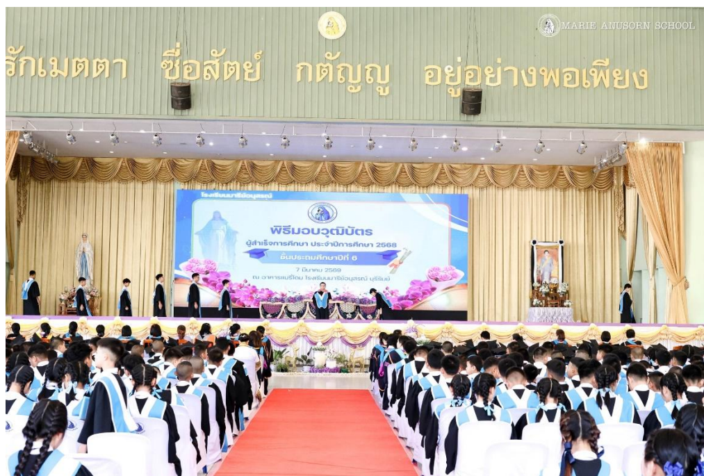
ได้รับมอบหมายทำหน้าที่บันทึกภาพในกิจกรรมภายในของโรงเรียน