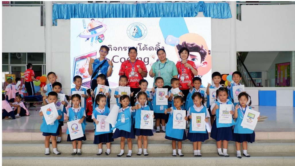
จัดกิจกรรมอบรมโครงการโค้ดดิ้งระดับปฐมวัย