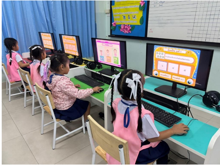
ปฏิบัติหน้าที่ครูผู้สอนในรายวิชาคอมพิวเตอร์ ระดับชั้นอนุบาล1-3