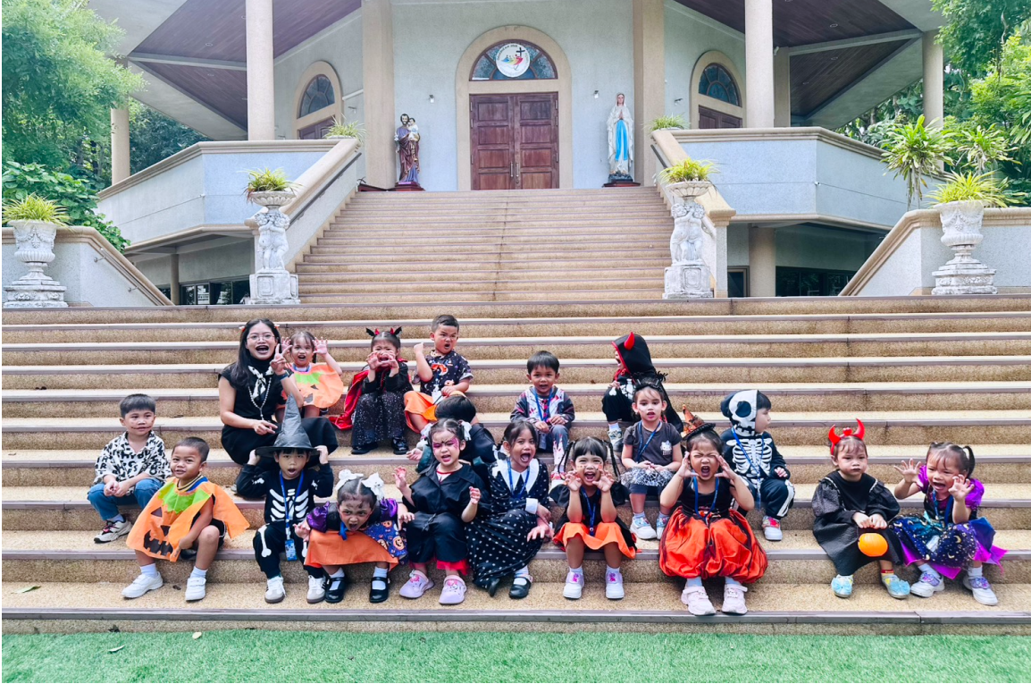
ร่วมกิจกรรมวันฮาโลวีน กับเพื่อนๆและเด็กๆ ชั้นอนุบาล 1/3