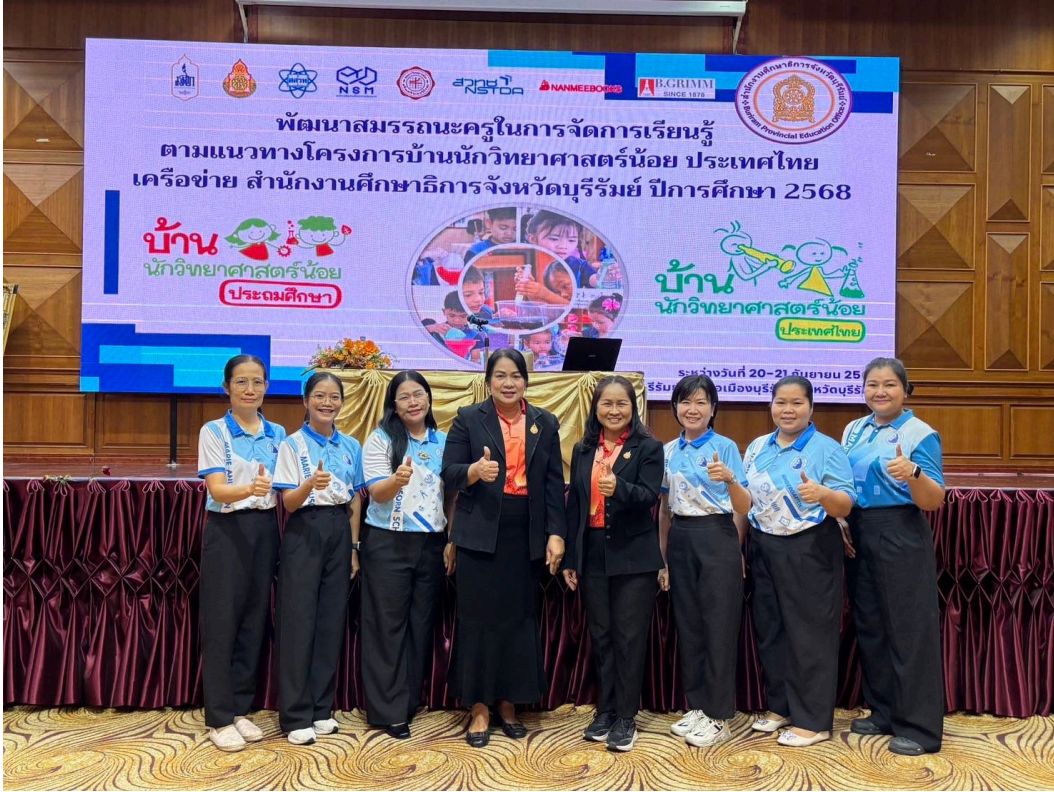
การอบรมเชิงปฏิบัติการพัฒนาสมรรถนะครูในการจัดการเรียนรู้ตามแนวทางโครงการบ้านนักวิทยาศาสตร์น้อย ประเทศไทย เครือข่าย สำนักงานศึกษาธิการจังหวัดบุรีรัมย์ ปีการศึกษา 2568