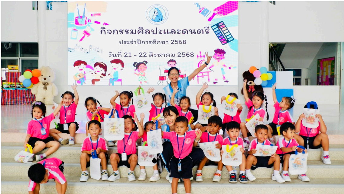
กิจกรรม ศิลปะและดนตรีประจำปีการศึกษา 2568