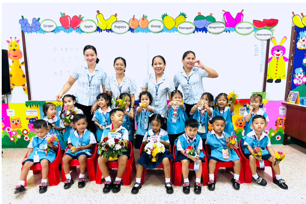
กิจกรรมวันไหว้ครูประจำปีการศึกษา2568