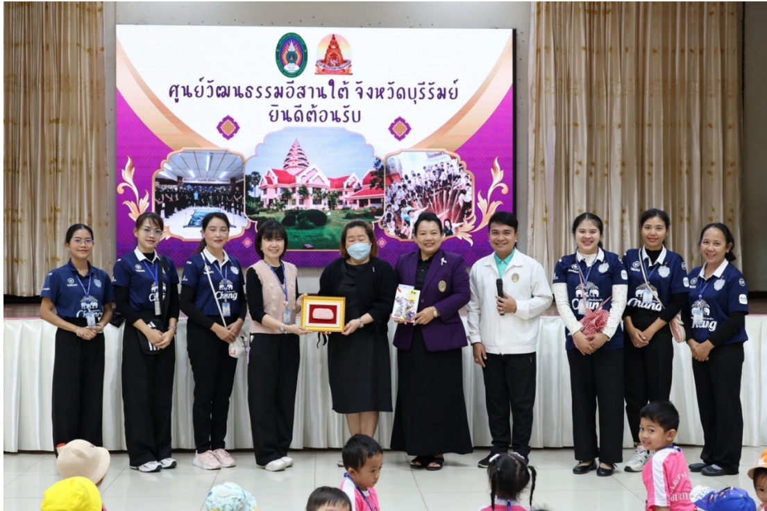
กิจกรรม ทศนศึกษา ณ ศูนย์พัฒนธรรมอิสานใต้ มหาวิทยาลัยราชภัฏบุรีรัมย์