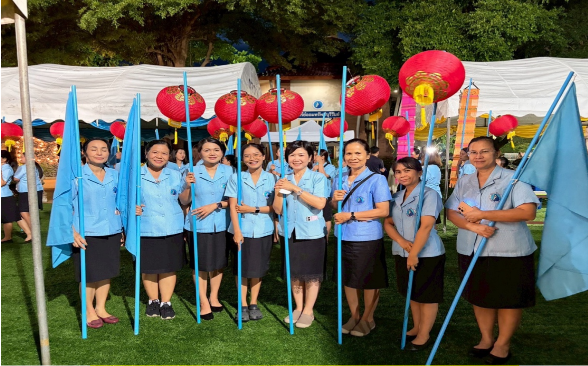
ร่วมทำกิจกรรมอื่นๆในโรงเรียน ที่ได้รับมอบหมายและจัดสถานที่กิจกรรมต่างๆ ในโรงเรียน