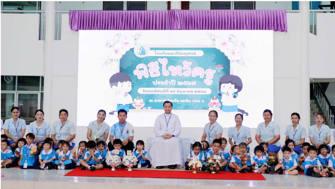
กิจกรรมวันไหว้ครูประจำปีการศึกษา ๒๕๖๘