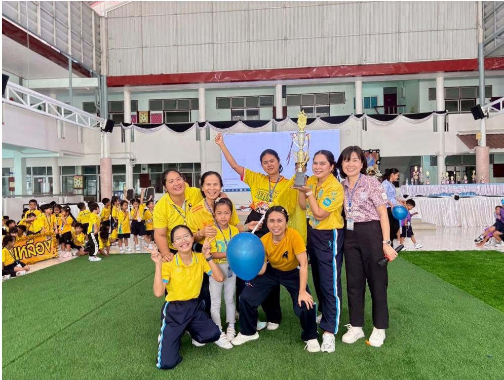
ร่วมกิจกรรม กีฬาสีภายในกับเพื่อนครูและเด็กๆ ระดับชั้นปฐมวัย