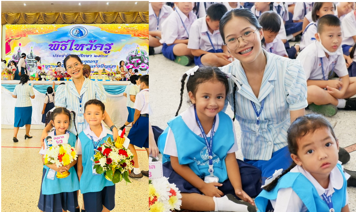
วันพฤหัสบดีที่ 19 มิถุนายน 2568