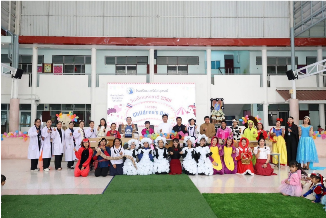
กิจกรรม วันเด็กกับเพื่อนครูและเด็กๆ ระดับชั้นปฐมวัย