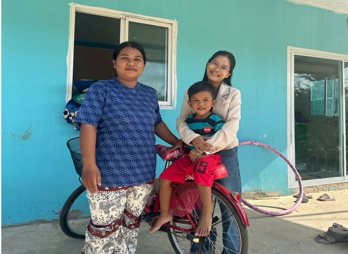
คุณครูเดินทางไปเยี่ยมบ้านนักเรียน