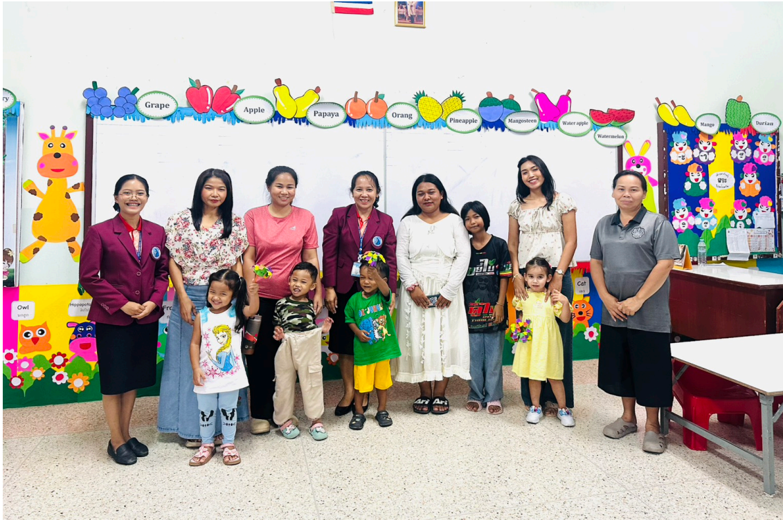
ร่วมกิจกรรมวันปฐมนิเทศผู้ปกครอง ระดับชั้นอนุบาล 1/3