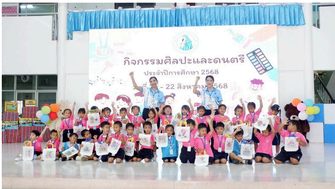
คุณครูร่วมกิจกรรมศิลปะและดนตรีกับเด็กๆประจำปีการศึกษา 2568