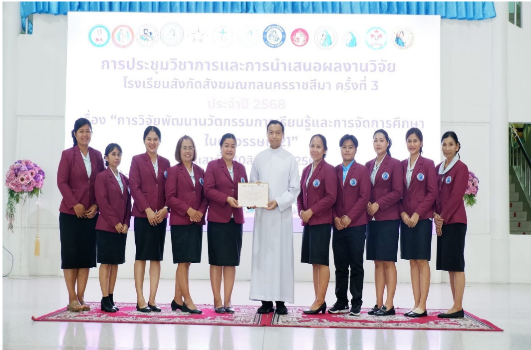
อบรมประชุมวิชาการและนำเสนอผลงานวิจัย ที่โรงเรียนมารีย์อนุสรณ์