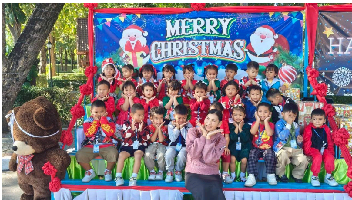
คุณครูร่วมกิจกรรม วันคริสต์มาสกับเด็กๆประจำปีการศึกษา 2568