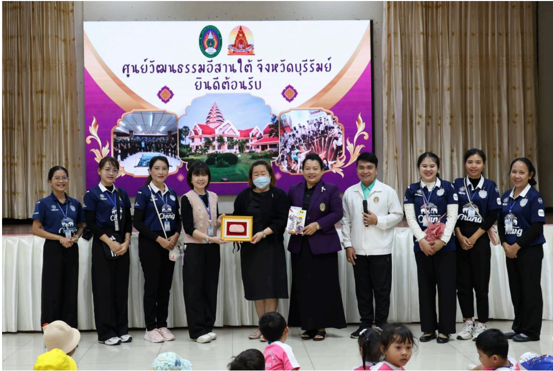
คุณครูและเด็กๆ ทัศนศึกษาที่ศูนย์ศูนย์วัฒนธรรมอีสานใต้ จังหวัดบุรีรัมย์