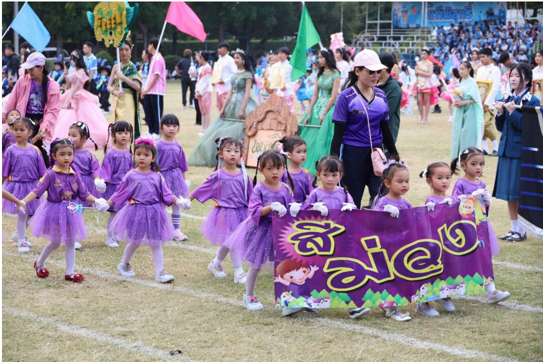
คุณครูและเด็กๆ ร่วมกิจกรรมงานกีฬา