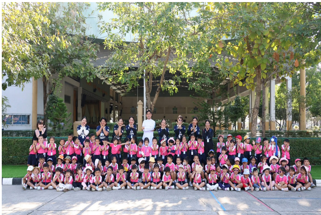
คุณครูและเด็กๆที่ศนศึกษาที่ศูนย์ศูนย์วัฒนธรรมอีสานใต้ จังหวัดบุรีรัมย์