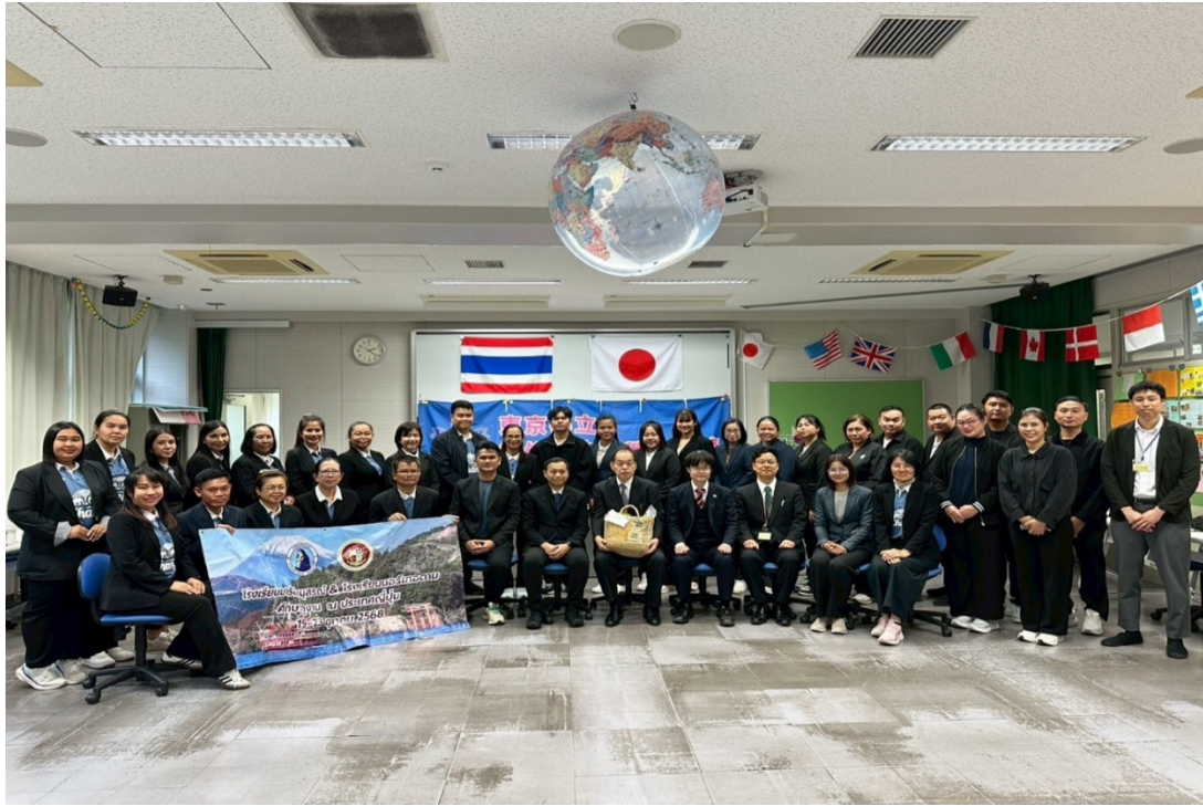
ไปทัศนศึกษาดูงานที่ประเทศญี่ปุ่น 5 วัน 4 คืน