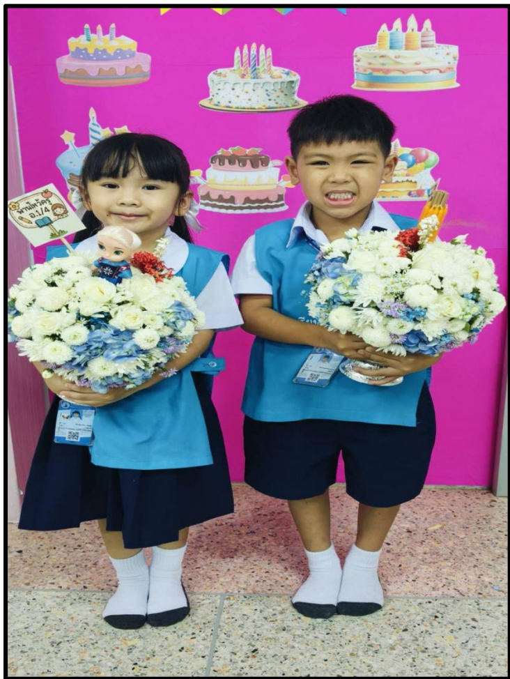
กิจกรรมวันไหว้ครู