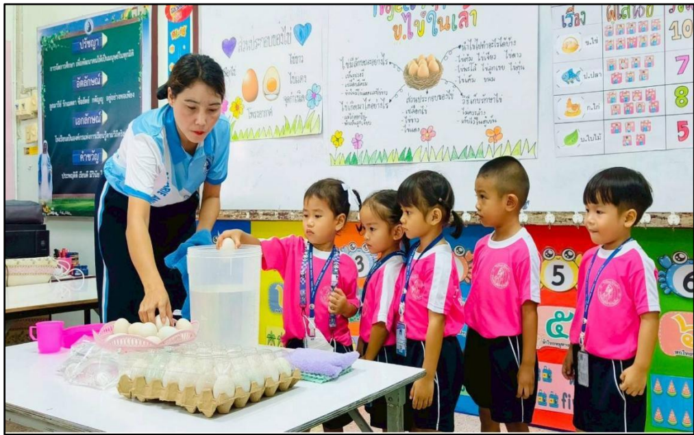
กิจกรรม โครงการงาน ข.ไข่ในเล้า