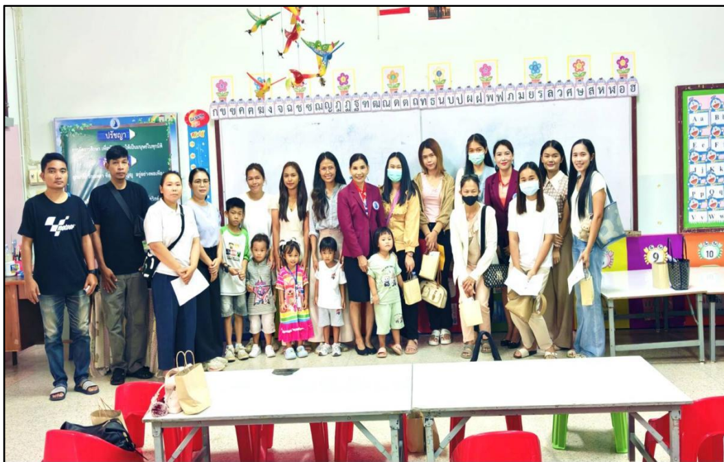
เข้าร่วมกิจกรรมปฐมนิเทศผู้ปกครอง ประจำปีการศึกษา 2568