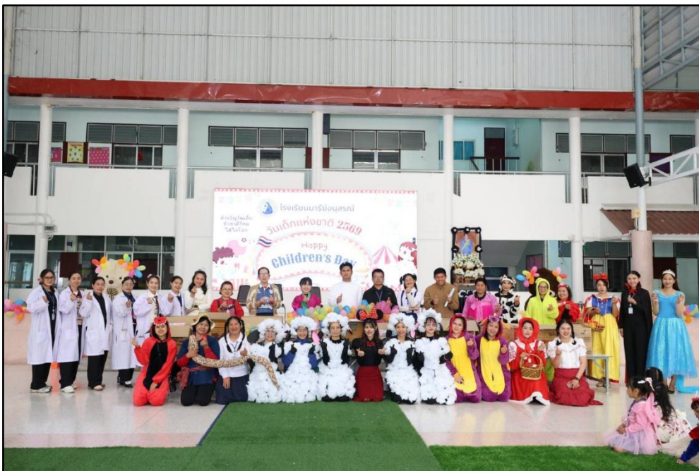
วันเด็กแห่งชาติ