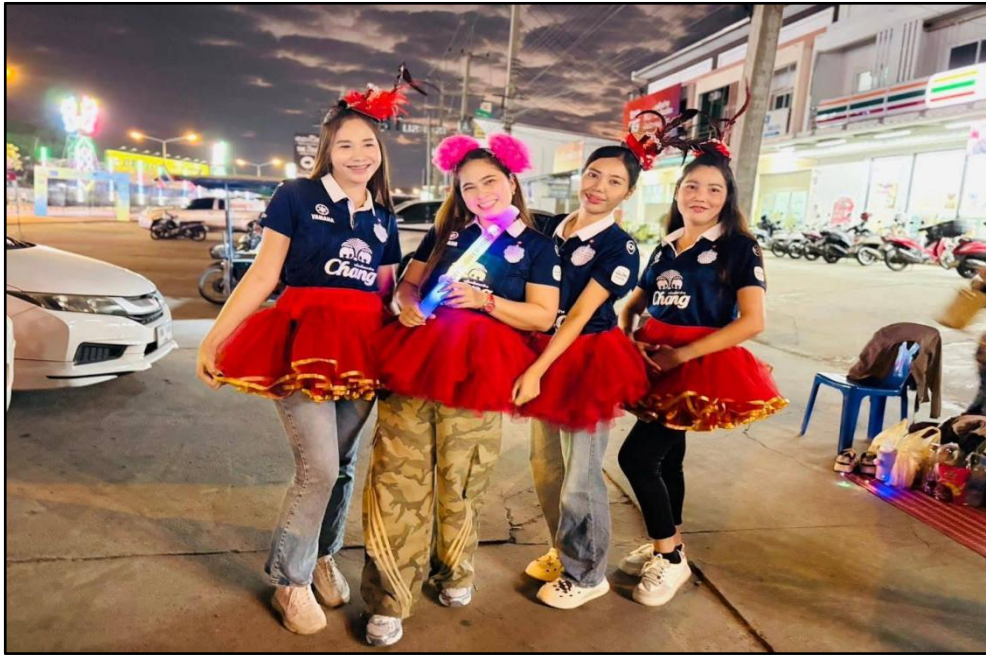
ร่วมเชียร์บุรีรัมย์มาราธอน