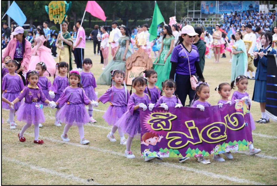
กิจกรรมกีฬา สื่อนูบาลูกรัก