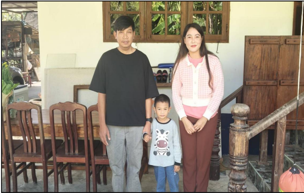
กิจกรรมเยี่ยมบ้าน