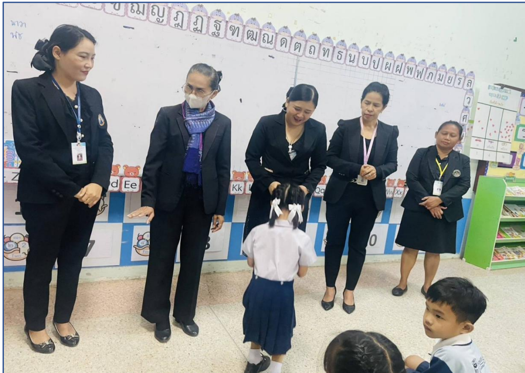
เป็นกรรมการตัดสินการประกวดมารยาทไทย