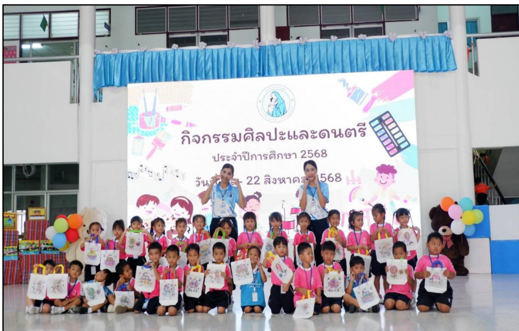
กิจกรรมเข้าค่ายศิลปะและดนตรี