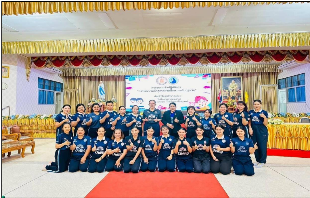
อบรมหลักสูตรปฐมวัย