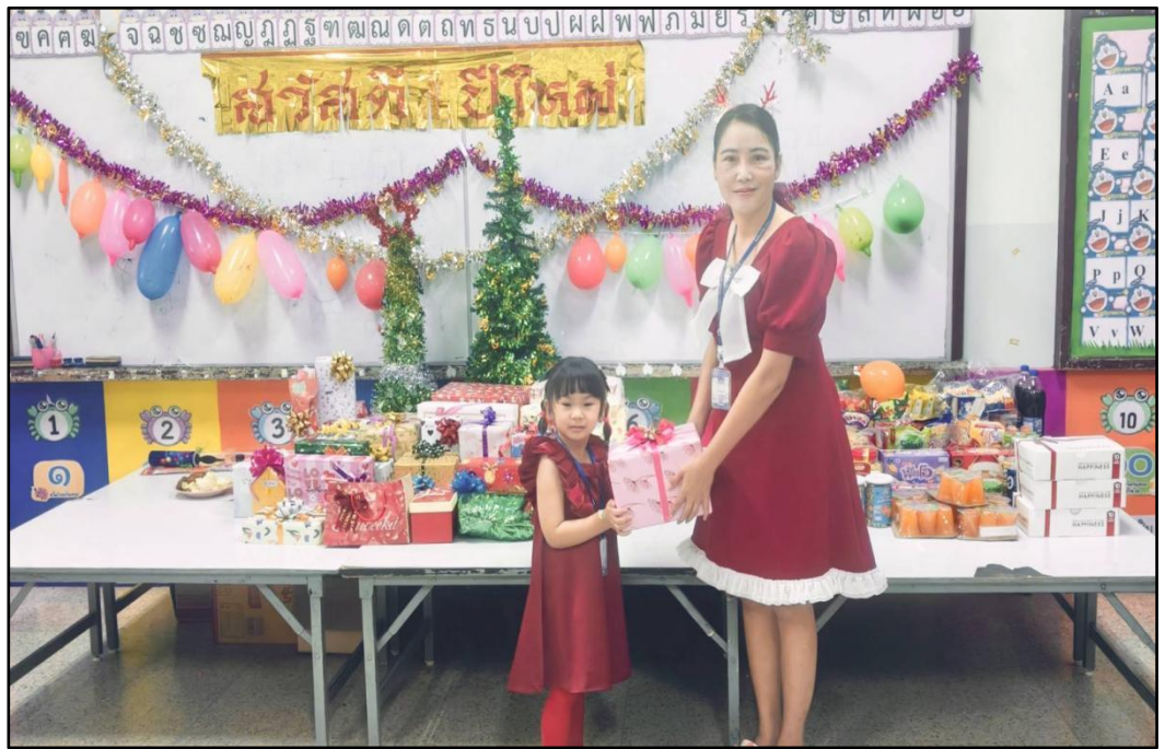
กิจกรรมวันคริสต์มาสและวันปีใหม่