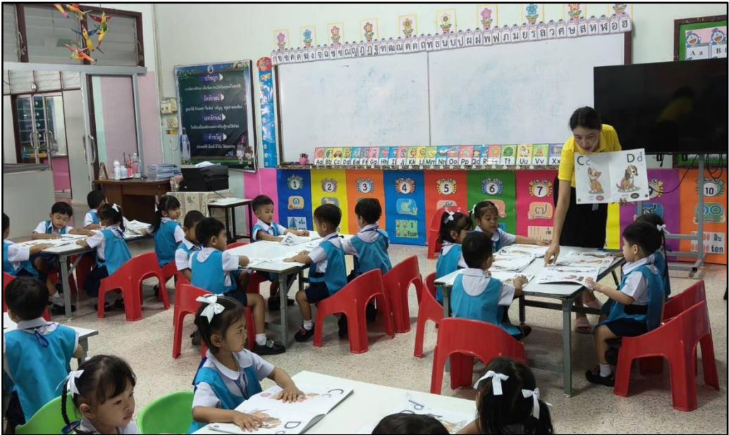
โครงการส่งเสริมการอ่าน