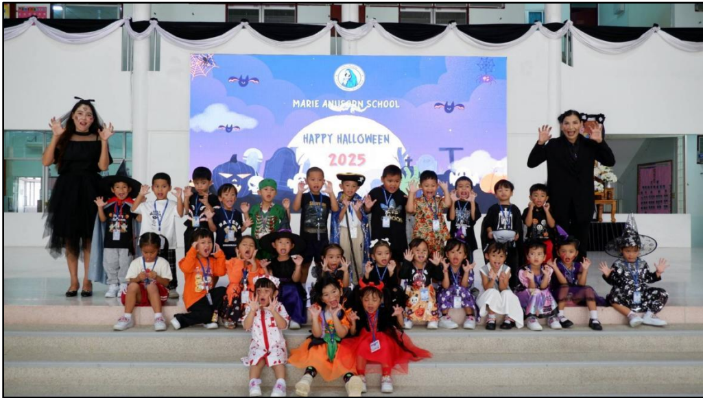
กิจกรรมวันฮาโลวีน