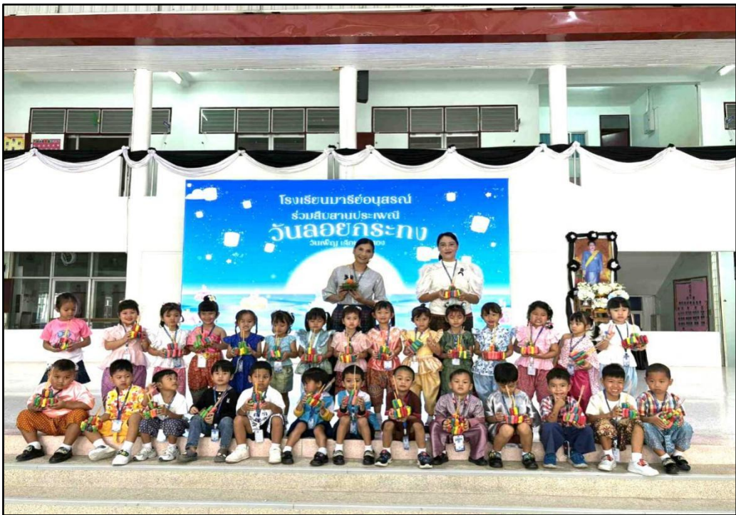
กิจกรรมวันลอยกระทง