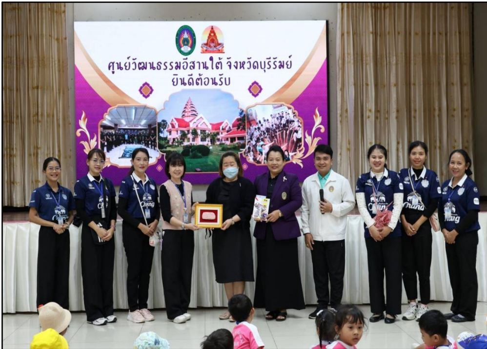
ทัศนศึกษาที่ศาลหลักเมือง