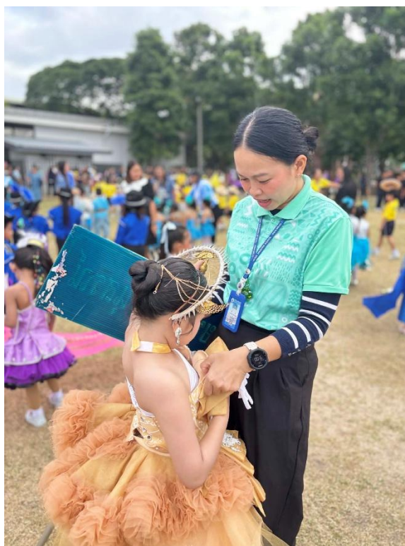
กิจกรรมกีฬา ประจำปีการศึกษา 2568