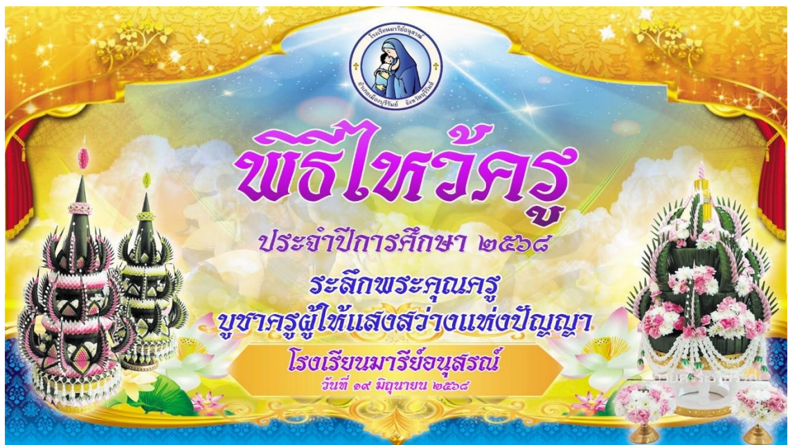
ร่วมพิธีไหว้ครู ประจำปีการศึกษา 2568