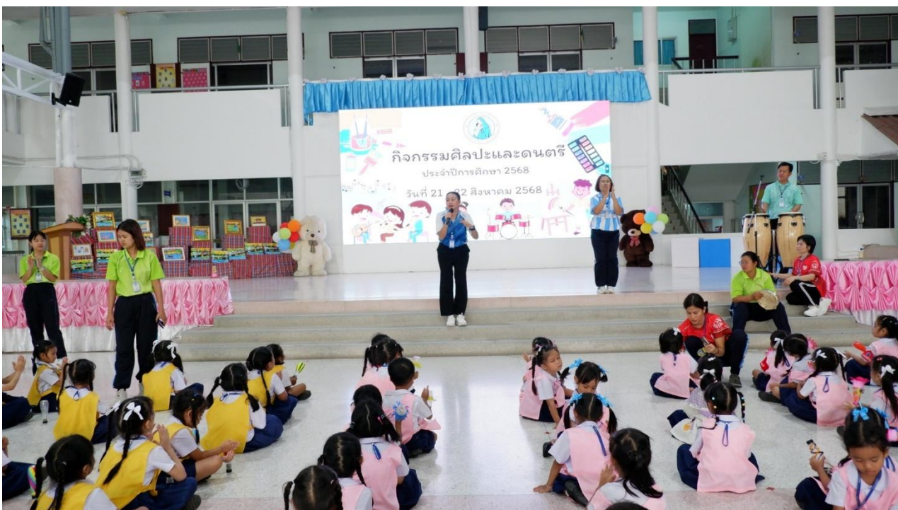
กิจกรรมเข้าค่ายศิลปะและดนตรี ปีการศึกษา 2568