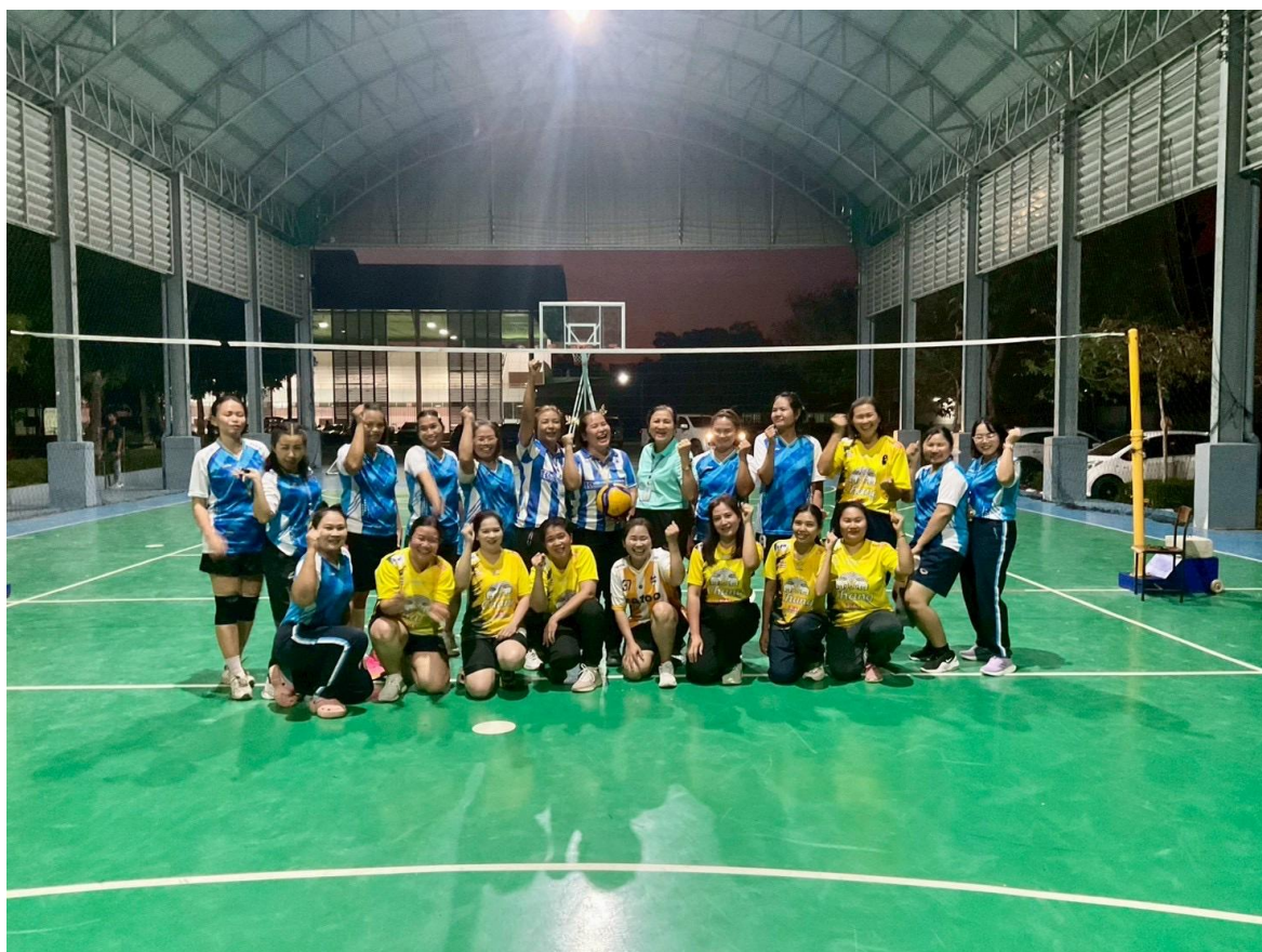
รับรางวัลกีฬาบุคลากร ชนะเลิศกีฬาวอลเลย์บอล