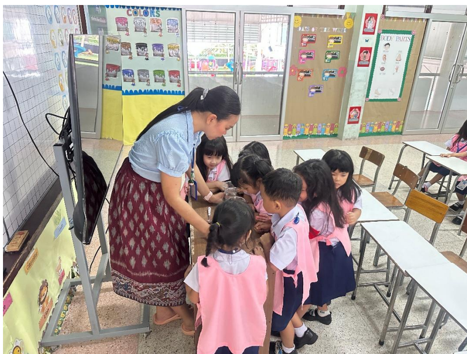
ภาพกิจกรรมการเรียนการสอนในห้องเรียน