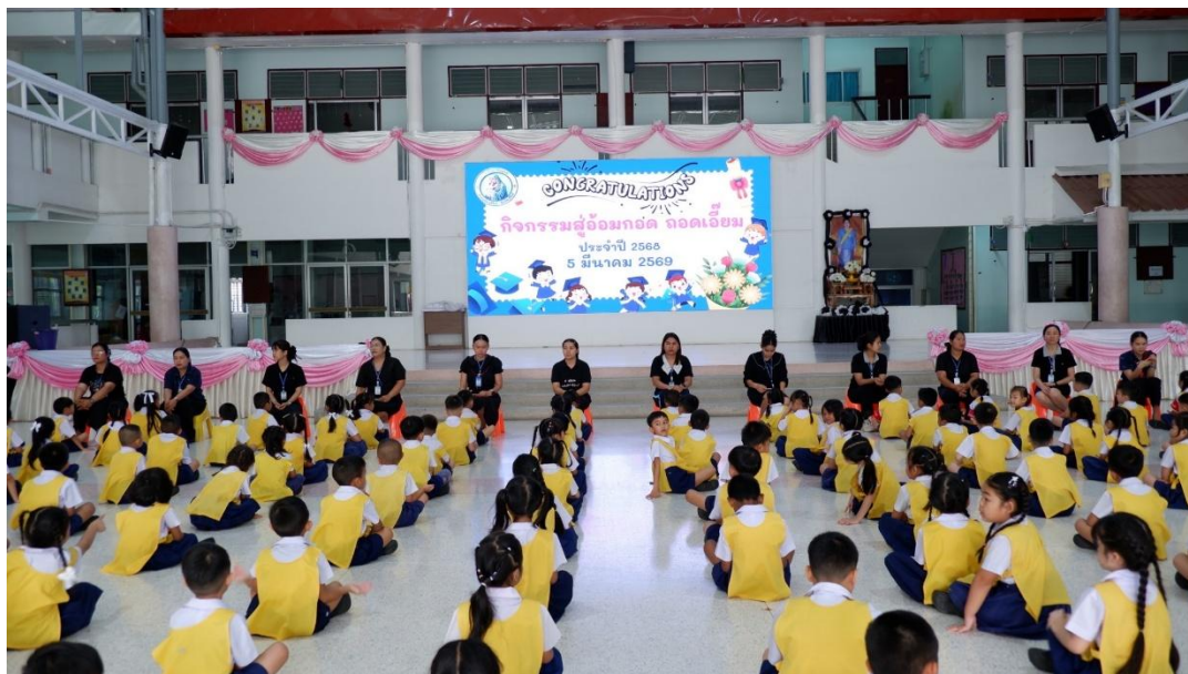
กิจกรรม สู่อ้อมกอด ถอดผ้าเอี๊ยม ให้กับนักเรียนชั้นอนุบาล 3