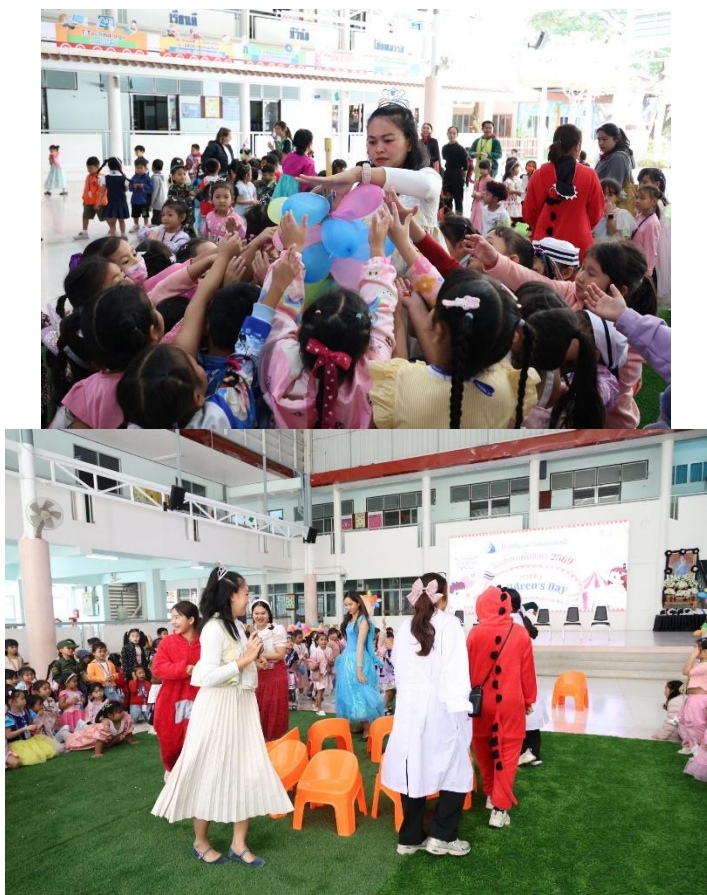
กิจกรรมวันเด็กแห่งชาติ