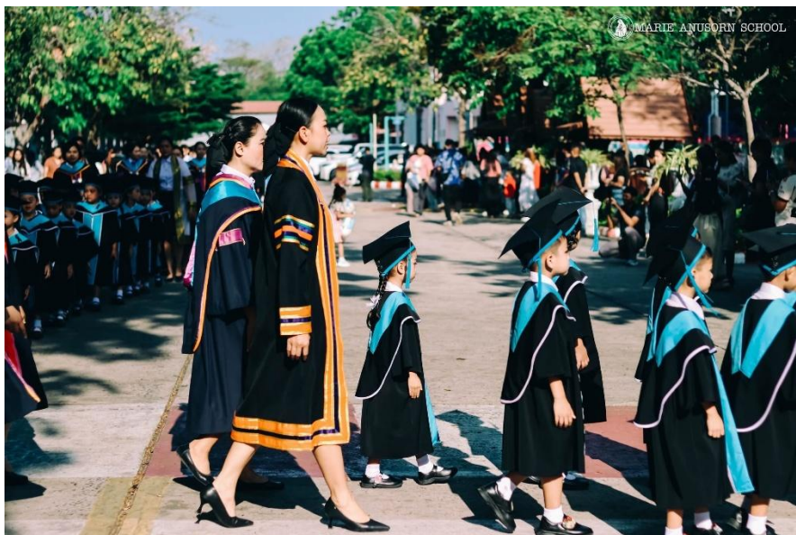
เข้าร่วมพิธีมอบวุฒิปัตร์ประจำปีการศึกษา 2568 คุณนักเรียนแถวที่ 4