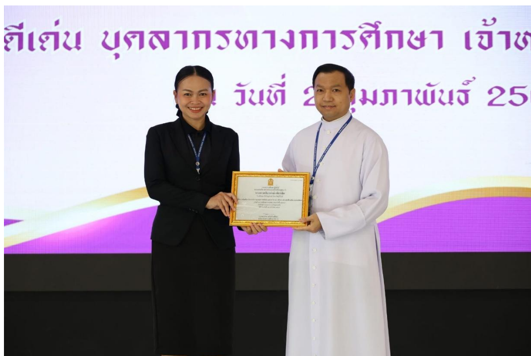
ได้รับรางวัลครูดีเด่น