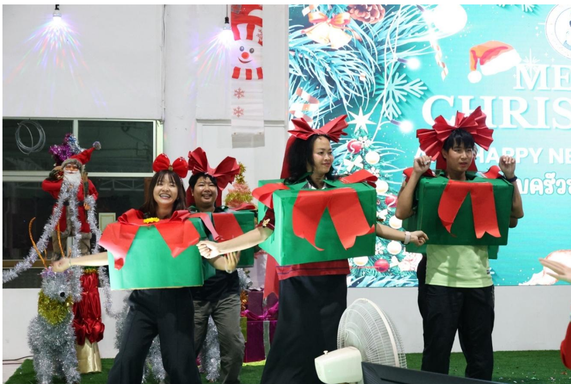
เข้าร่วมกิจกรรม Merry Christmas and Happy new year