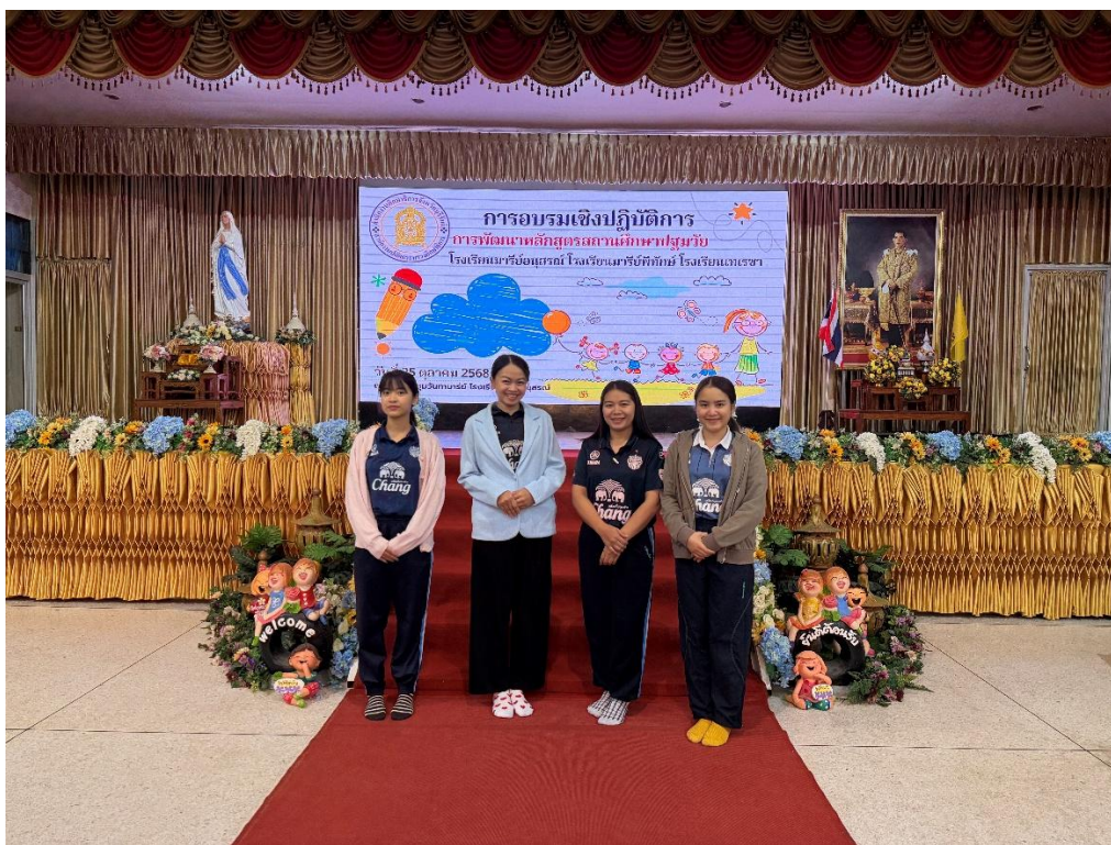
เข้าร่วมการอบรมเชิงปฏิบัติการ การพัฒนาหลักสูตรสถานศึกษาปฐมวัย