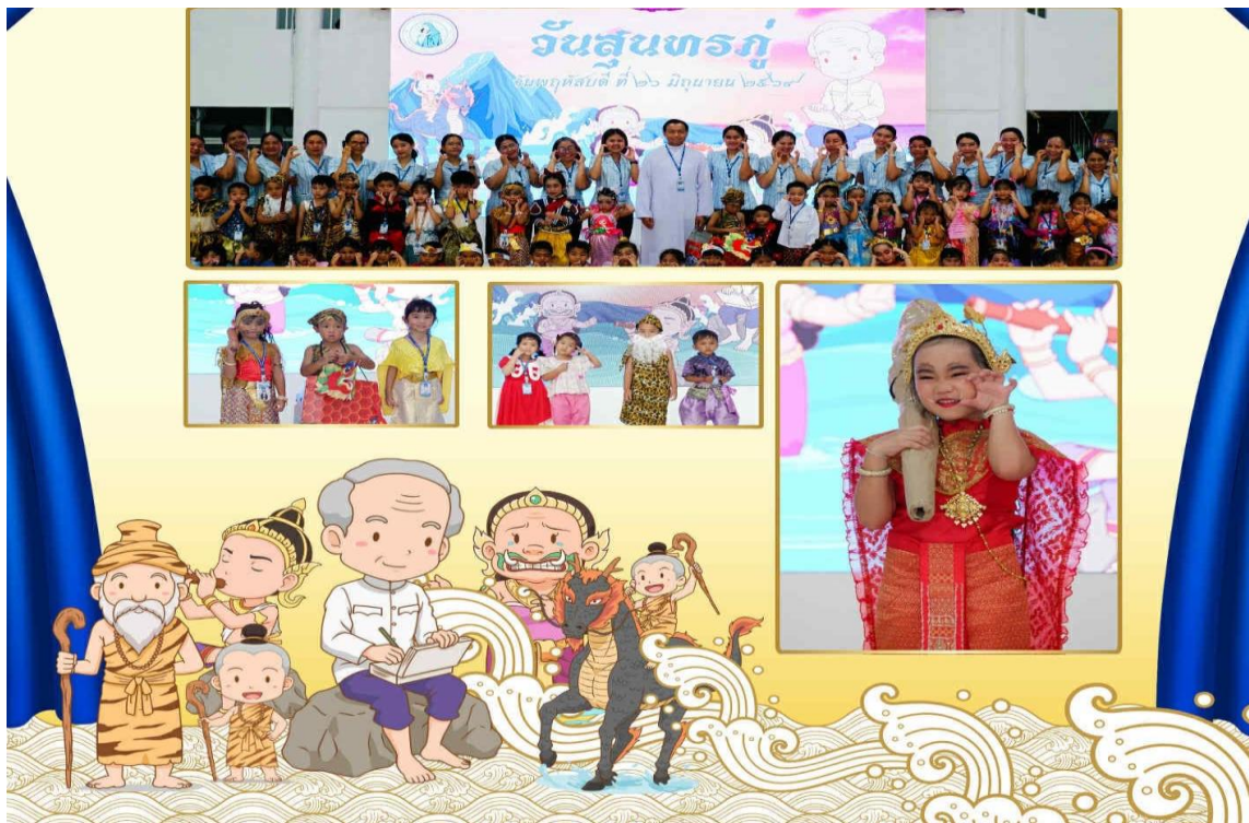
กิจกรรมวันสุนทรภู่ ระดับปฐมวัย