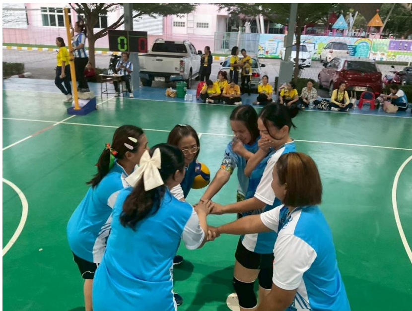
เข้าร่วมกิจกรรมกีฬามหาสนุก ประจำปีการศึกษา 2568