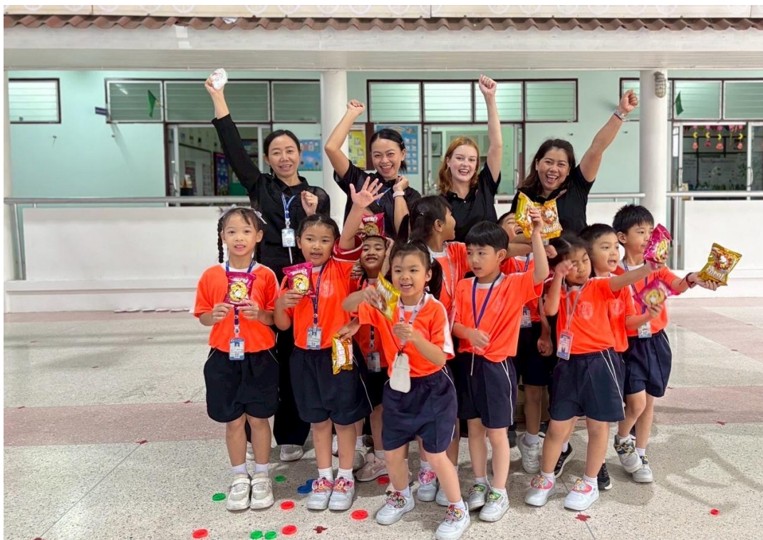
จัดกิจกรรมเข้าค่าย English ประจําฐาน Find the colours