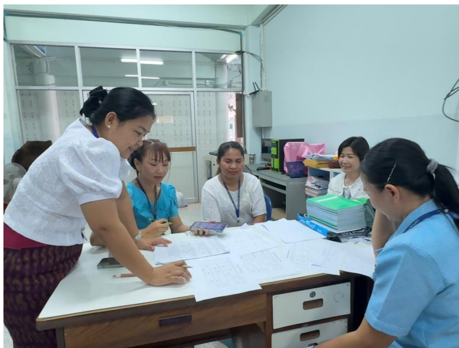
ร่วมจัดตารางสอนกับหัวหน้าสาระภาษาต่างประเทศ และครูกลุ่มสาระภาษาต่างประเทศ