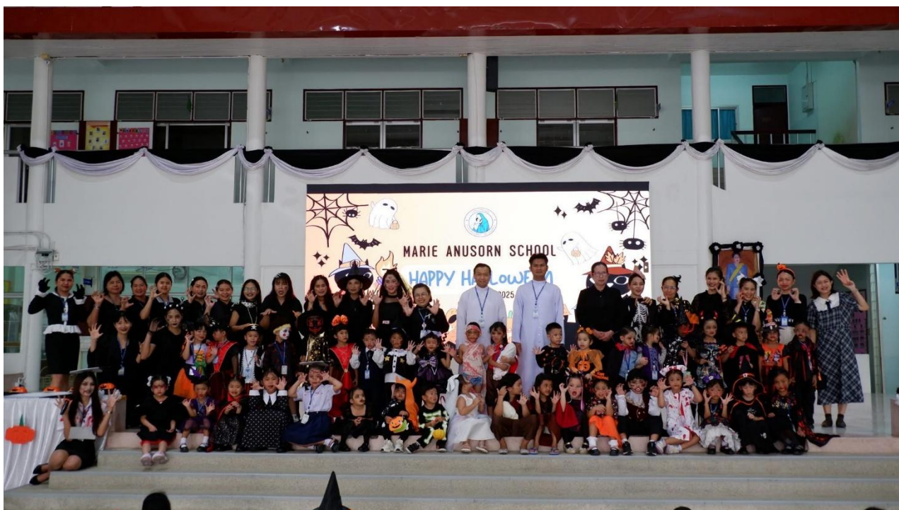
กิจกรรมวันฮาโลวีน ปีการศึกษา 2568