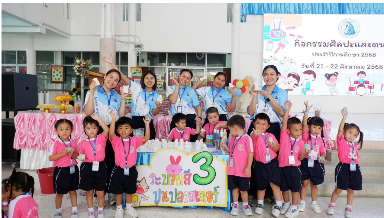
กิจกรรมเข้าค่ายศิลปะและดนตรี เป็นครูประจำฐานระบายสีปูนพลาสติก