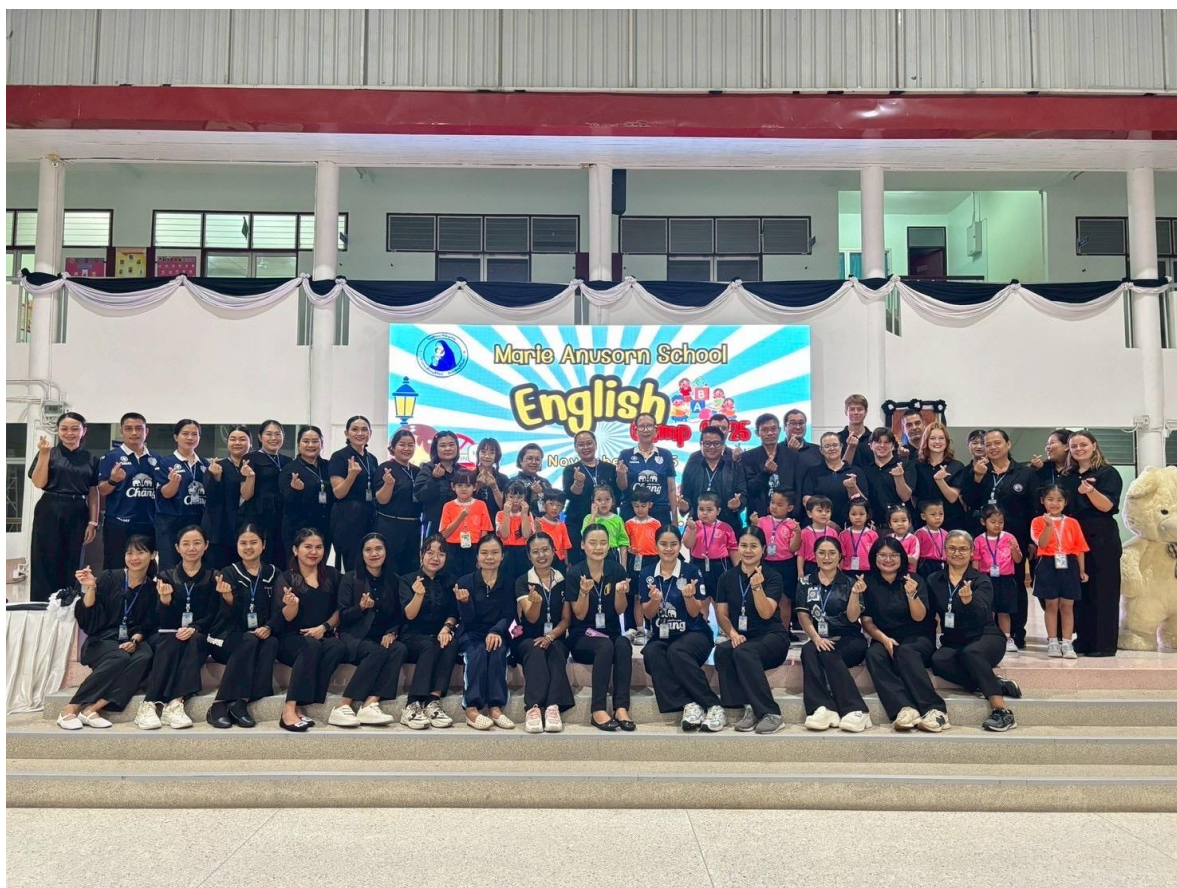
กิจกรรมเข้าค่าย English Camp ห้องเรียน ICEP ระดับปฐมวัย