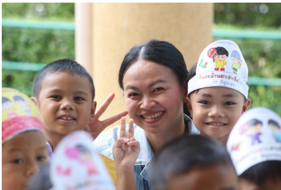
เข้าร่วมกิจกรรมวันต่อต้านยาเสพติดโลก พาเด็กๆเดินขบวนภายในโรงเรียน