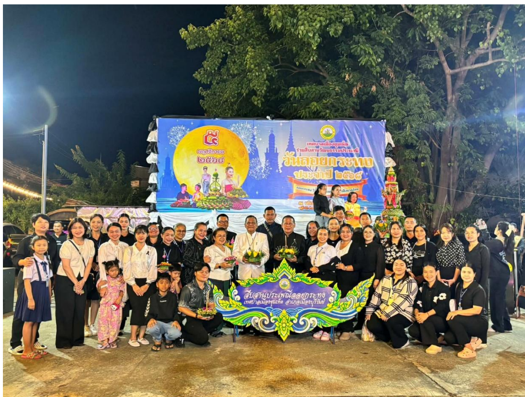
เข้าร่วมสืบสานประเพณีวันลอยกระทงร่วมกับเทศบาลชุมเห็ด