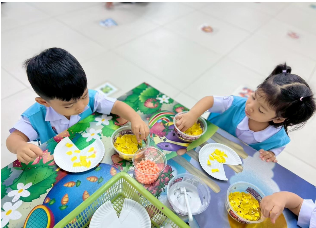
รูปภาพที่ 18 กิจกรรมศิลปะ