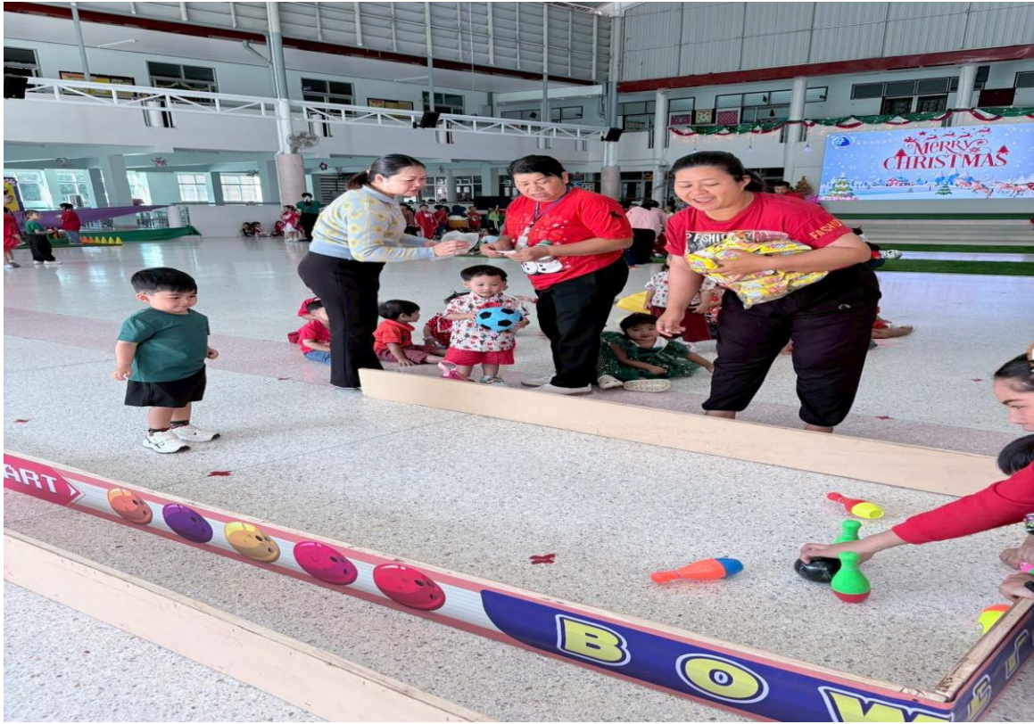
รูปภาพที่ 12 กิจกรรมคริสต์มาส