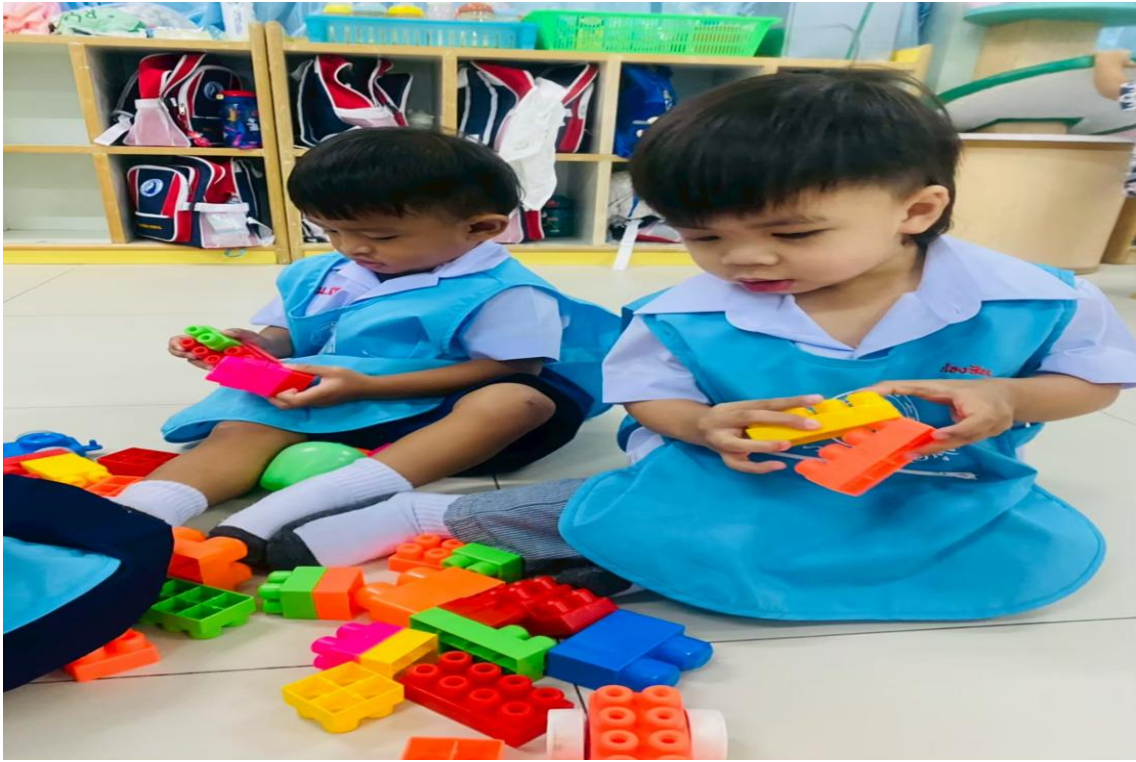
รูปภาพที่ 18 กิจกรรมเล่นมุมบล็อก