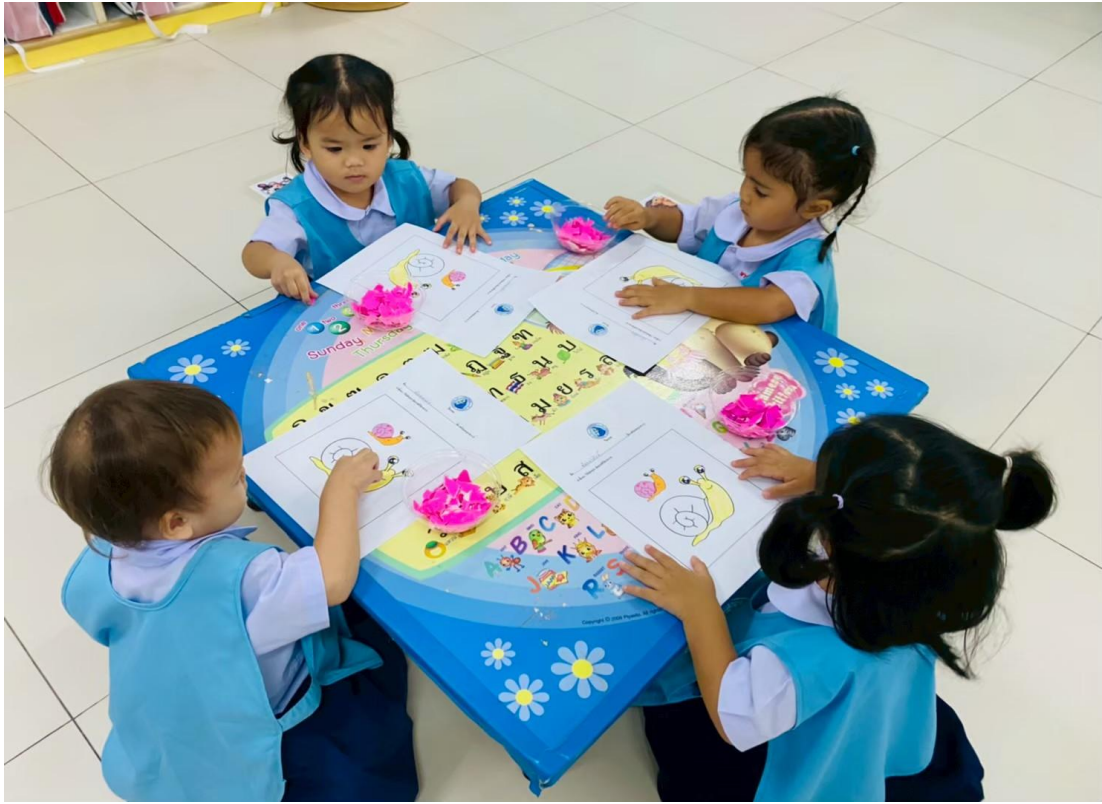
รูปภาพที่ 10 กิจกรรมศิลปะ