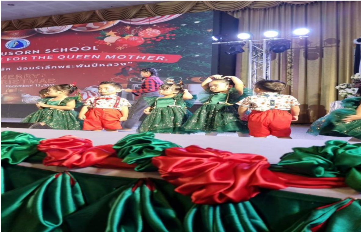
รูปภาพที่ 16 กิจกรรมวันคริสต์มาส