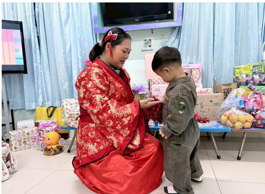
รูปภาพที่ 14 กิจกรรมวันปีใหม่