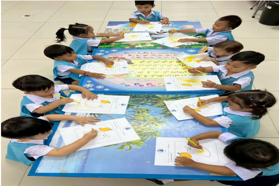
รูปภาพที่ 9 กิจกรรมศิลปะ