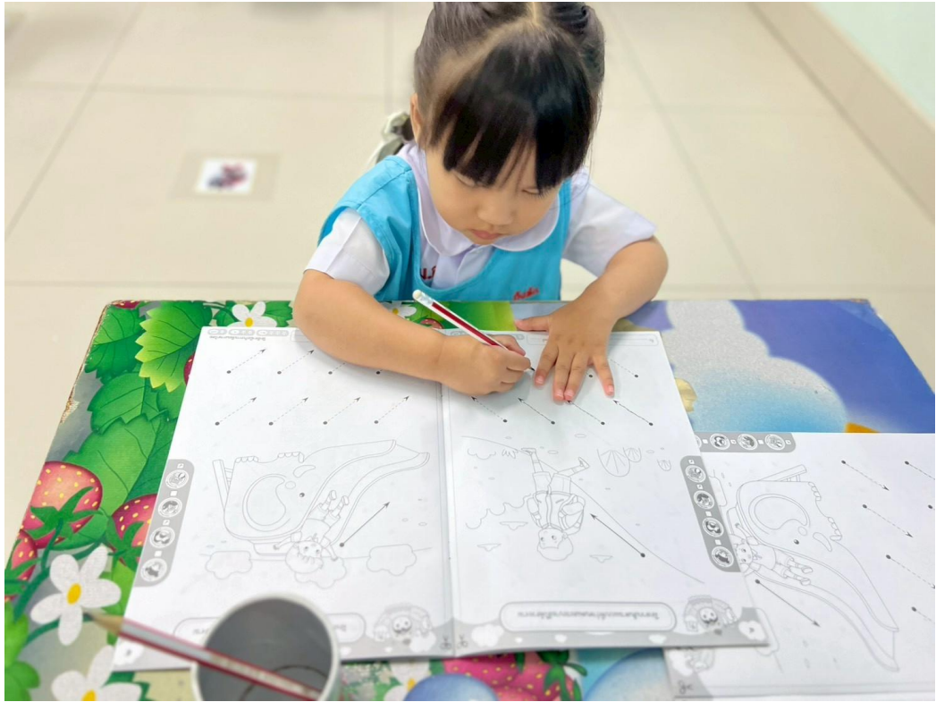
รูปภาพที่ 2 กิจกรรมฝึกลากเส้นตามรอยปะ