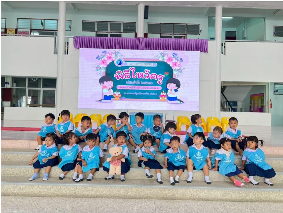
รูปภาพที่ 1 กิจกรรมวันไหว้ครู