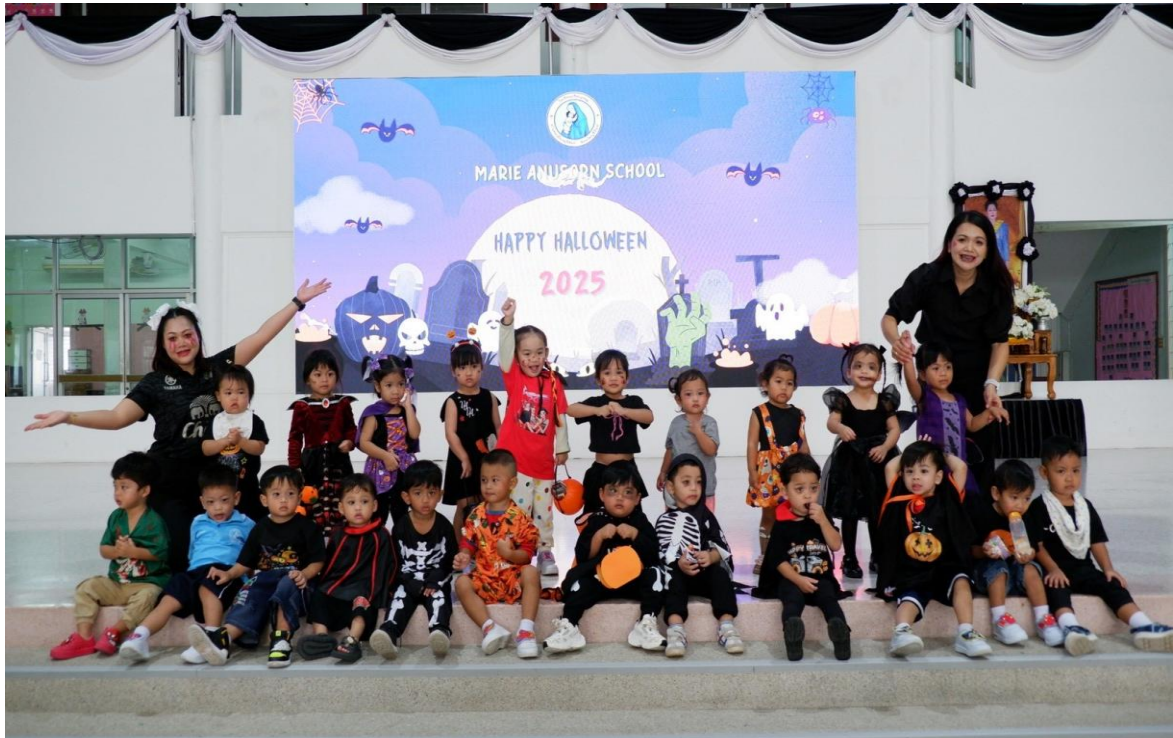
รูปภาพที่ 8 กิจกรรมวันฮาโลวีน