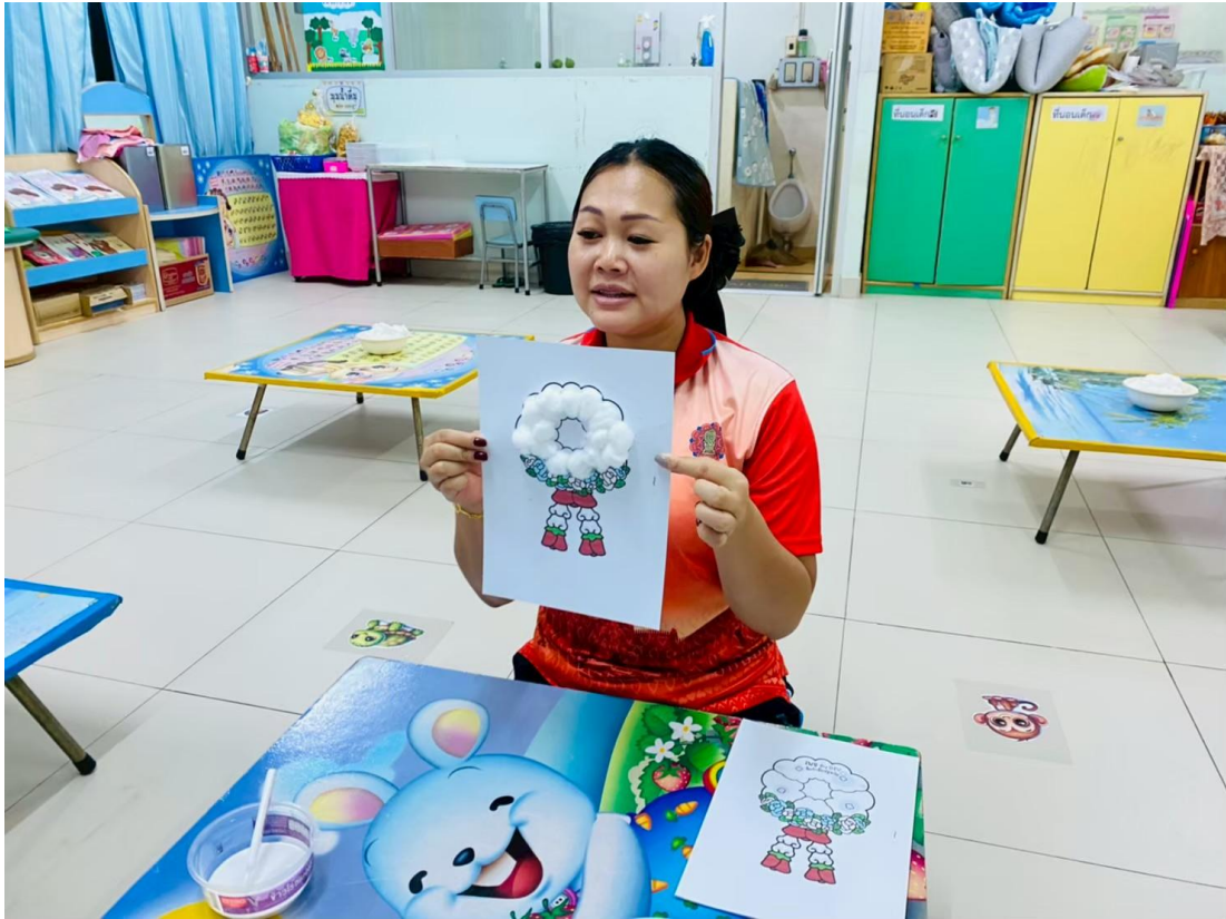
รูปภาพที่ 15 กิจกรรมศิลปะ