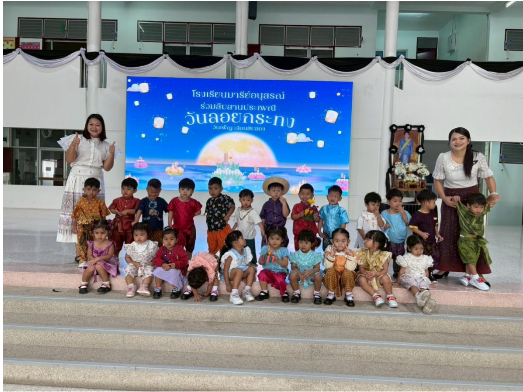
รูปภาพที่ 6 กิจกรรมวันลอยกระทง