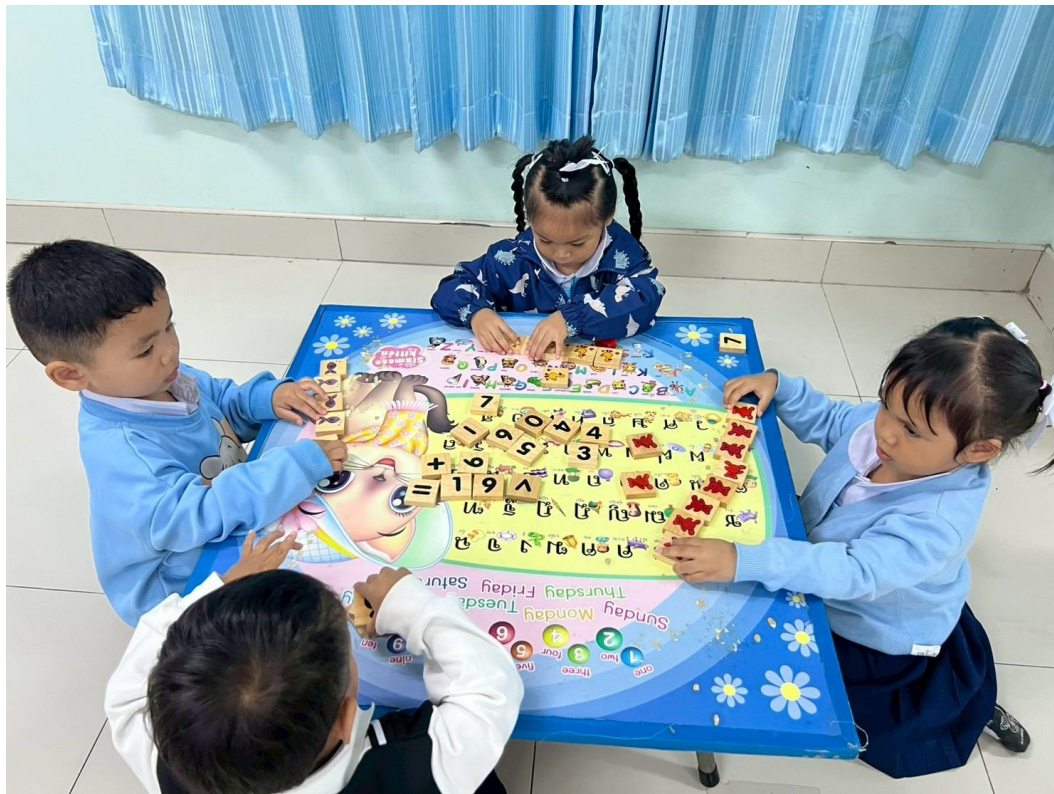
รูปภาพที่ 3 กิจกรรมเกมการศึกษา