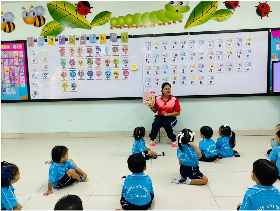
รูปภาพที่ 4 กิจกรรมเล่านิทาน