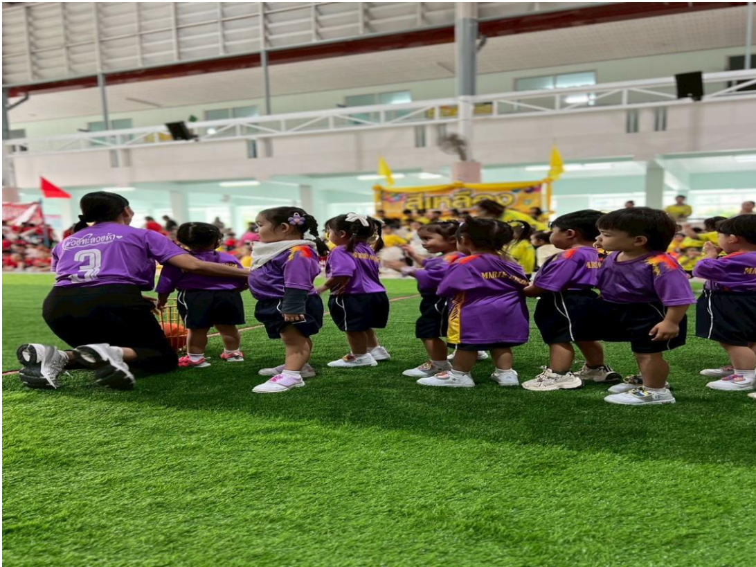
รูปภาพที่ 11 กิจกรรมวันกีฬา