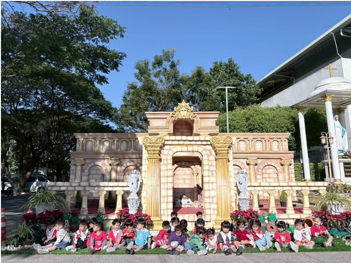
รูปภาพที่ 5 กิจกรรมวันคริสต์มาส