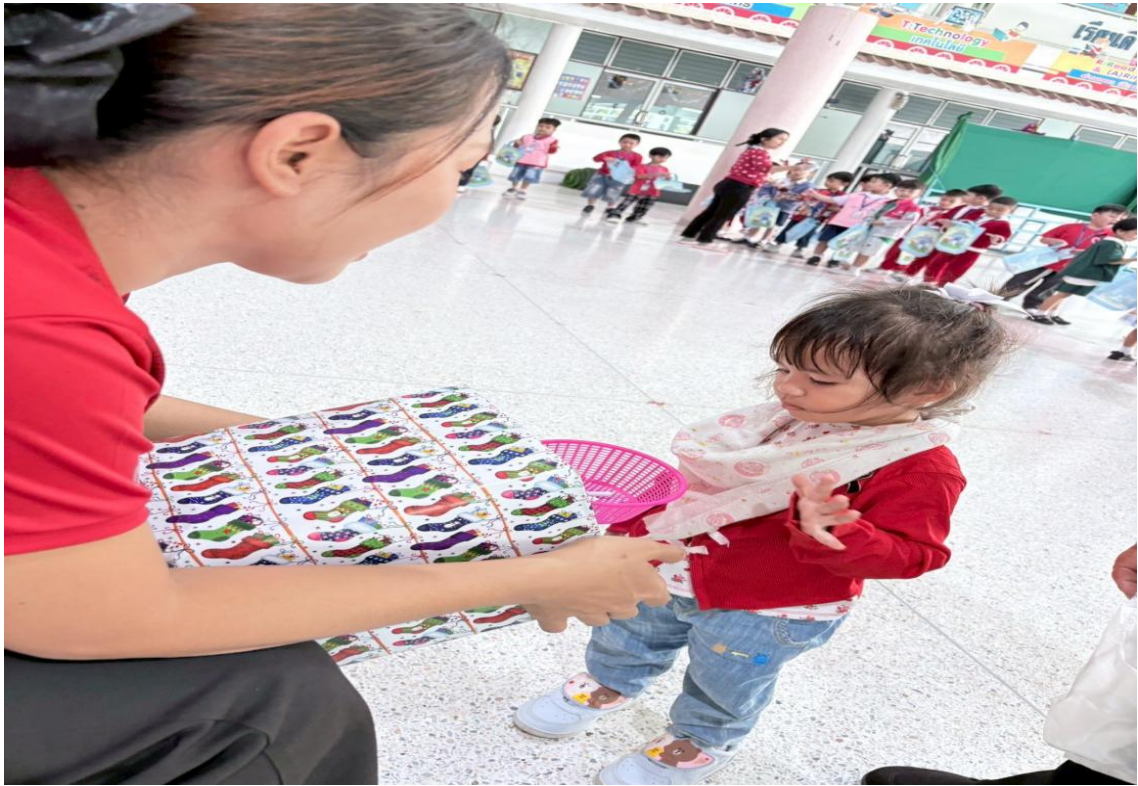
รูปภาพที่ 17 กิจกรรมวันสอยดาว