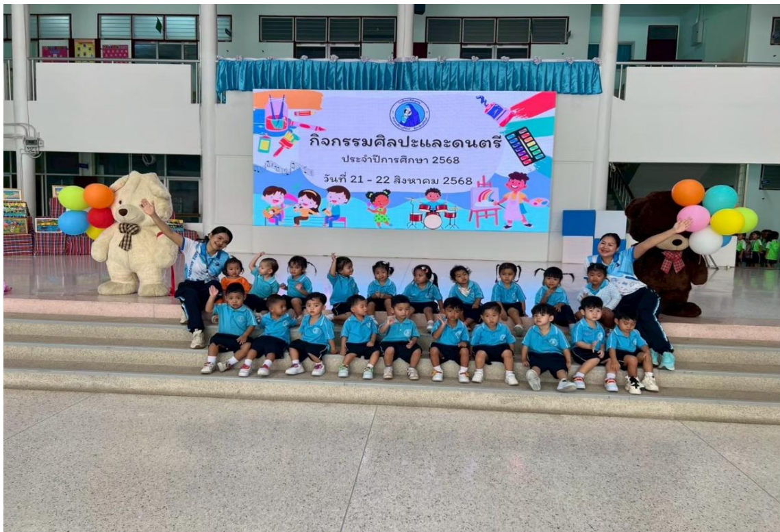
รูปภาพที่ 7 กิจกรรมศิลปะและดนตรี