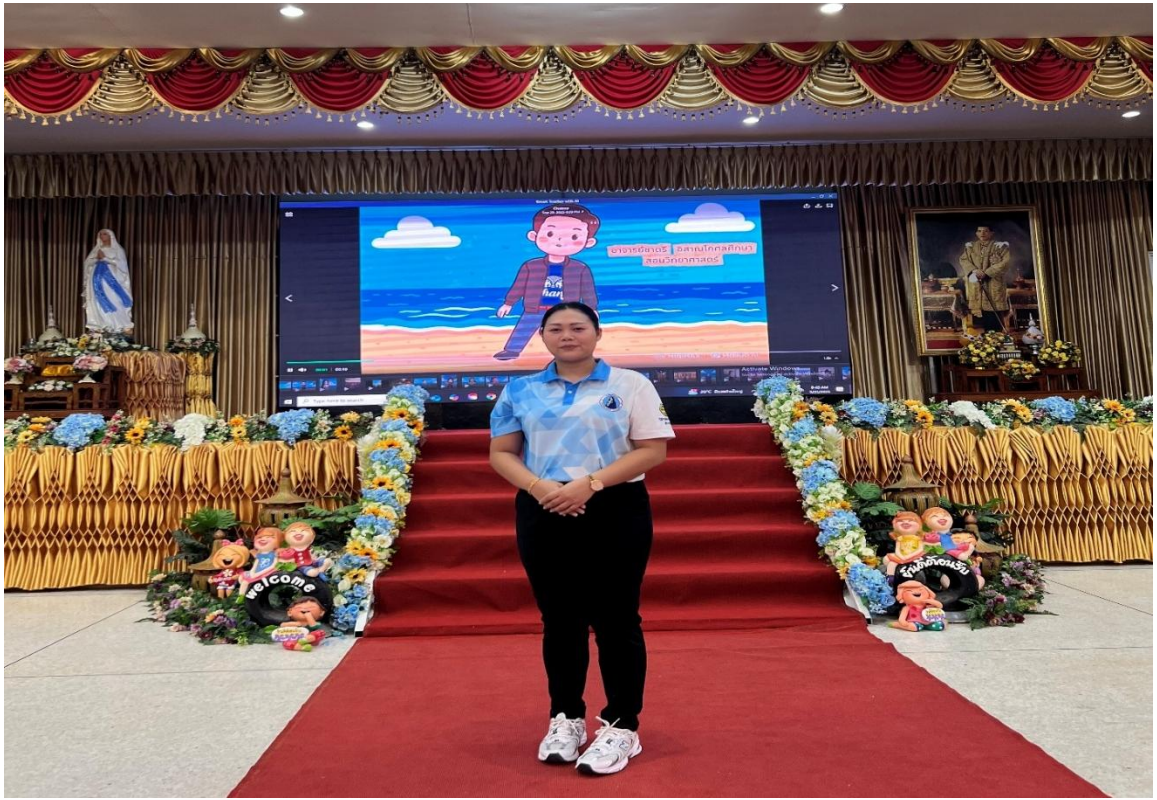
การอบรมเชิงปฏิบัติการ การเสริมสร้างพลังครูด้วย AI (Smart Teacher With AI)