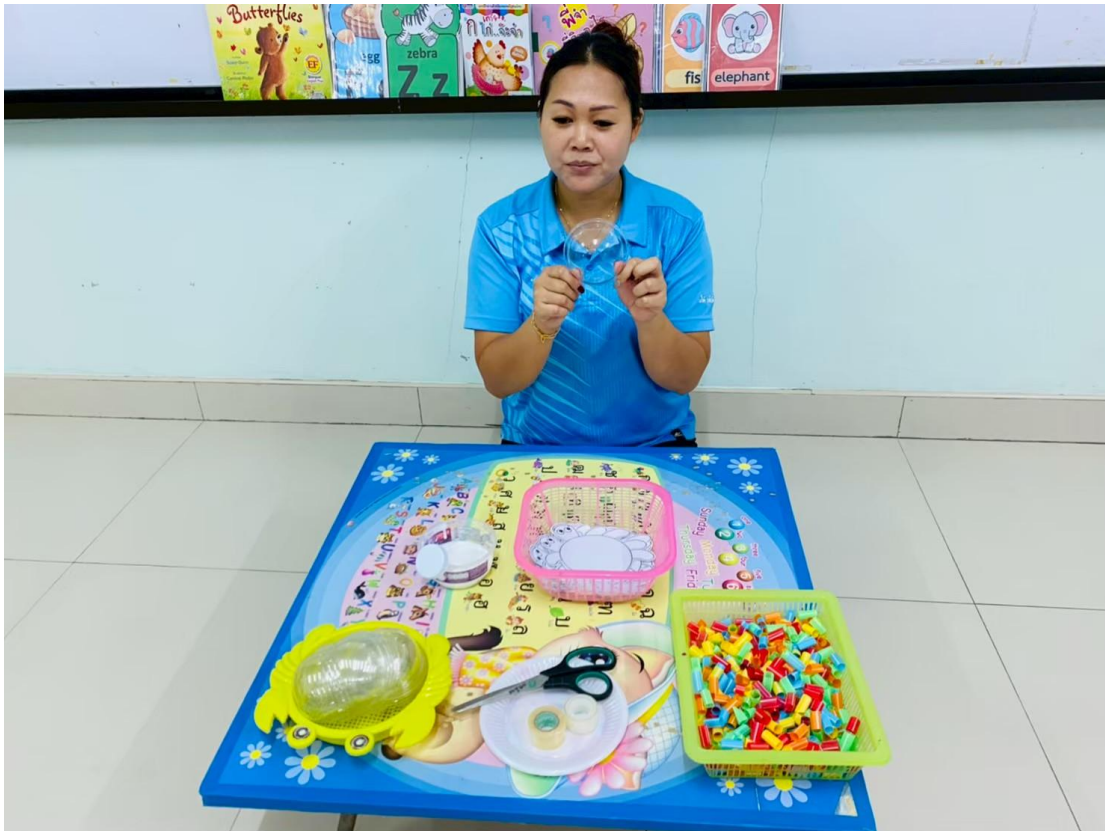
รูปภาพที่ 13 กิจกรรมศิลปะ