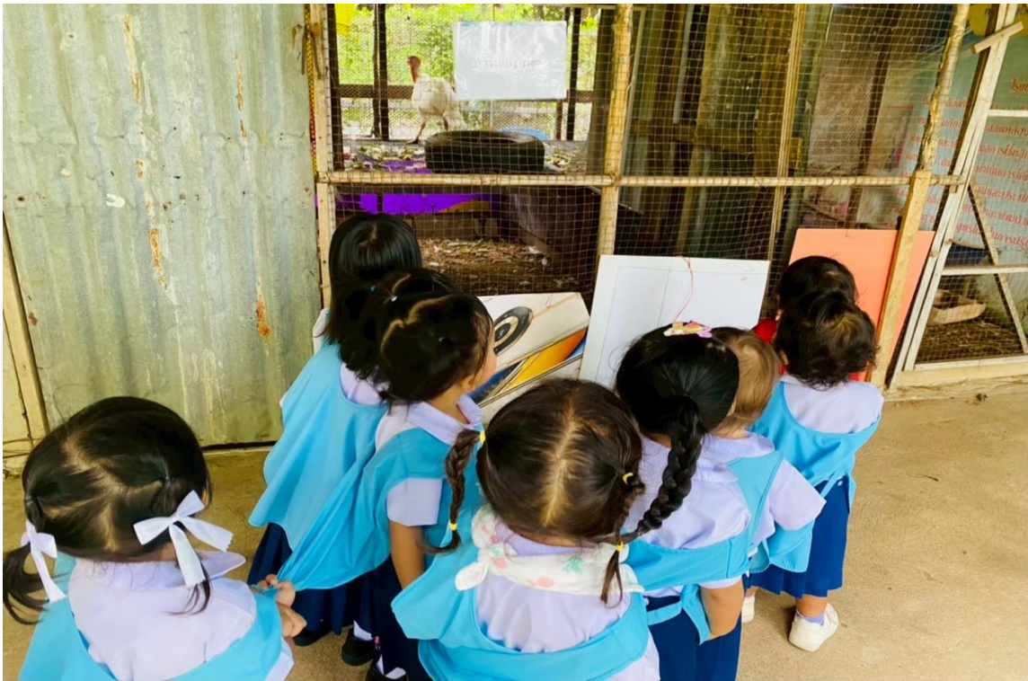
รูปภาพที่ 18 กิจกรรมแหล่งเรียนรู้กลางแจ้งเรียน “สวนเกษตร”