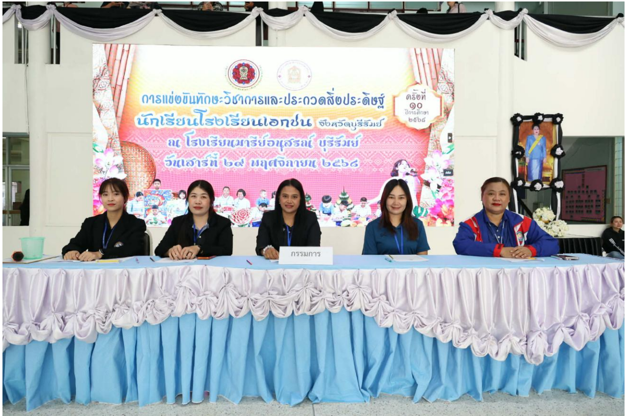
ปฏิบัติหน้าที่คณะกรรมการการแข่งขันทักษะวิชาการและประกวด สิ่งประดิษฐ์นักเรียนโรงเรียนเอกชน ปีการศึกษา 2568