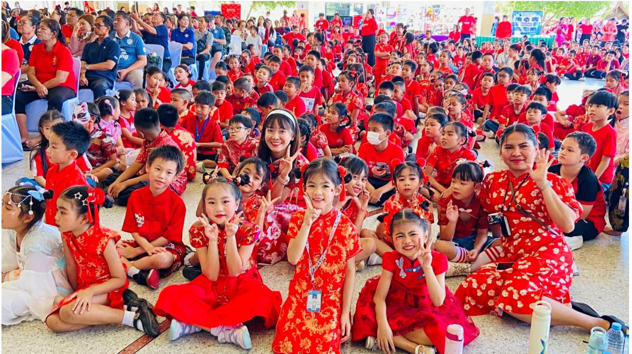
Open House และ งานตรุษจีน ปีการศึกษา 2568