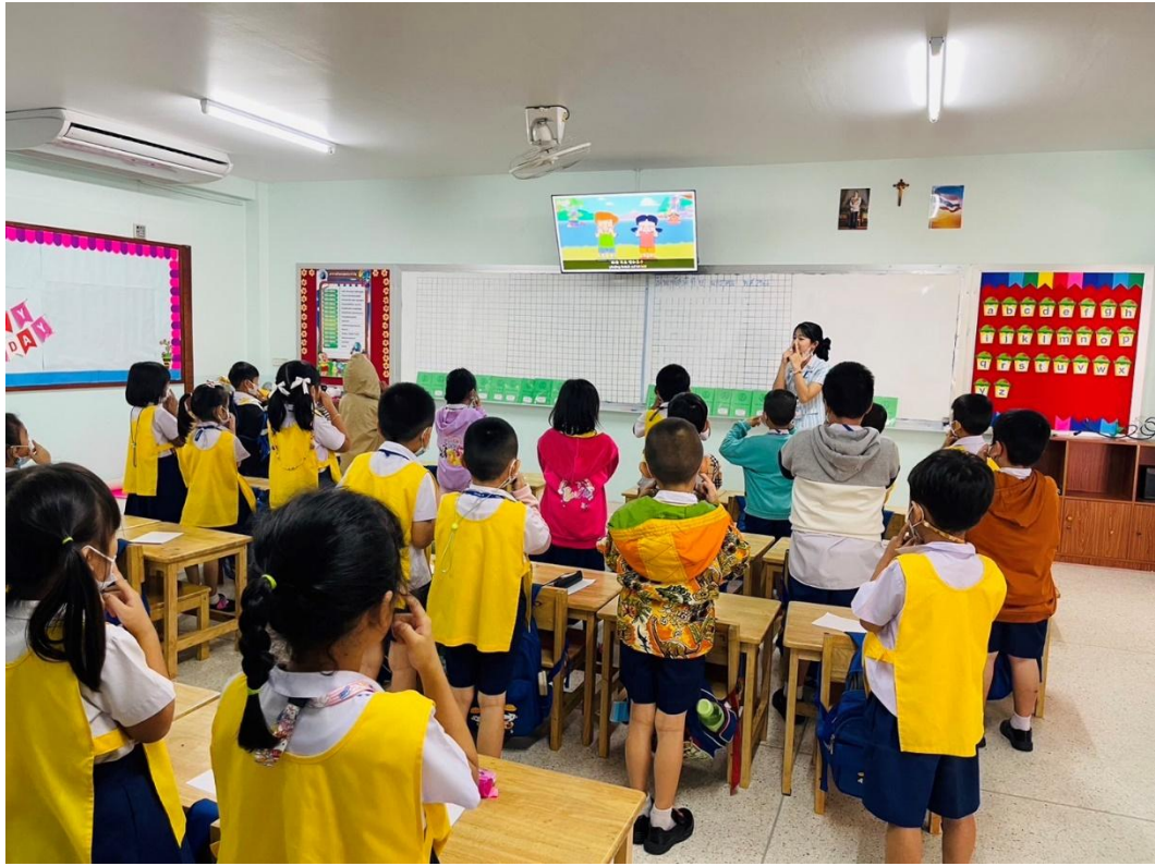
ปฏิบัติหน้าที่ครูผู้สอนในรายวิชาภาษาจีน ระดับชั้นอนุบาล