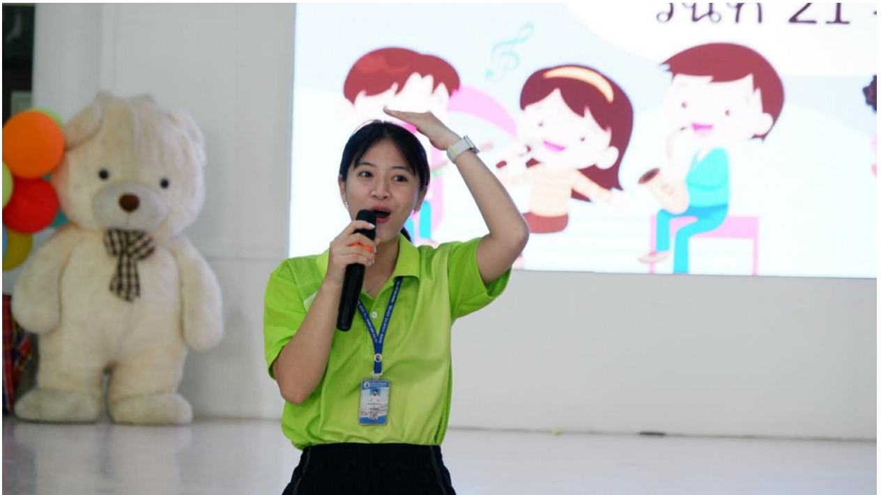
กิจกรรมค่ายวิทย์และศิลปะ ปีการศึกษา 2568