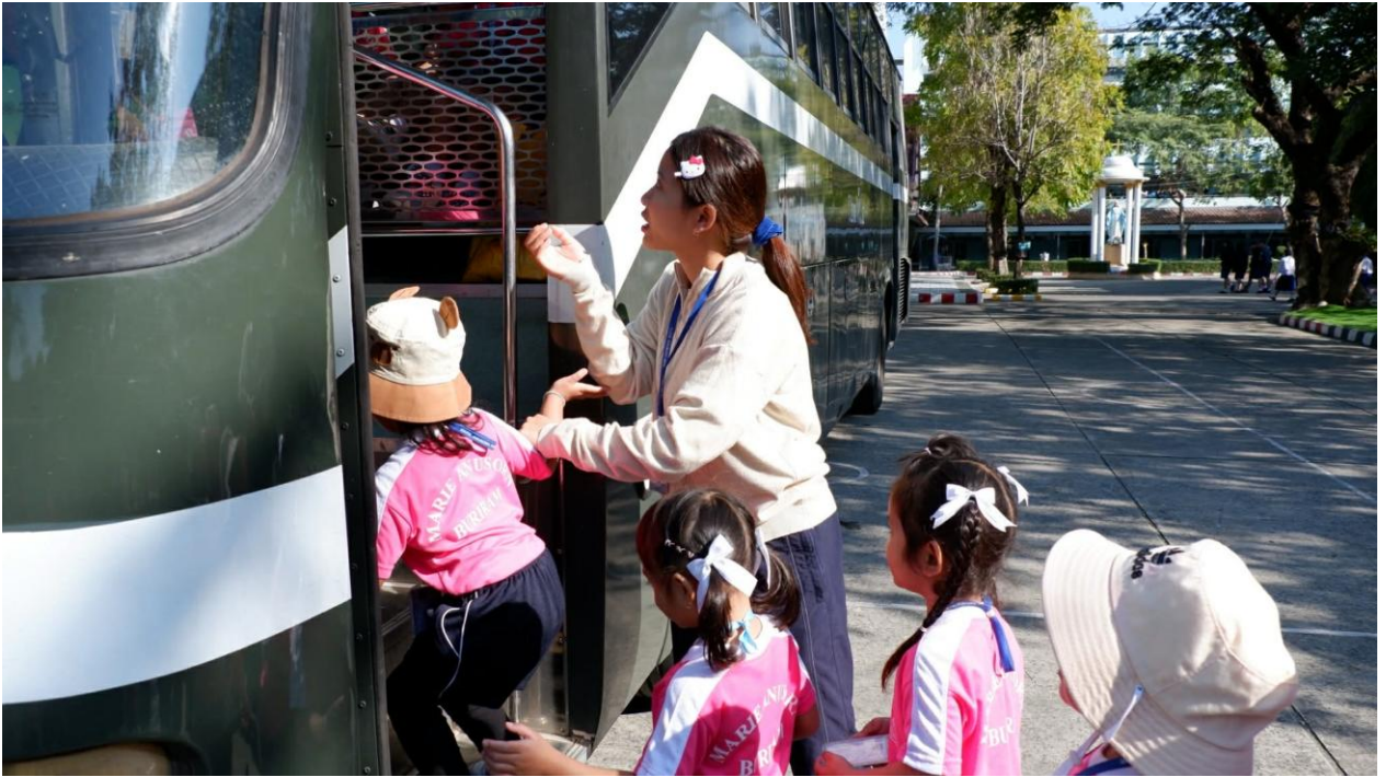
ทัศนศึกษา ประจำปี 2568