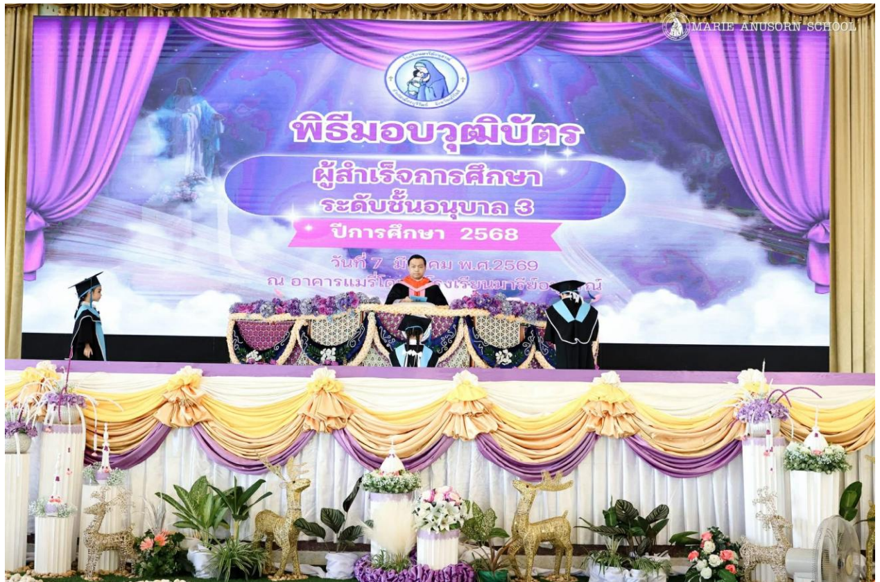
งานยวบัณฑิต ปีการศึกษา 2568