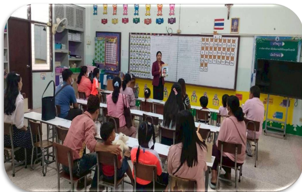
ประชุมผู้ปกครองปีการศึกษา 2568