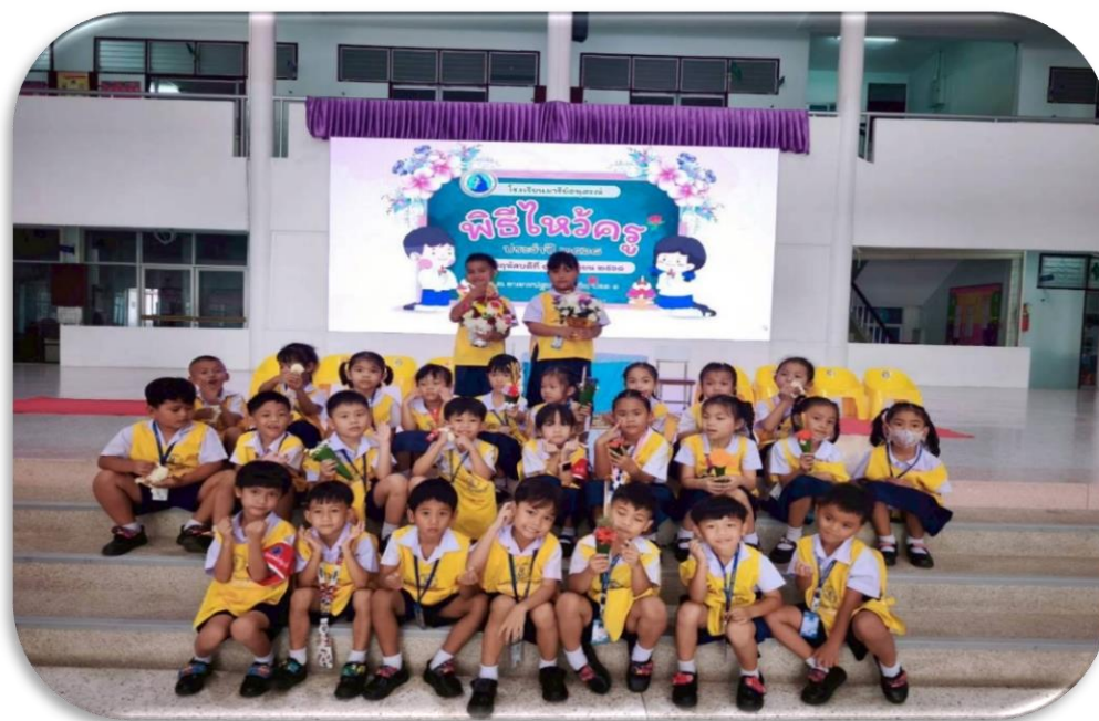
กิจกรรมไหว้ครูปีการศึกษา 2568