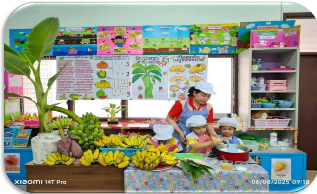
กิจกรรมการเรียนรู้การสอนห้อง อนุบาล 3/6