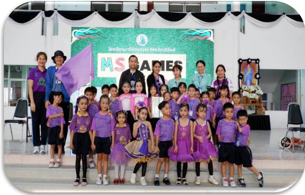
กิจกรรมกีฬาสี่ปีภาคศึกษา 2568