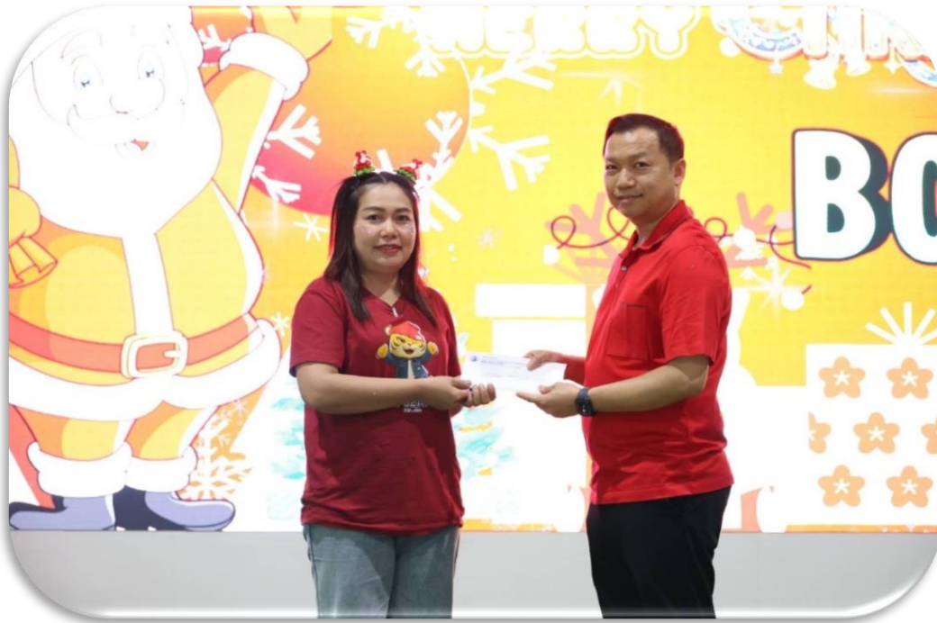
กิจกรรมสวัสดีปีใหม่ ครอบครัวมารีย์อนุสรณ์ปีการศึกษา 2569