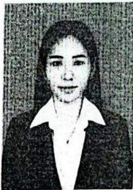
หมายเลขบัตรประชาชน