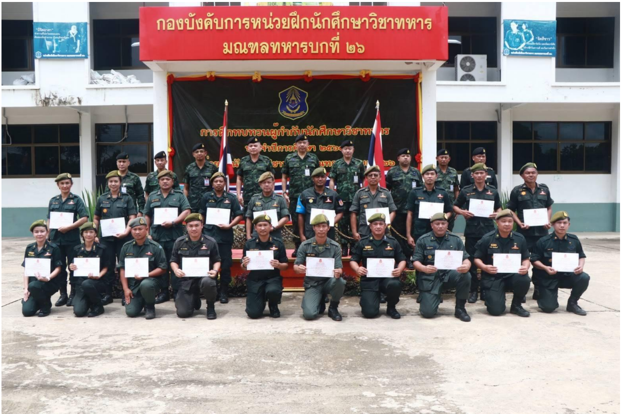
ภาพ อบรมครูฝึกนักศึกษาวิชาทหาร