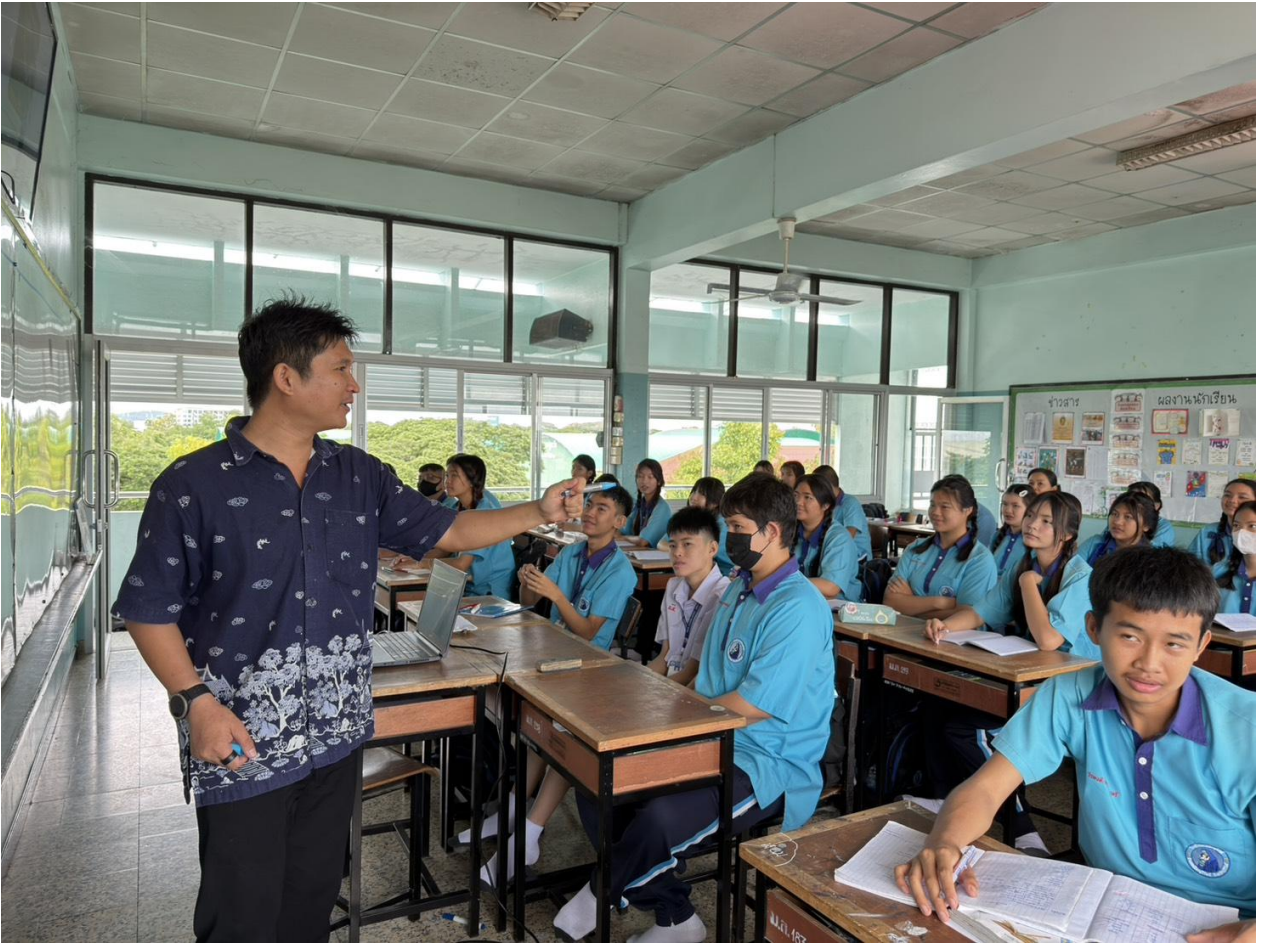
ภาพกิจกรรมนิเทศการสอน