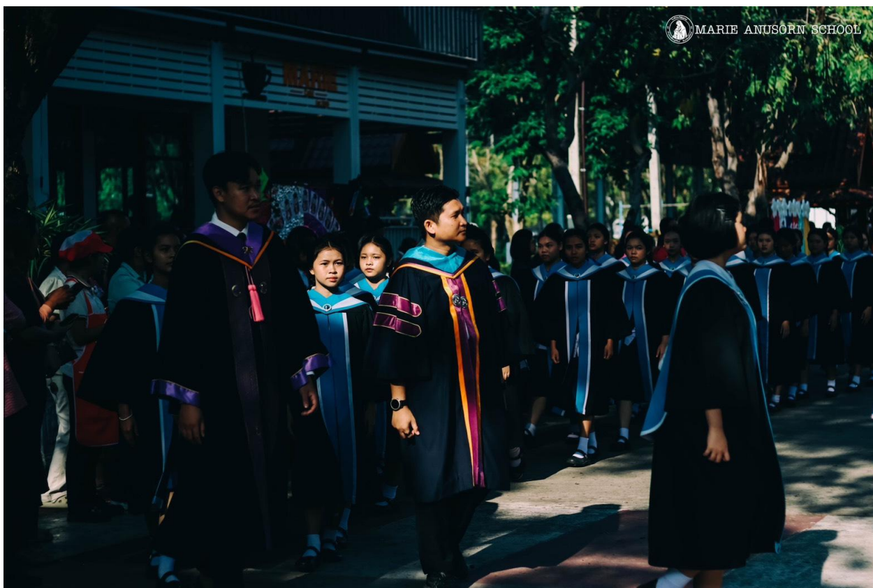
ภาพ ร่วมกิจกรรมรับวุฒิปัตร ม 3