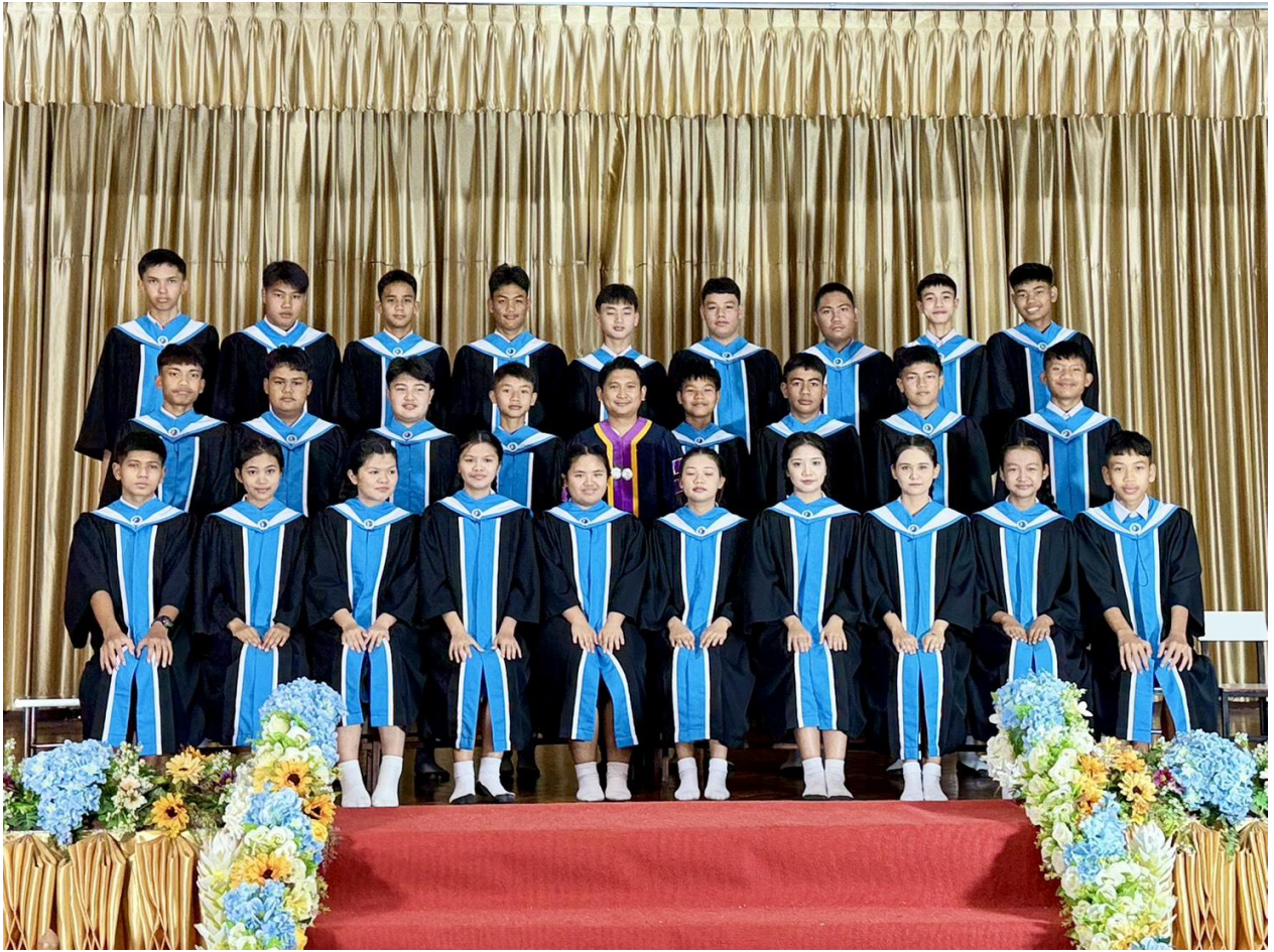
ภาพกิจกรรมปัจฉิมนิเทศ ม 3