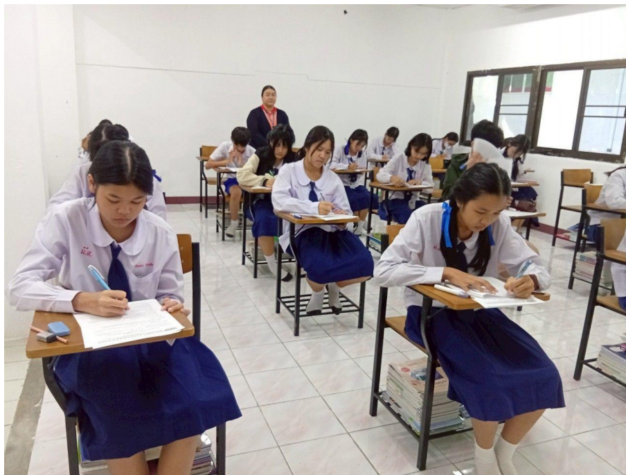
สนับสนุนและส่งเสริมนักเรียนสอบชิงทุนในโครงการต่างๆ