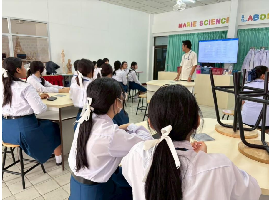
ร่วมกิจกรรมชมรมสถานักเรียน