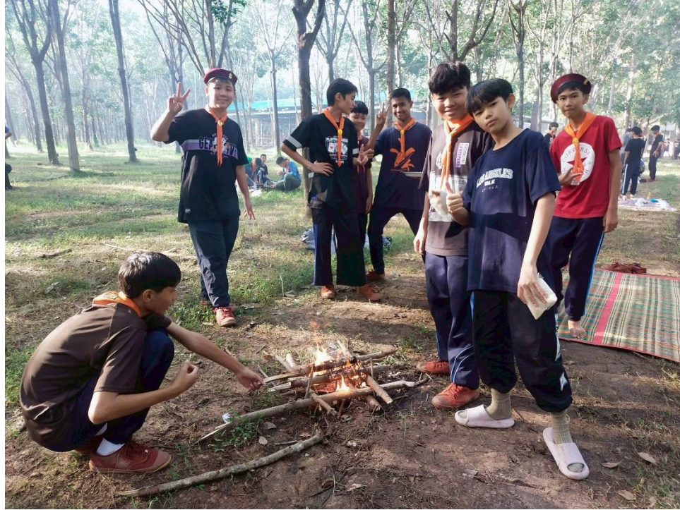
กิจกรรมเข้าค่ายลูกเสือ เนตรนารี ระดับชั้นมัธยมศึกษาปีที่ 1 - 3