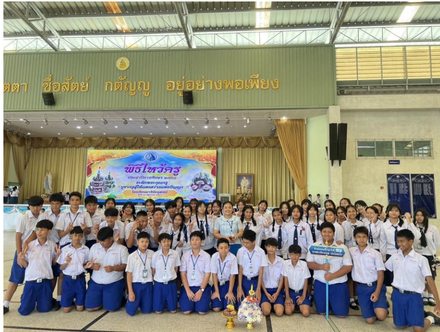
ร่วมกำกับและดูแลนักเรียนกิจกรรมไหว้ครู ประจำปีการศึกษา 2568