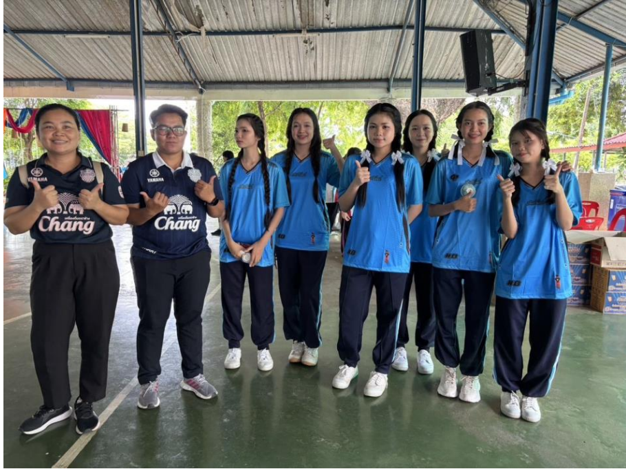
นำนักเรียนเข้าร่วมกิจกรรมเยาวชนสัมพันธ์ ที่โรงเรียนเทเรซา