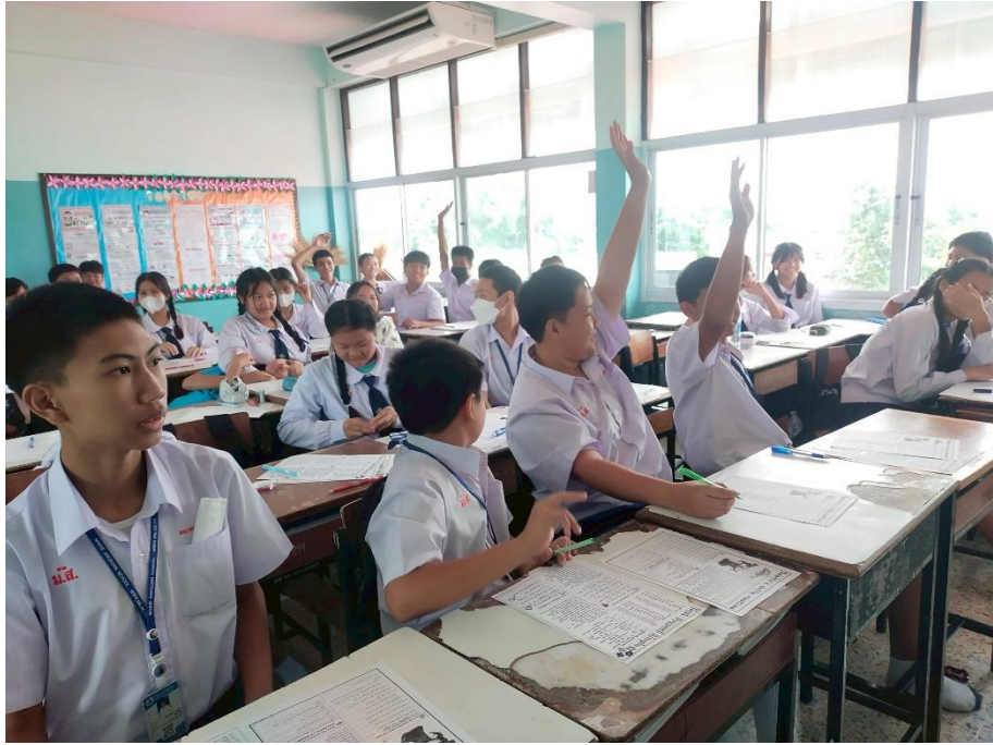
จัดทำโครงการคุณธรรมห้องเรียน