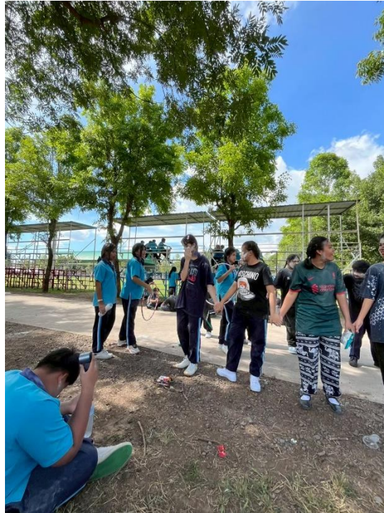
ร่วมกิจกรรมรับน้อง ม.1