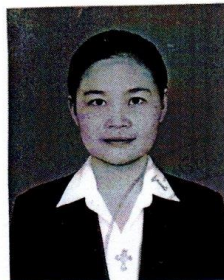
หมายเลขบัตรประชาชน

ให้ไว้ ณ วันที่..... ๑ ..... เดือน..... พฤษภาคม ..... พ.ศ. ๒๕๖๒..