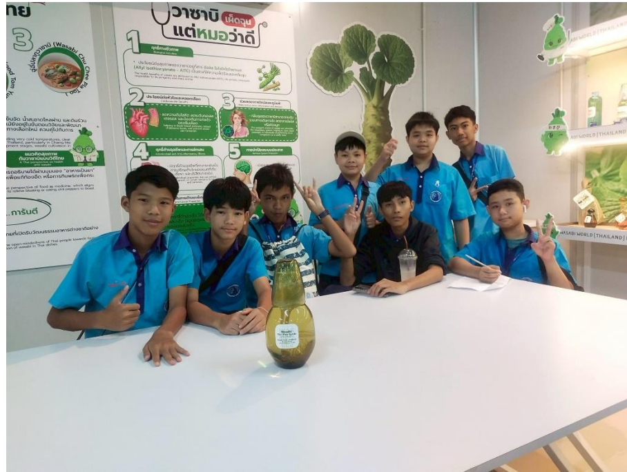
นำนักเรียนไปทัศนศึกษานอกสถานที่ ที่ อุทยานการเรียนรู้เฟลาเฟลิน