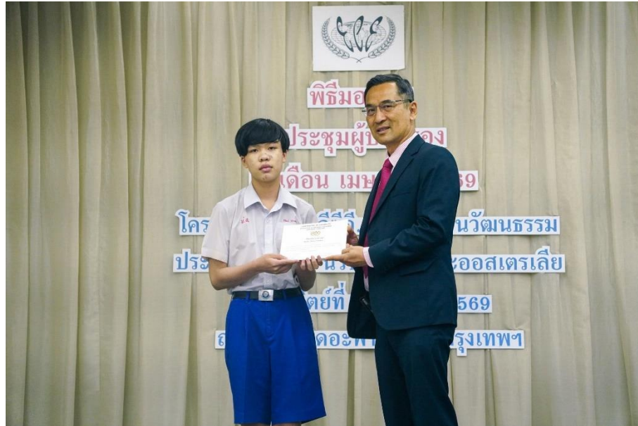
สนับสนุนและส่งเสริมนักเรียนสอบชิงทุนในโครงการต่างๆ