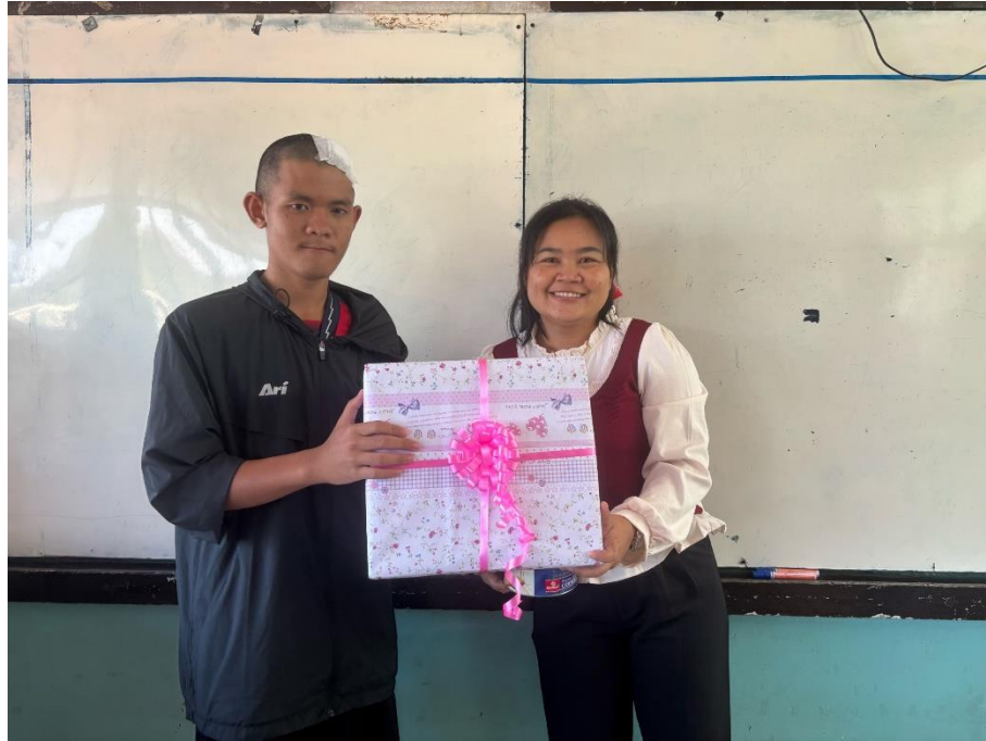
กิจกรรมคริสต์มาส แลกของขวัญภายในห้องเรียน