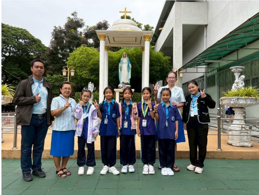
นำนักเรียนเข้าร่วมการอบรมโครงการค่ายผู้นำเยาวชน ที่ ไร่วนานุรักษ์ อำเภอวังน้ำเขียว จังหวัดนครราชสีมา เป็นเวลา 3 วัน 2 คืน