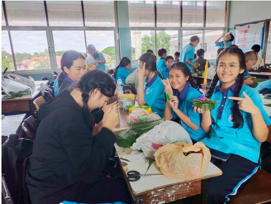
ร่วมกิจกรรมวันลอยกระทง ดูแลและควบคุมนักเรียนประดิษฐ์กระทง