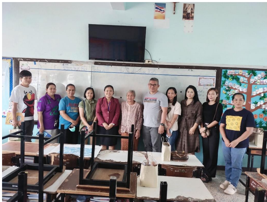
กิจกรรมคัดเลือกเครือข่ายผู้ปกครองนักเรียน ประจำปีการศึกษา 2568