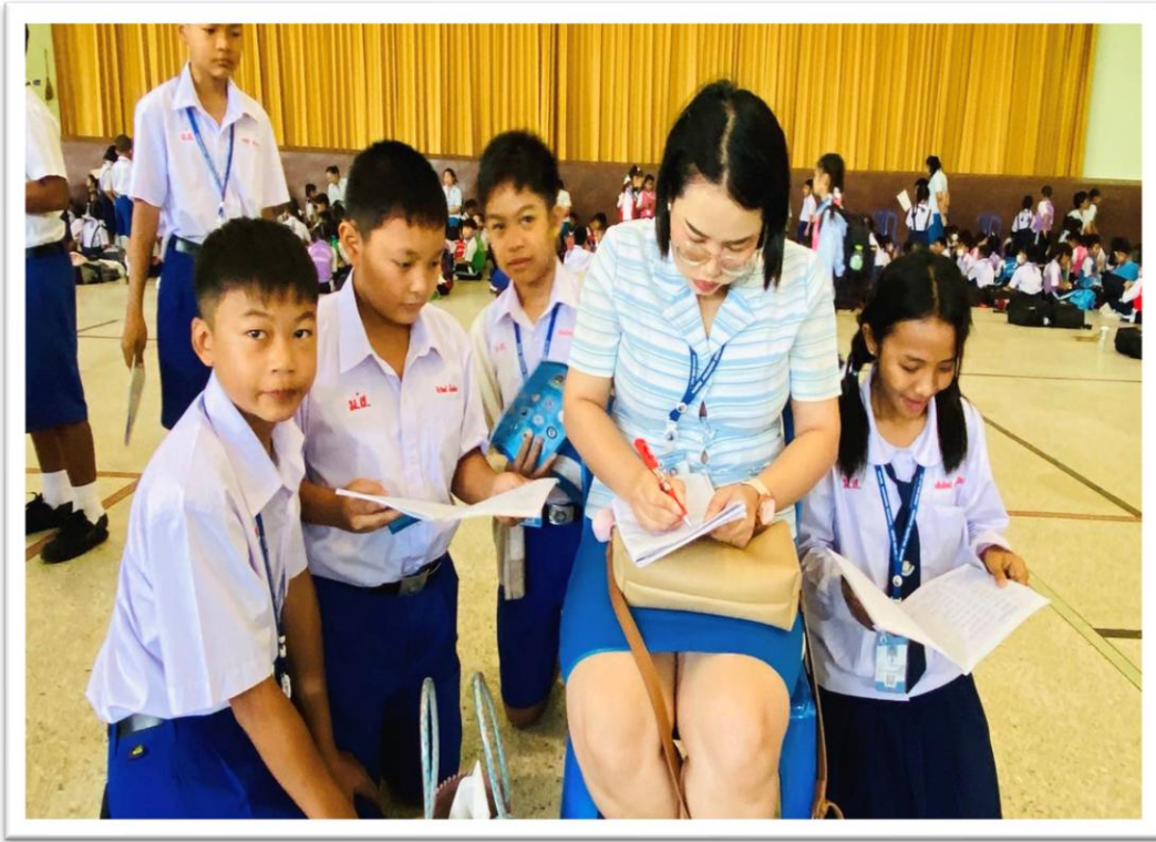
ร่วมกิจกรรมรักการอ่านในตอนเช้า