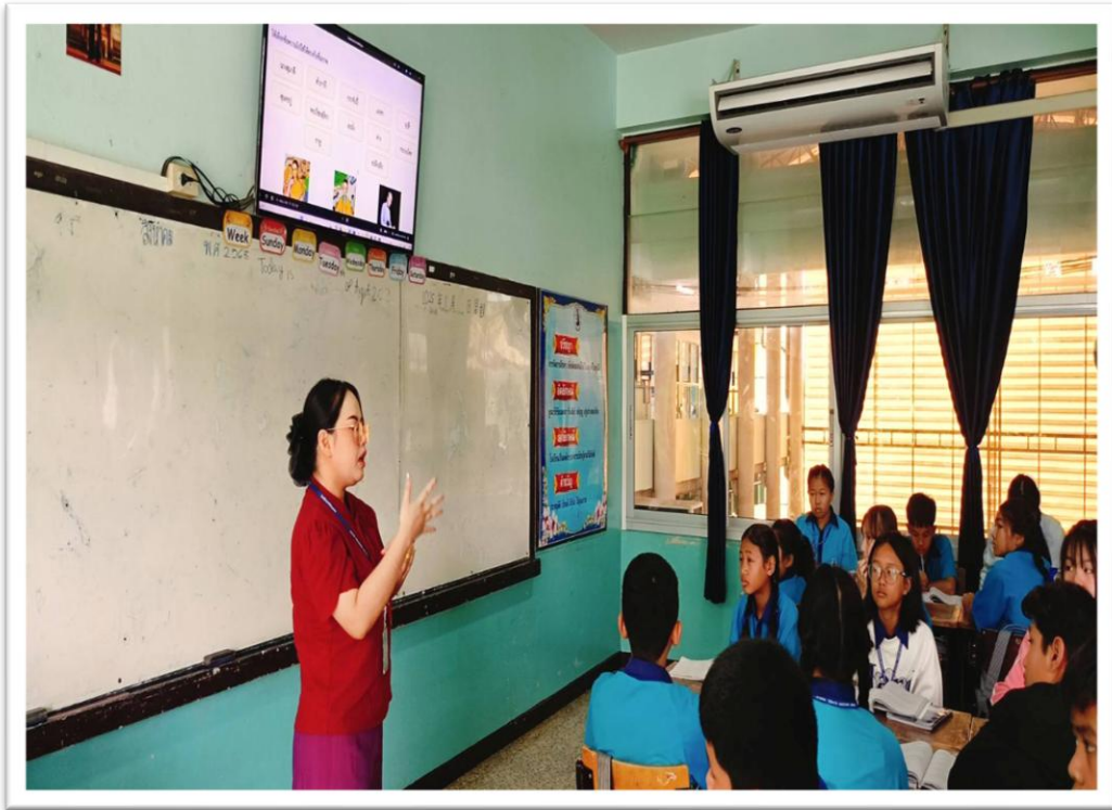
จัดการเรียนการสอนตามแผนการสอน