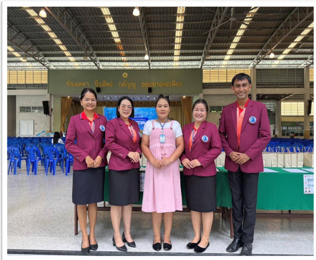
ร่วมกิจกรรมประชุมผู้ปกครอง