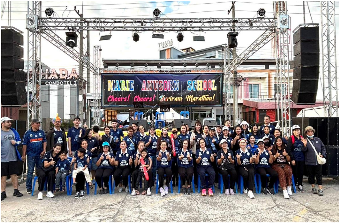
ร่วมกิจกรรมเชียร์มาราธอนประจำปี