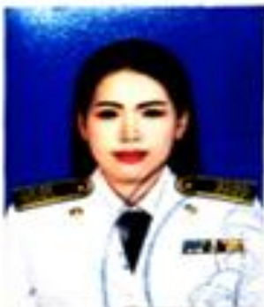
นายเอกนัครประชาชน

ให้ไว้ ณ วันที่ ..... เดือน พฤษภาคม พ.ศ. ๒๕๖๒