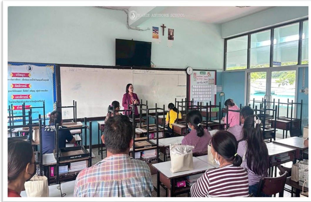
ร่วมกิจกรรมประชุมผู้ปกครอง