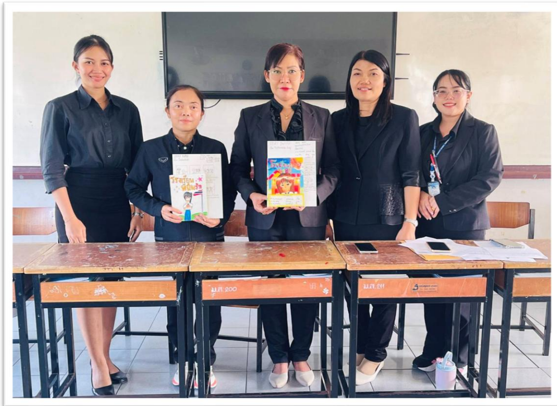
เป็นกรรมการตัดสินการแข่งขันหนังสือเล่มเล็กระดับประถมศึกษาปีที่ 4-6