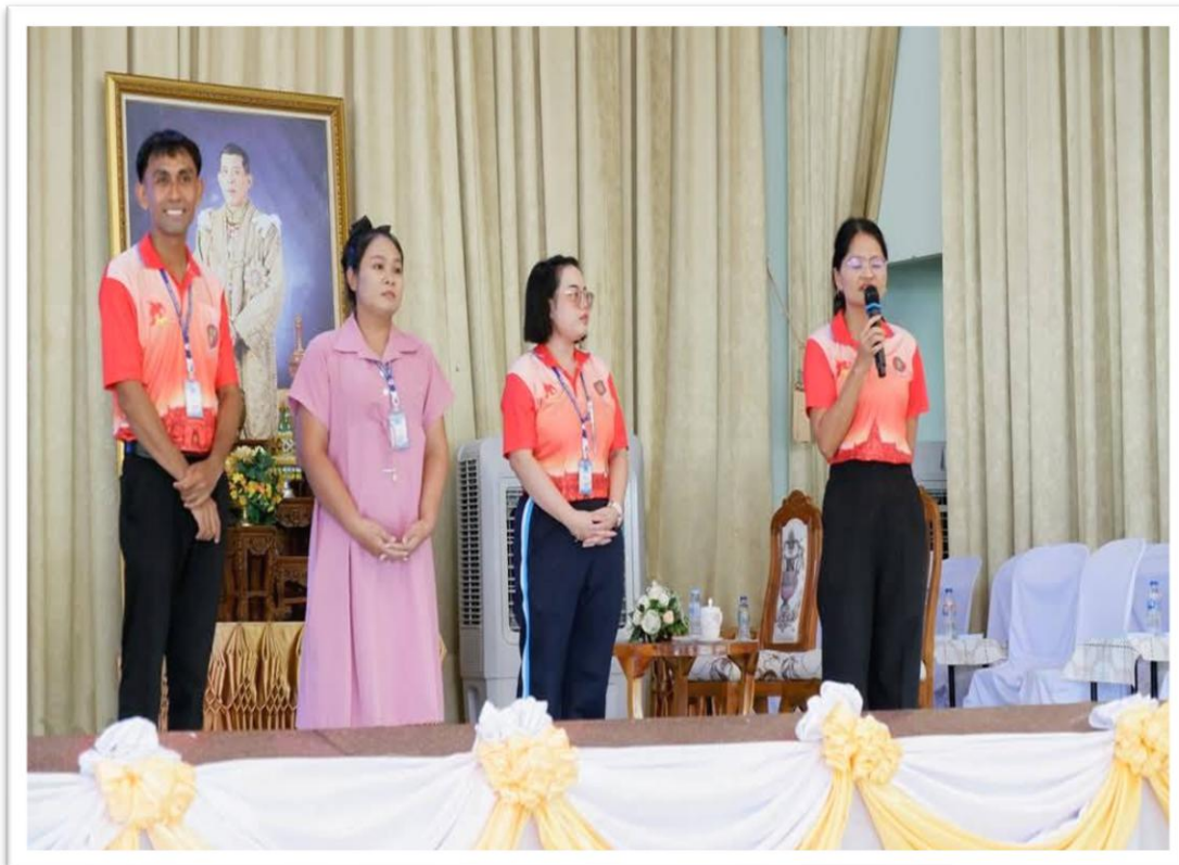
ร่วมกิจกรรมรับน้องนักเรียนใหม่