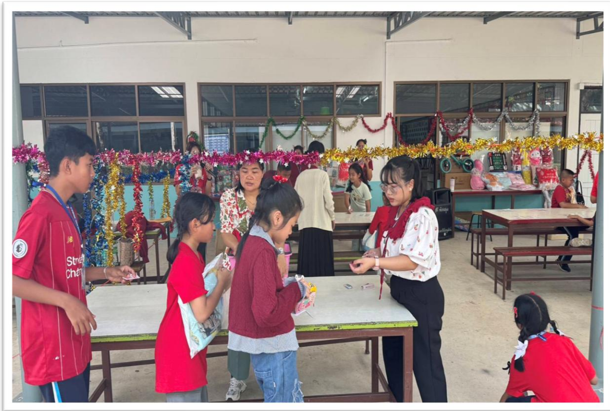
ร่วมกิจกรรมวันคริสต์มาต์ของโรงเรียน