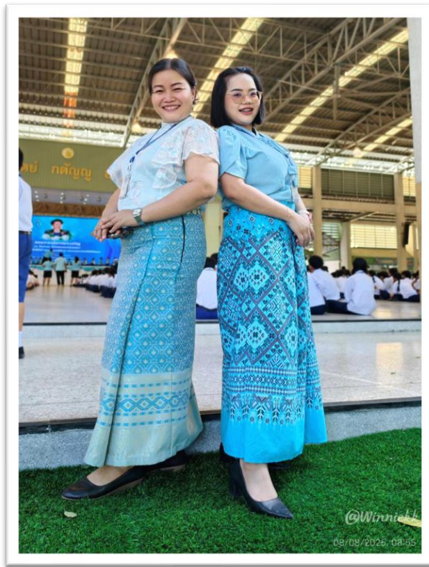
ร่วมกิจกรรมวันแม่แห่งชาติ