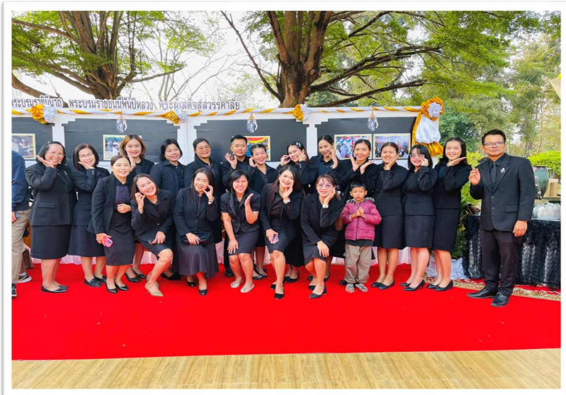
ร่วมกิจกรรม ณ หอประชุมวิชาอุตสาหกรรม มหาวิทยาลัยราชภัฏบุรีรัมย์