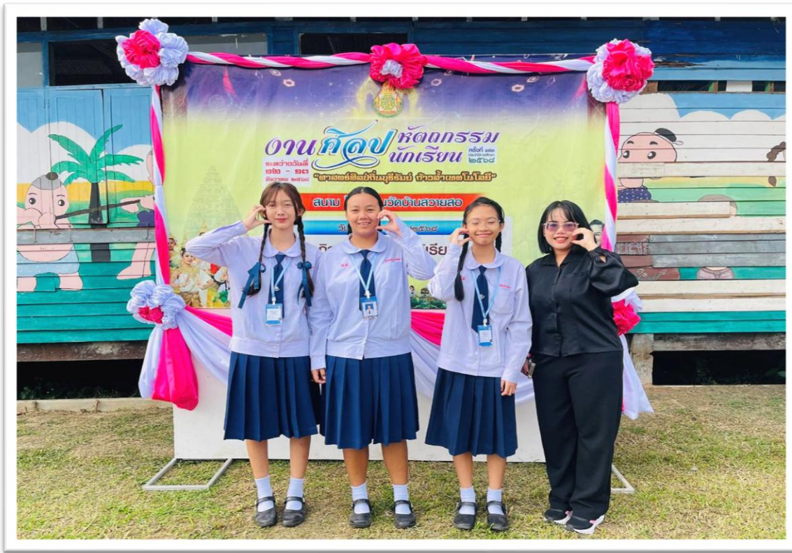
เป็นผู้ฝึกซ้อมและนำนักเรียนเข้าแข่งขันหนังสือเล่มเล็กระดับ สพป.และ สพม.