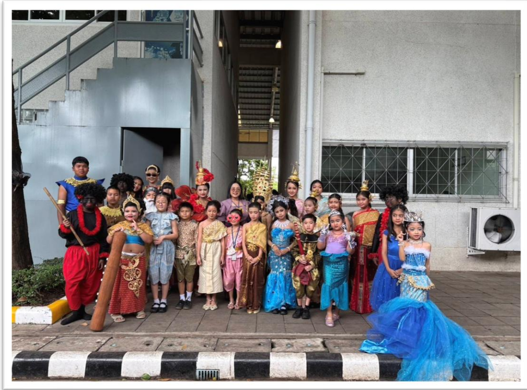
ร่วมกิจกรรมวันสุนทรภู่และวันภาษาไทย