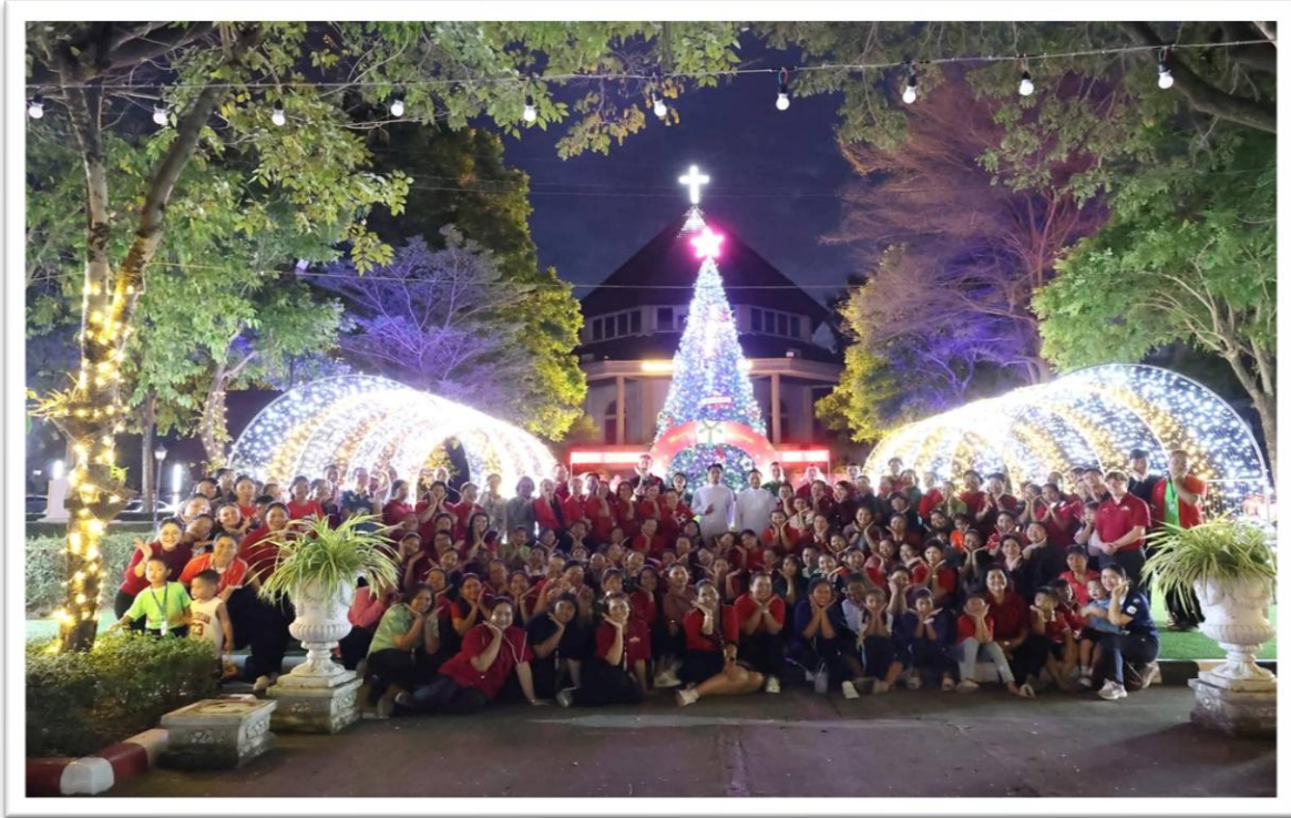
ร่วมกิจกรรมวันคริสต์มาต์ของโรงเรียน