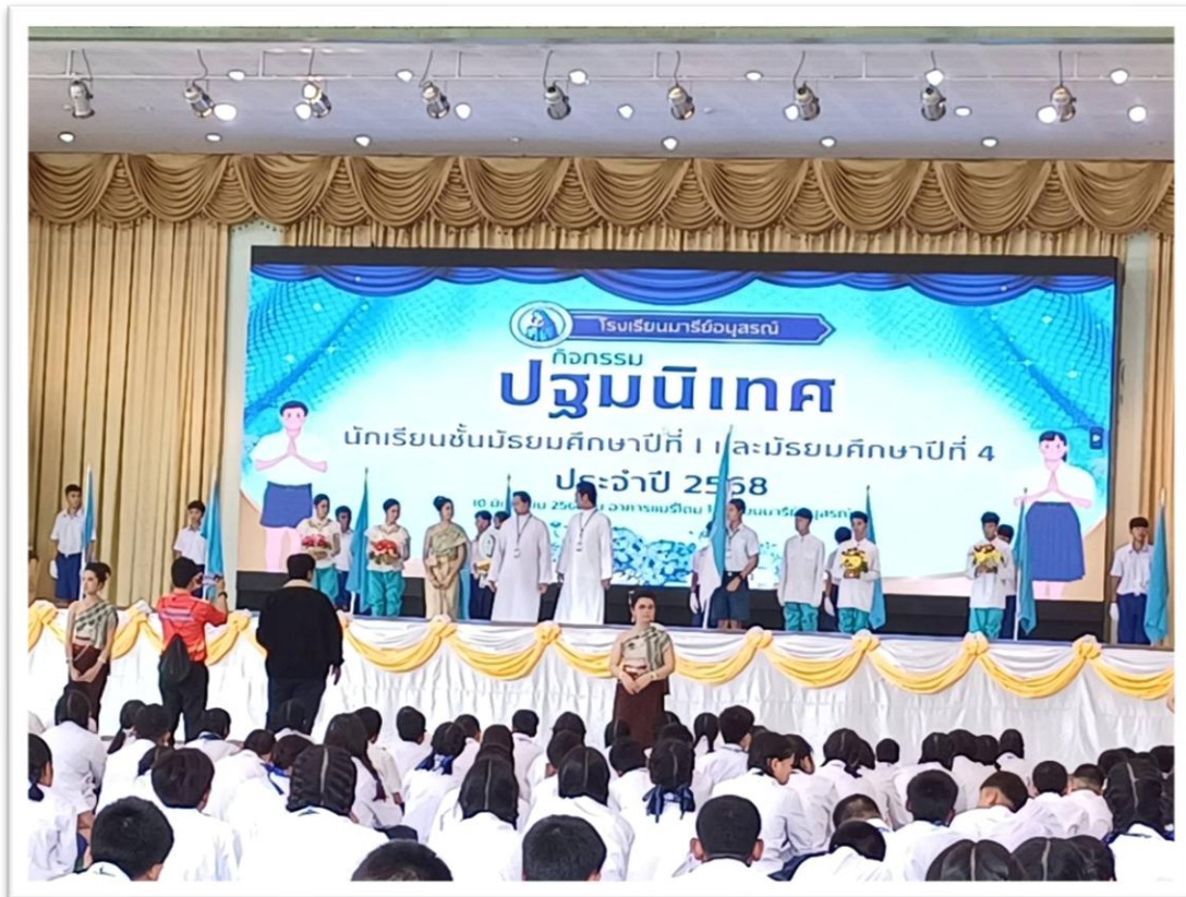
ร่วมกิจกรรมปฐมนิเทศนักเรียนใหม่