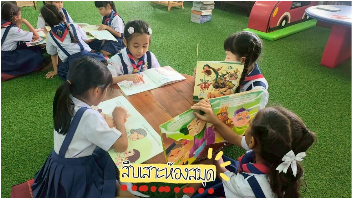
เข้าร่วมการอบรม และกิจกรรมต่างๆ