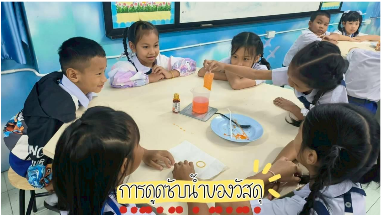
การดูดซับน้ำของวัสดุ