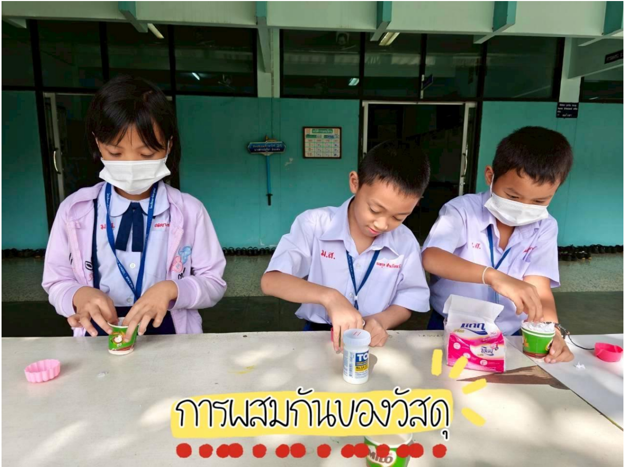
การผสมกันของวัสดุ