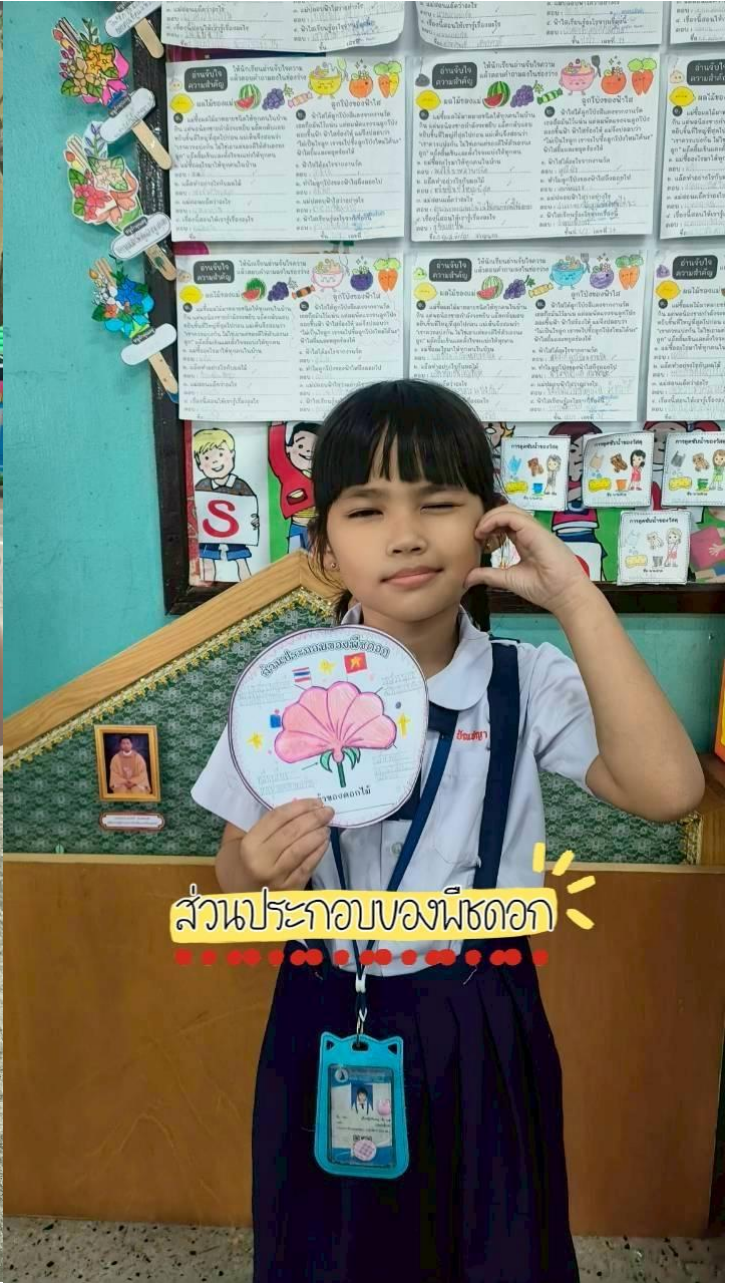
ส่วนประกอบของพืชดอก