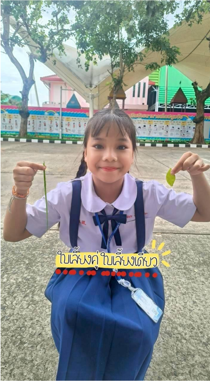
ใบเลี้ยงคู่ ใบเลี้ยงเดี่ยว