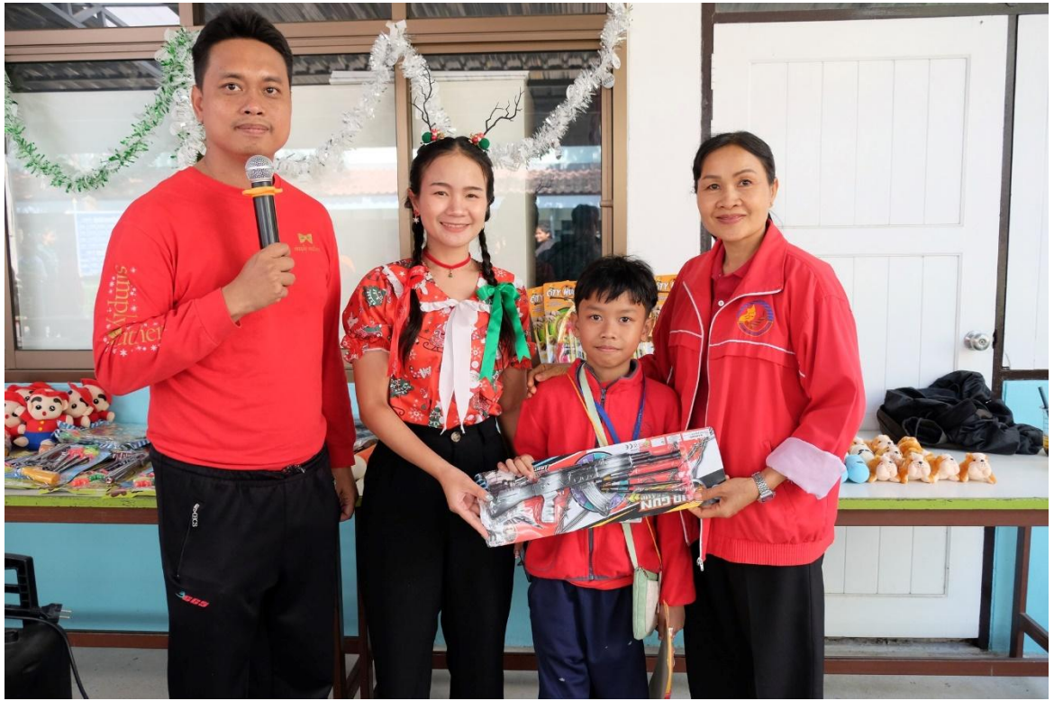
เข้าร่วมกิจกรรม คริสมาสมาเรีย