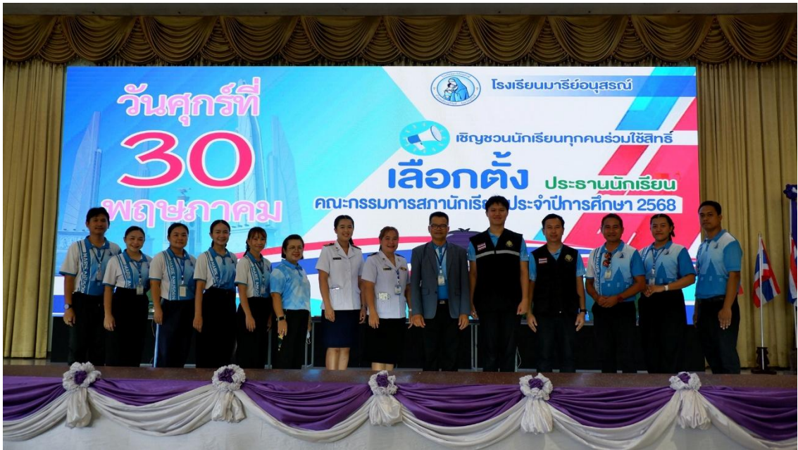
เข้าร่วมกิจกรรม การเลือกตั้ง สภานักเรียน