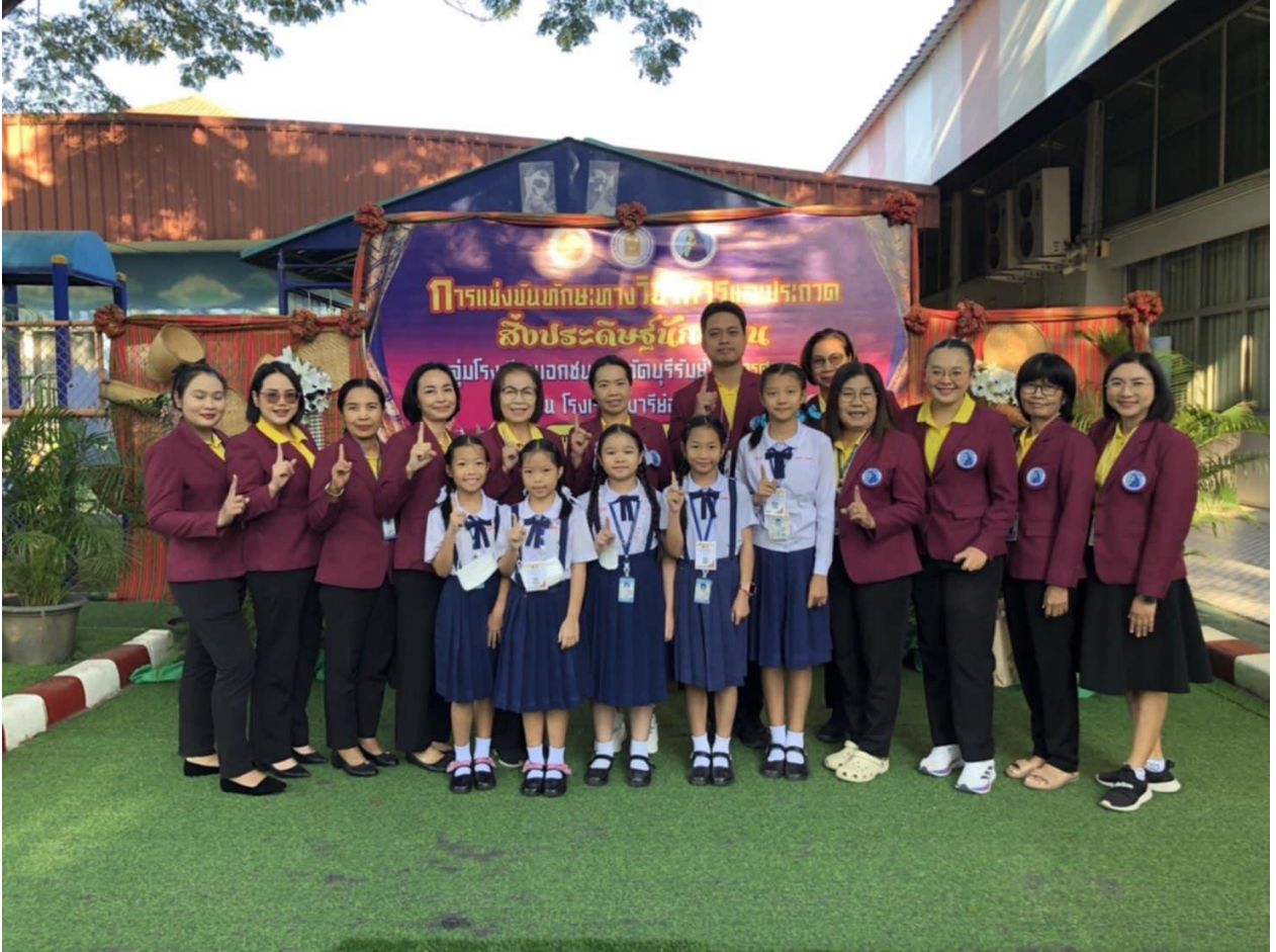
ส่งนักเรียนเข้าร่วมแข่งขัน งานศิลปหัตถกรรมและเป็นประธานตัดสินการแข่งขัน