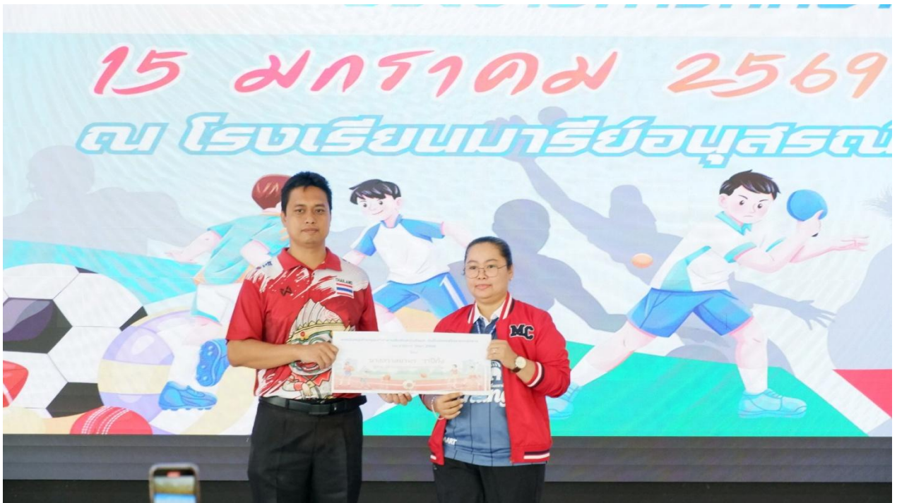
รับหน้าที่ กรรมการงานกีฬาโรงเรียน