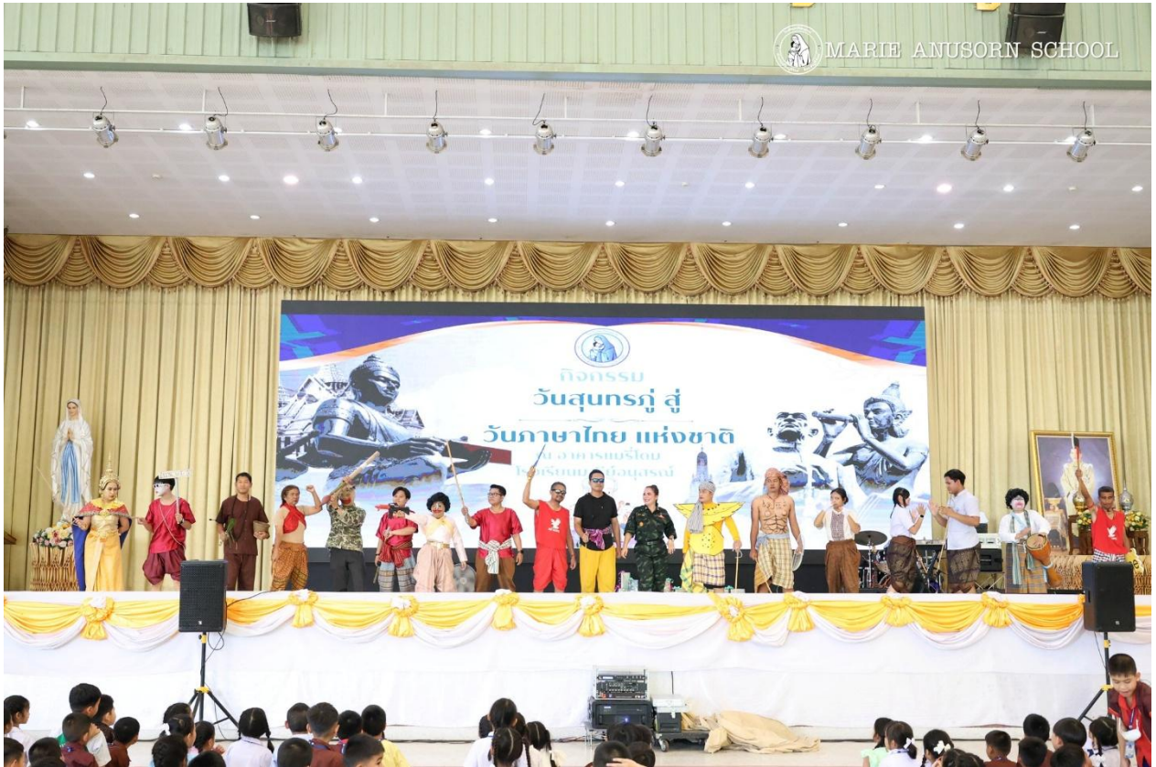
ร่วมกิจกรรม วันภาษาไทยและวันสุนทรภู่