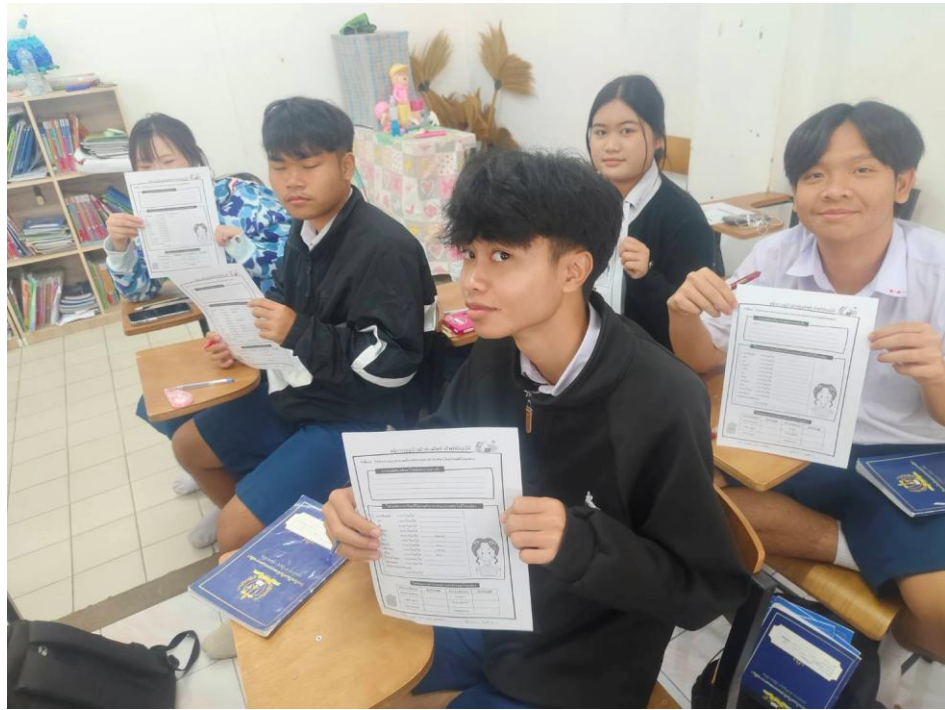
นักเรียน ม.5 ปฏิบัติกิจกรรมการเรียนการสอน