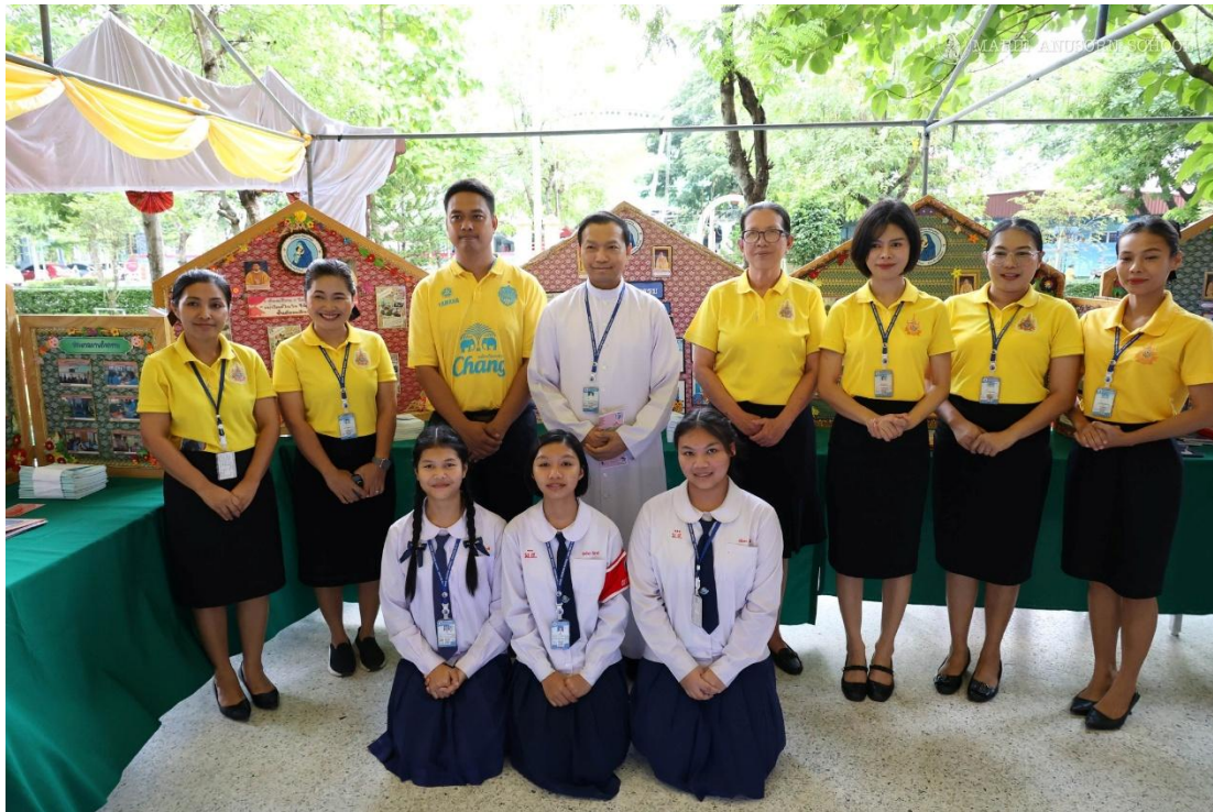
เข้าร่วมกิจกรรมตลาดนัดคุณธรรมและเปิดบ้านวิชาการ