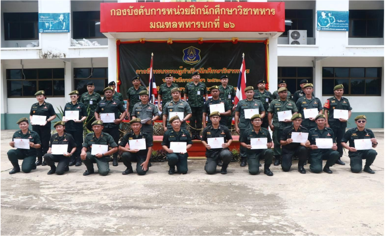
เข้าร่วมกิจกรรมนักศึกษาวิชาทหาร