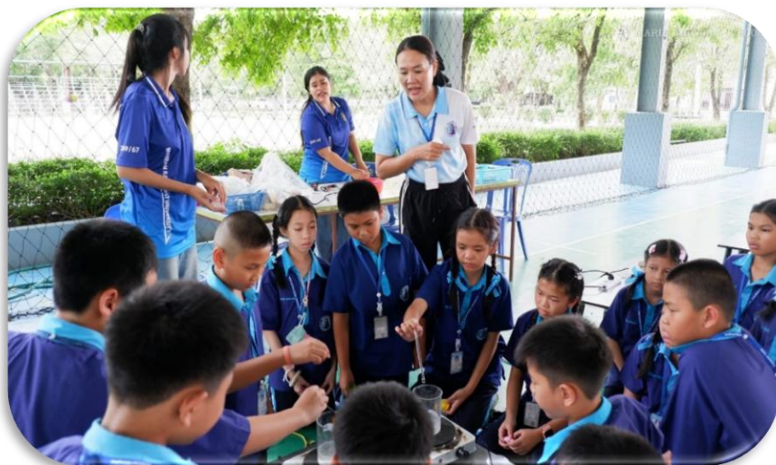
เป็นวิทยากรและอนุเคราะห์จัดการทดลองวิทยาศาสตร์ ค่ายวิทยาศาสตร์ ห้องเรียนพิเศษ วิทยาศาสตร์ คณิตศาสตร์ (GIFTED)