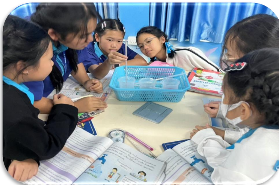
สอนกิจกรรมการทดลอง เรื่อง การเปลี่ยนแปลงสถานะของสาร