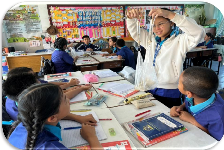
สอนกิจกรรมการทดลอง เรื่อง การหาแรงลัพธ์