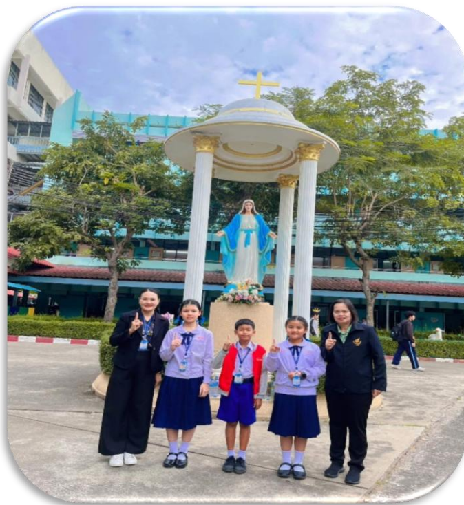
เป็นครูผู้ฝึกซ้อม การแข่งขันโครงการวิทยาศาสตร์ ประเภทสิ่งประดิษฐ์ ระดับชั้น ป.4-ป.6