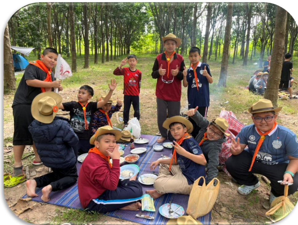
สอนกิจกรรมลูกเสือเนตรนารีในหัวข้อสุททกรรม