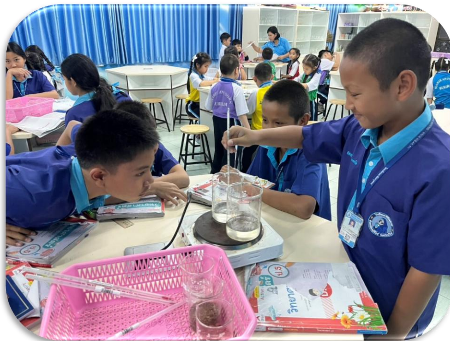
สอนกิจกรรมการทดลอง เรื่อง การเปลี่ยนแปลงทางเคมี