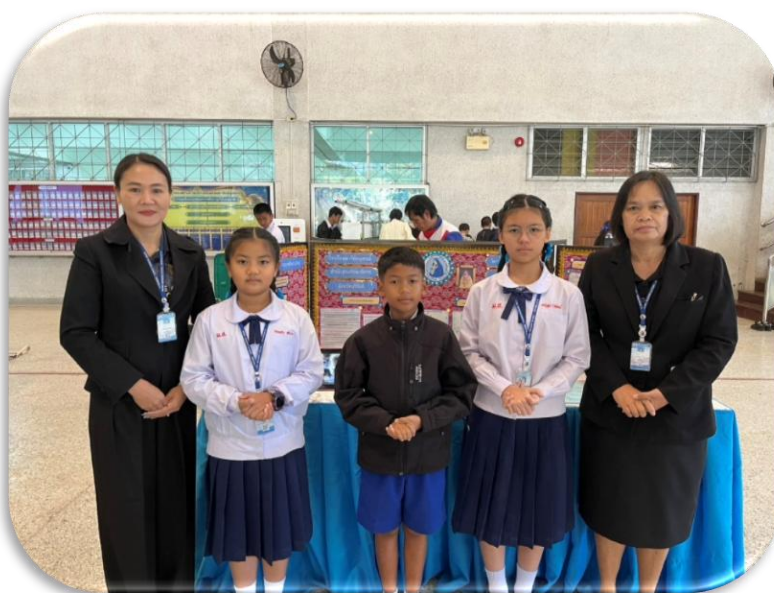
เป็นครูผู้ฝึกซ้อม การแข่งขันโครงการวิทยาศาสตร์ ประเภทสิ่งประดิษฐ์ ระดับชั้น ป.4-ป.6