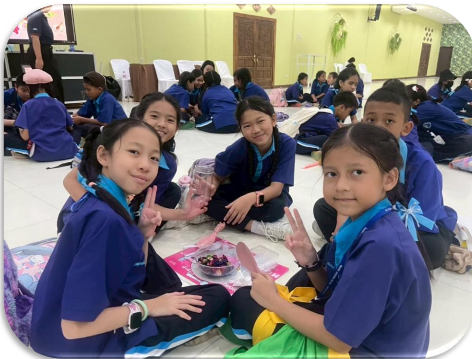
ร่วมกิจกรรมทัศนศึกษานักเรียน ป.5/7 ณ เพลาเพลลิน อ.คูเมือง จ.บุรีรัมย์