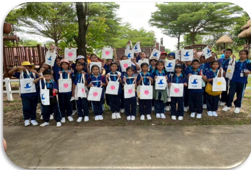
ร่วมกิจกรรมทัศนศึกษานักเรียน ป.5/7 ณ เพลาเพลิน อ.คูเมือง จ.บุรีรัมย์