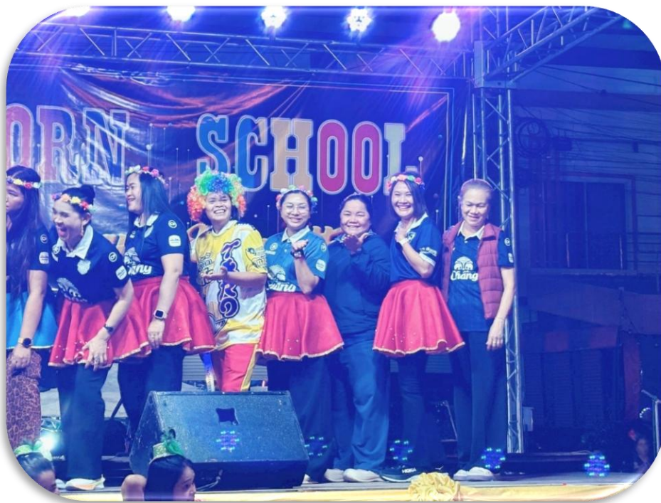
ร่วมกิจกรรมเชียร์มาราธอนปี 2025