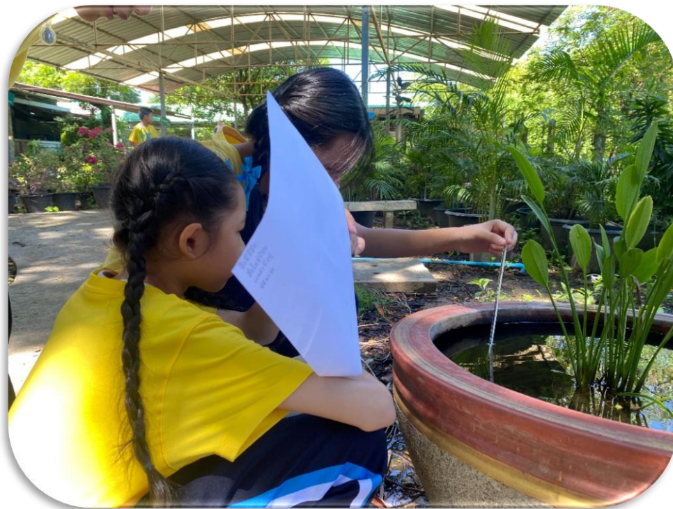
สอนกิจกรรมการสำรวจ เรื่อง ความสัมพันธ์ของสิ่งมีชีวิตในระบบนิเวศ