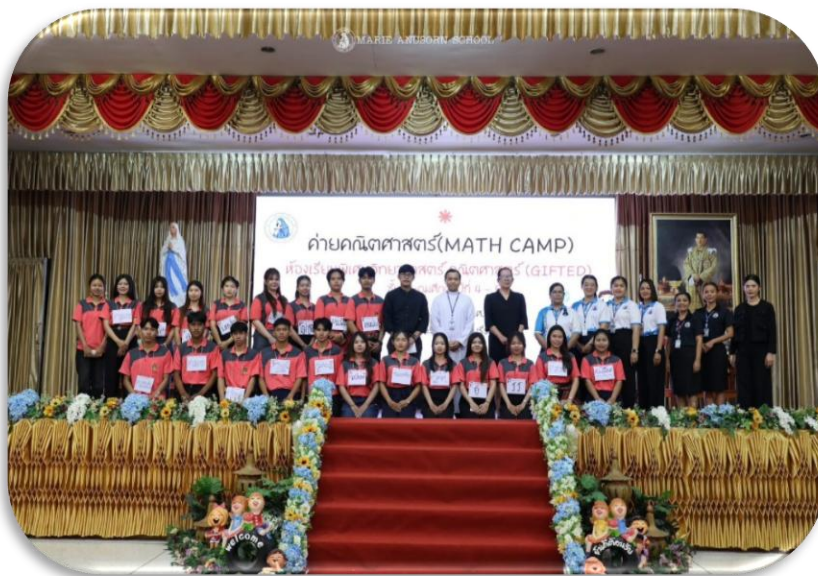
กิจกรรม Math Camp ในโครงการห้องเรียนพิเศษคณิตศาสตร์-วิทยาศาสตร์ (Gifted) ณ ห้องประชุมวันทามารี๋ย โรงเรียนมารีย์อนุสรณ์ จ.บุรีรัมย์