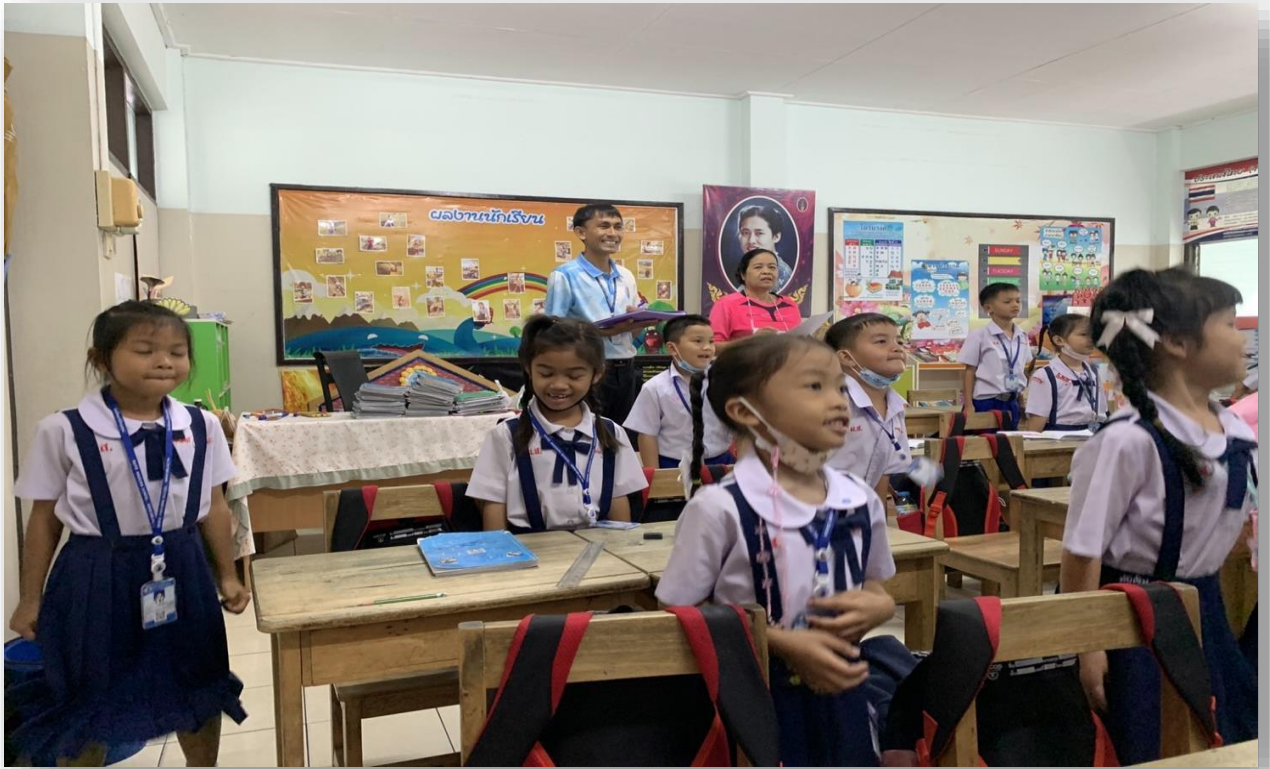
นิเทศการสอนของครู