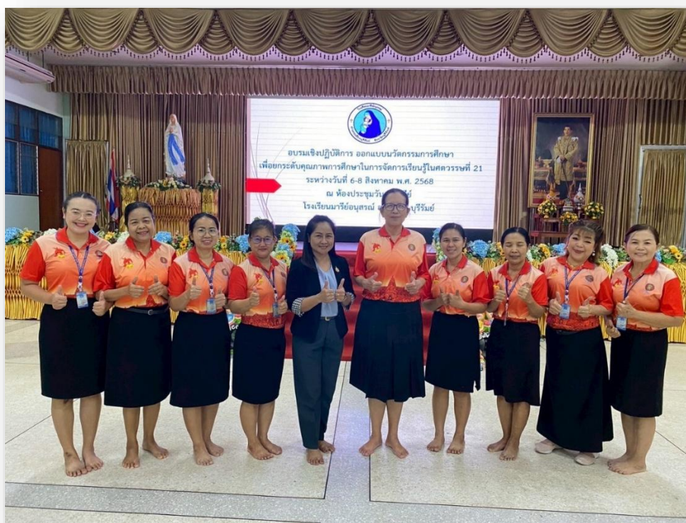
อบรมเชิงปฏิบัติการ ออกแบบนวัตกรรมการศึกษาเพื่อยกระดับคุณภาพการศึกษาในการจัดการเรียนรู้ ในศตวรรษที่ 21