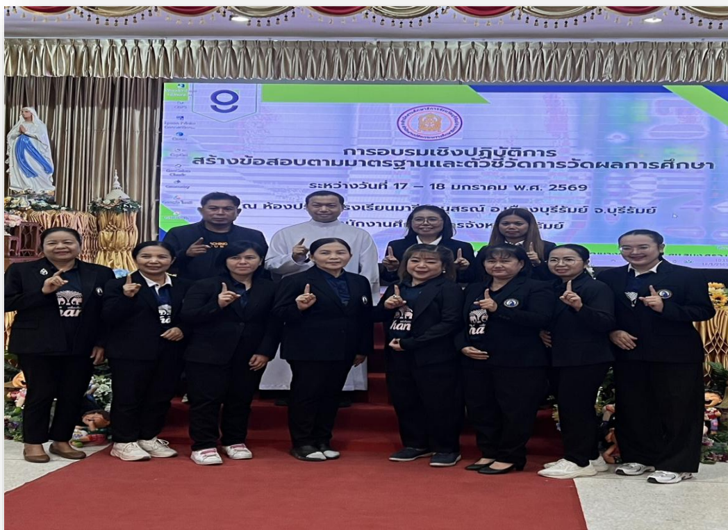
อบรมเชิงปฏิบัติการ สร้างข้อสอบตามมาตรฐานและตัวชี้วัดการวัดผลการศึกษา