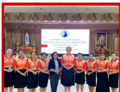
วันที่ 7 สิงหาคม 2568