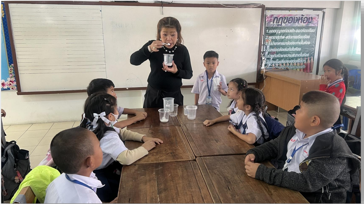
กิจกรรมการเรียนรู้การสอน