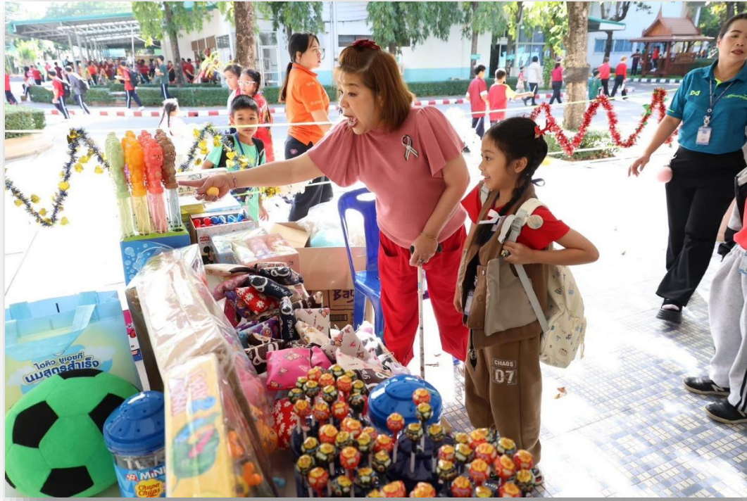
ร่วมกิจกรรมวันคริสต์มาสของโรงเรียนมารีย์อนุสรณ์