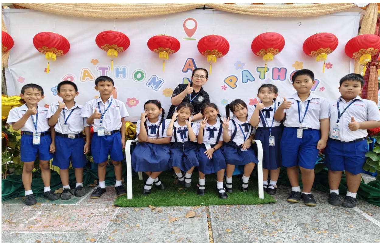
กิจกรรมเปิดบ้าน