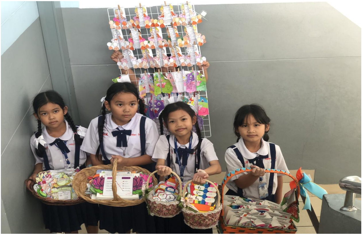
ผลงานของเด็กๆ