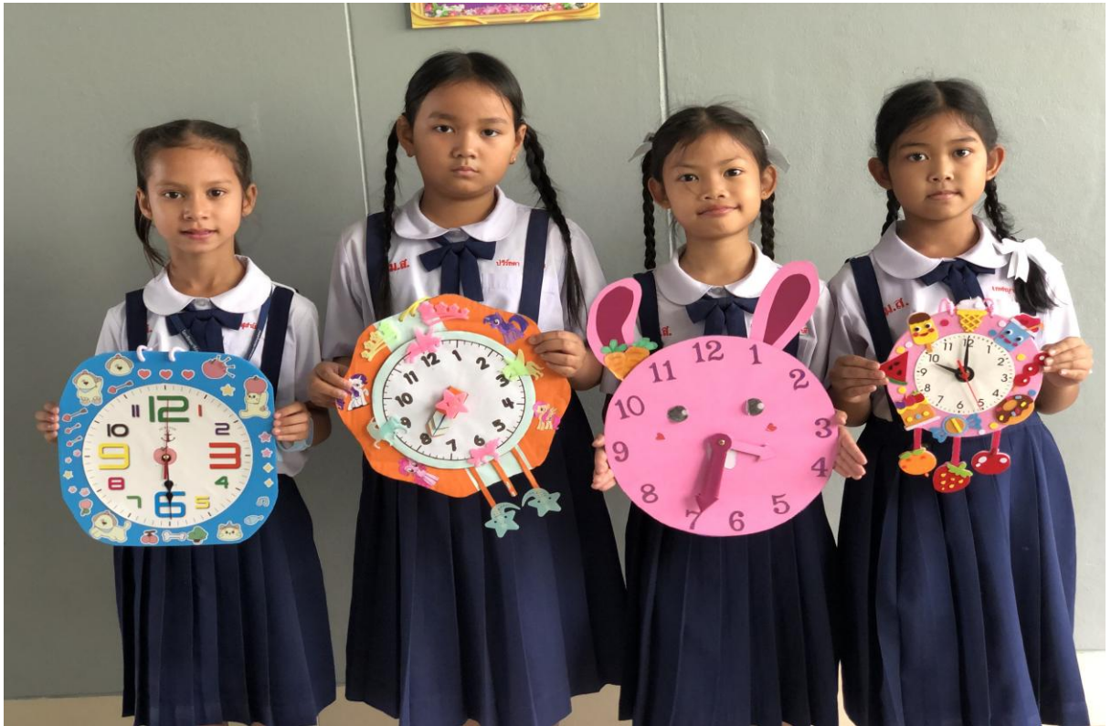
ผลงานของนักเรียน