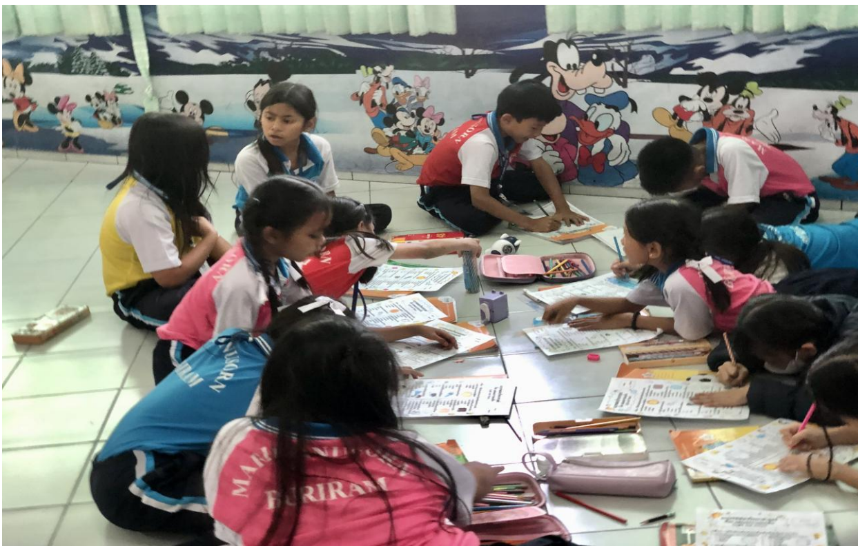
กิจกรรมบ้านวิทย์น้อย