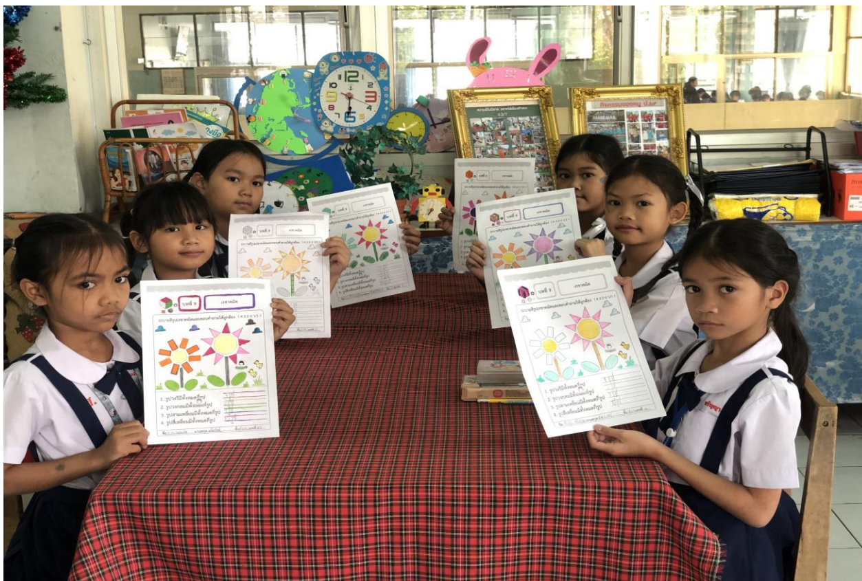
กิจกรรมบ้านวิทย์น้อย