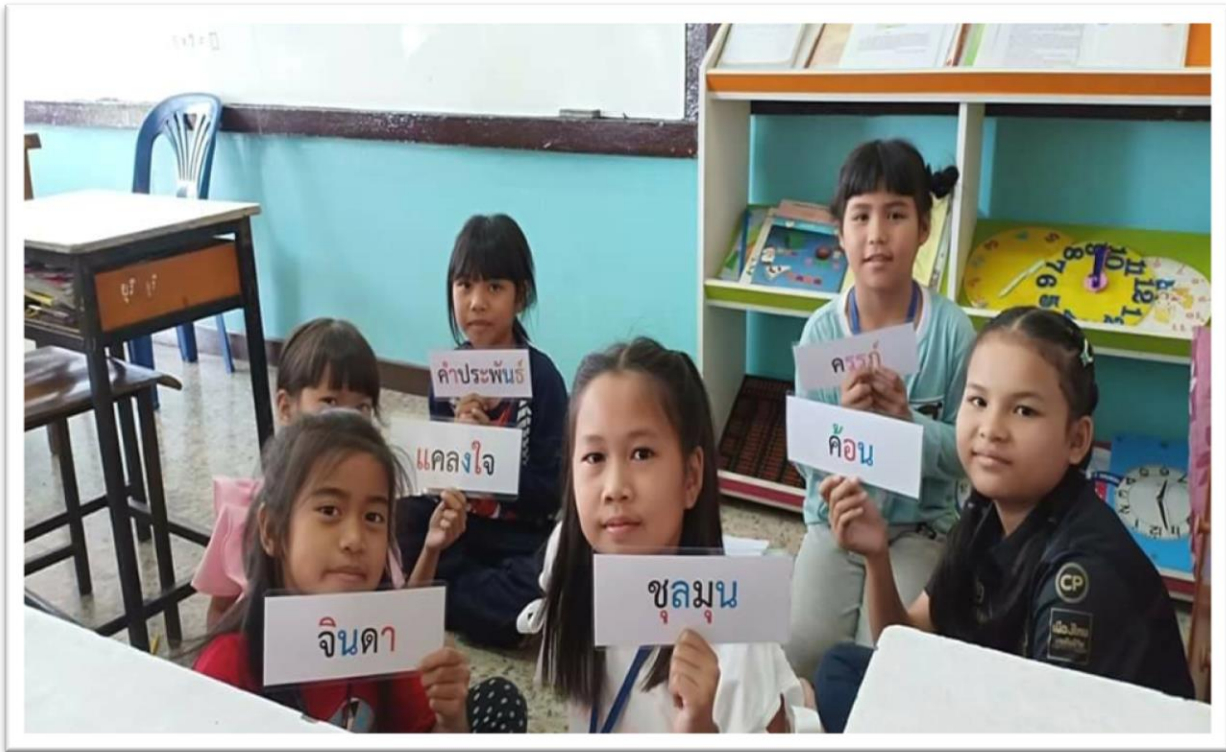
คำพื้นฐานสำหรับฝึกอ่านนักเรียนชั้นประถมศึกษาปีที่ 3 นักเรียนใช้เวลาอ่านมาฝึกอ่านคำพื้นฐานและนักเรียนบางคนก็จะช่วยสอนเพื่อนในการอ่านโดยใช้สื่อบัตรคำเพื่อให้เกิดความเข้าใจที่ง่ายขึ้นและใช้งานได้สะดวก