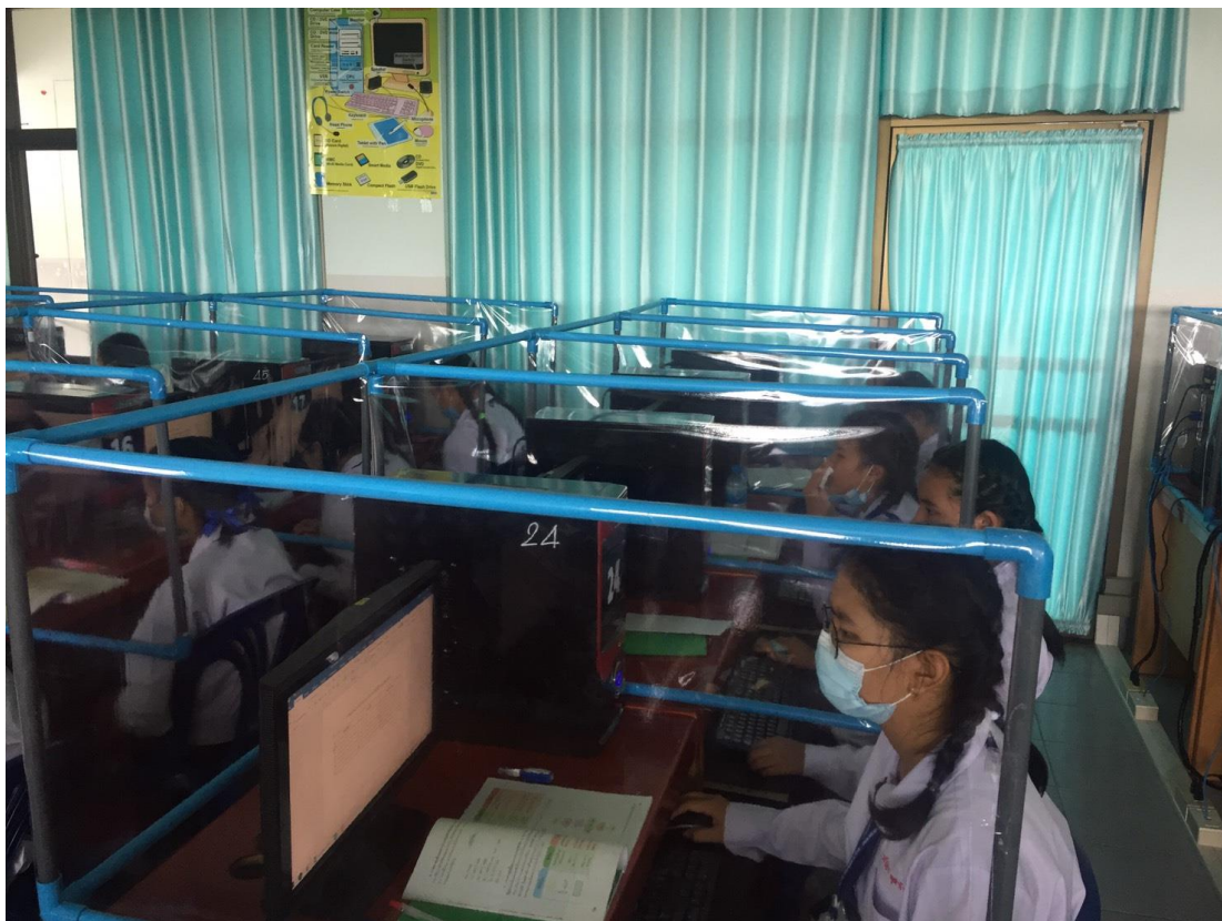
สภาพคอมพิวเตอร์พร้อมใช้งานที่ทันสมัยและเพียงพอจำนวนนักเรียน