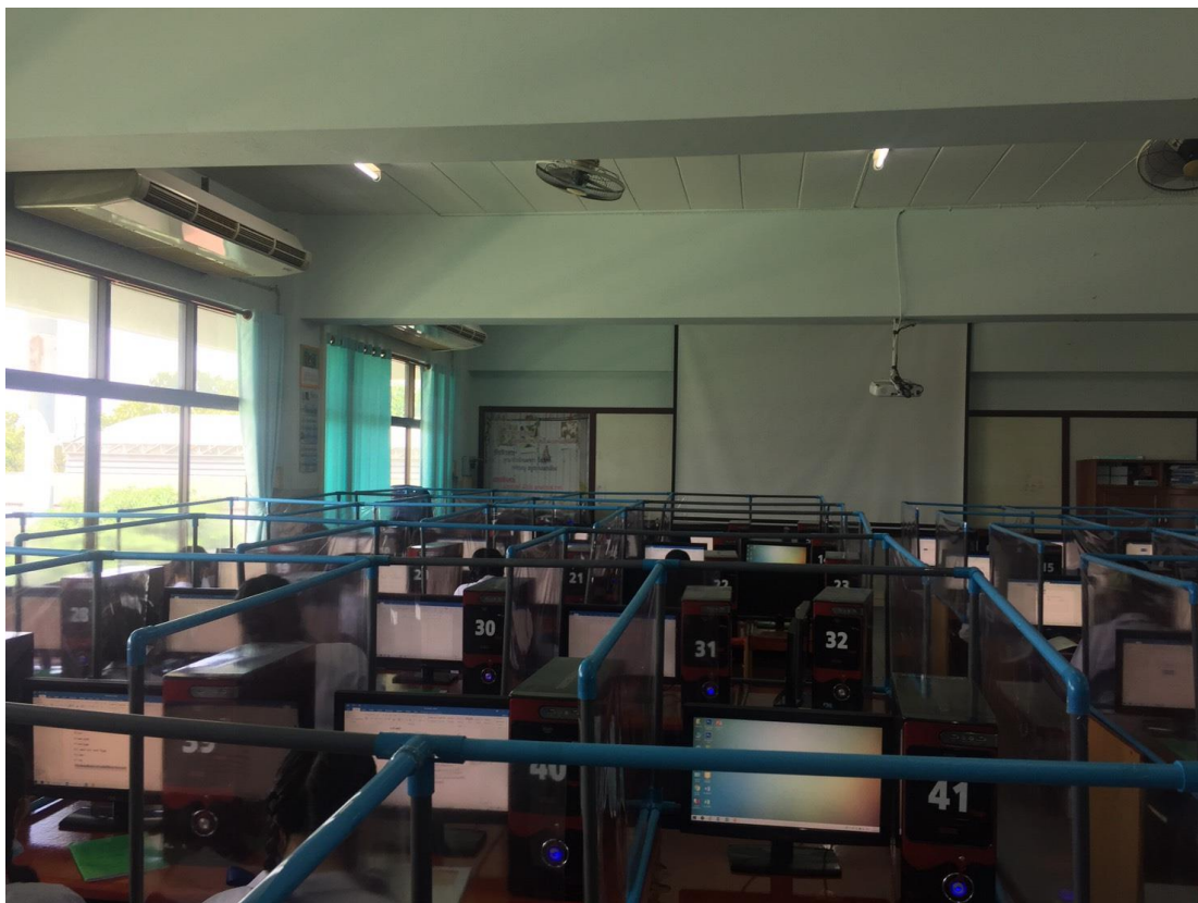
ใช้กิจกรรมการเรียนการสอนวิทยาการคำนวณอย่างมีประสิทธิภาพ