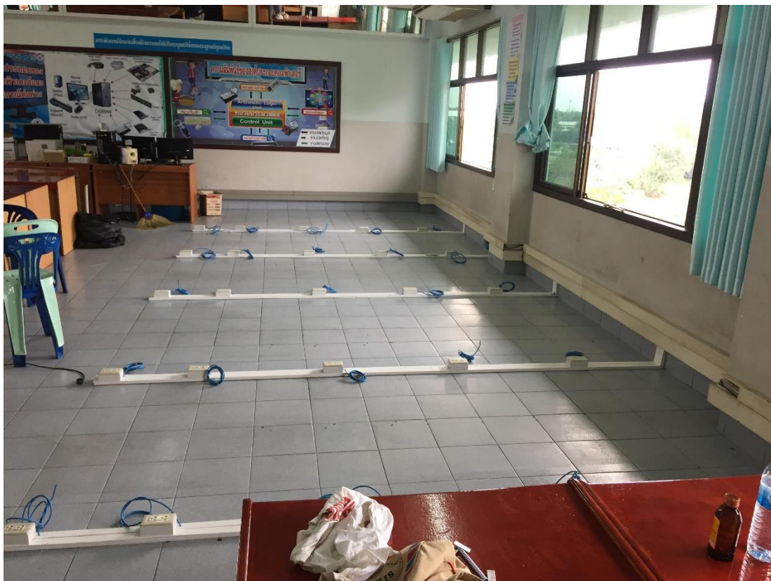
เดินระบบเครือข่ายและระบบไฟฟ้า