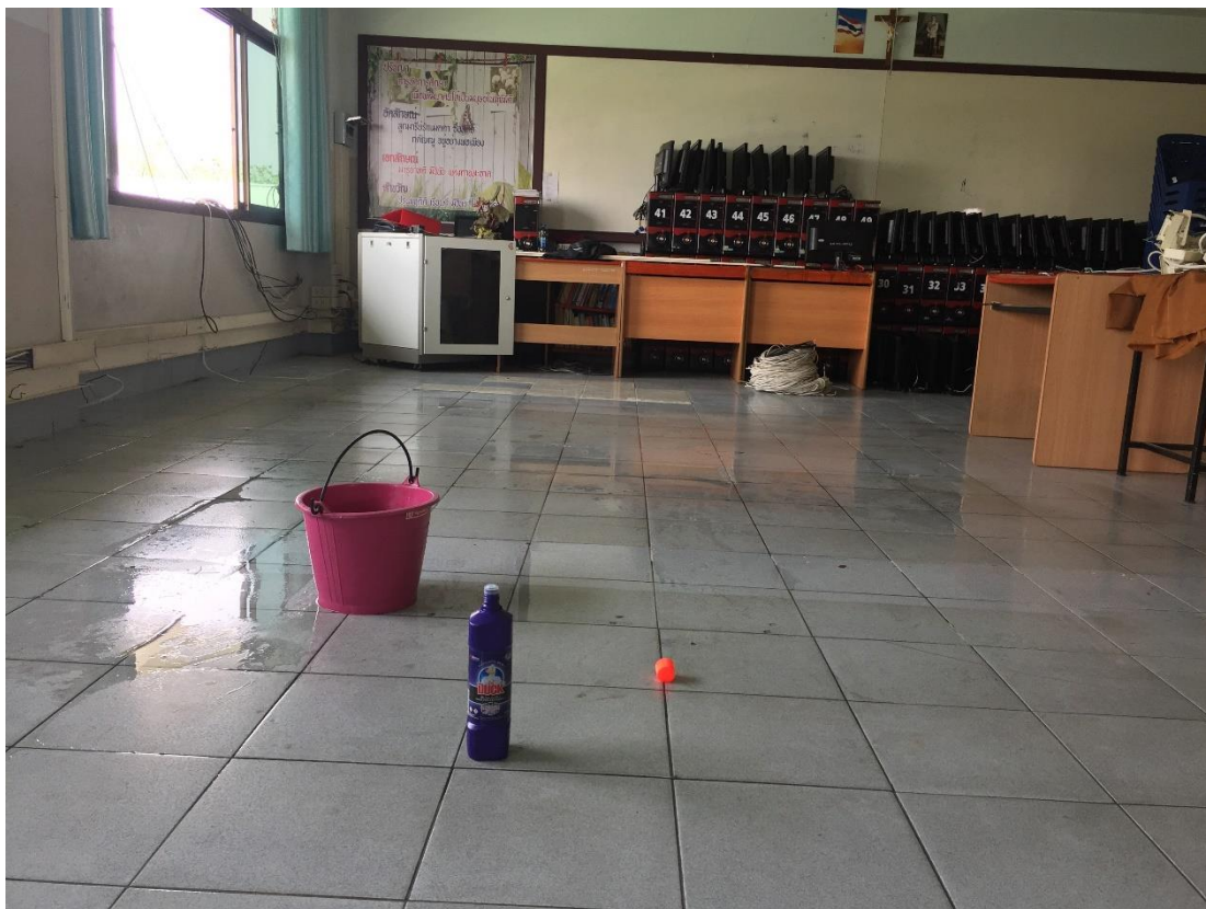
ทำความสะอาดพื้นห้องก่อนเดินระบบเครือข่ายและระบบไฟฟ้า