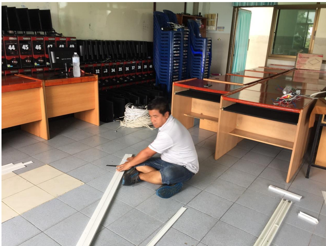
ติดตั้งระบบเครือข่าย (LAN) ภายในห้อง