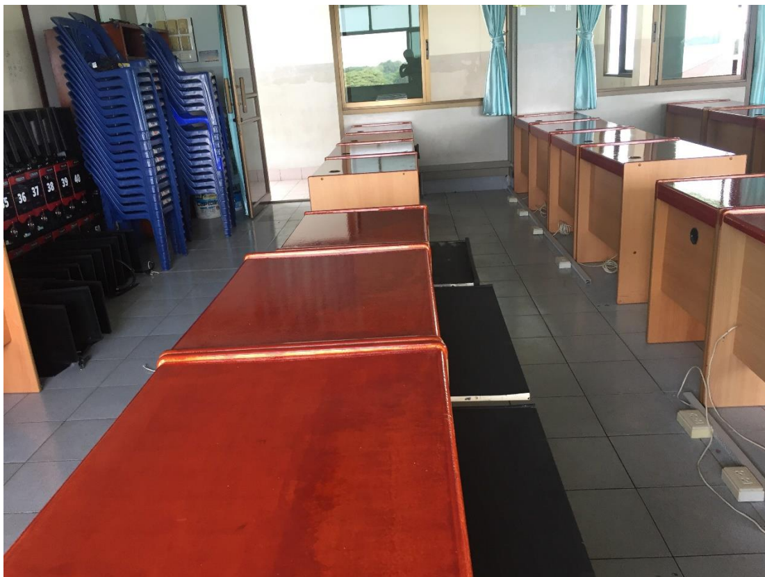
ทำความสะอาดโต๊ะคอมพิวเตอร์ และอับเกรดคอมพิวเตอร์