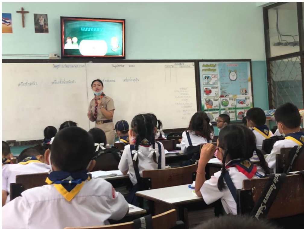
บรรยากาศการใช้สื่อเทคโนโลยีในการจัดการเรียนการสอน