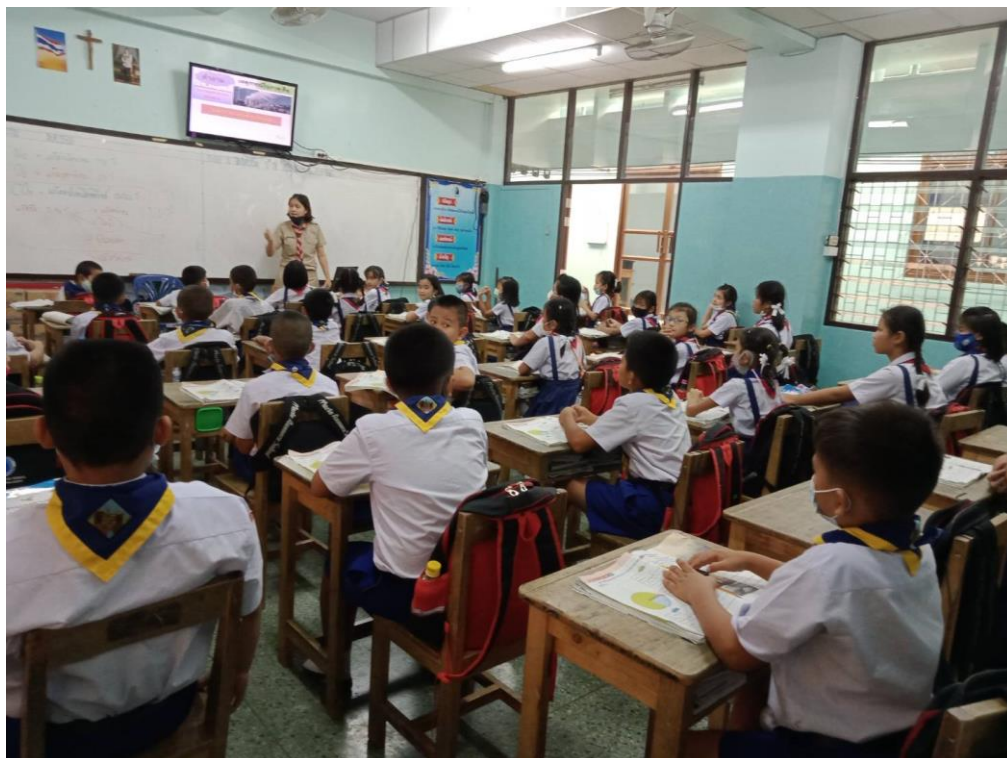
คณะครูสายชั้นประถมศึกษาปีที่ 3 ใช้สื่อเทคโนโลยีเพื่อการจัดการเรียนการสอน