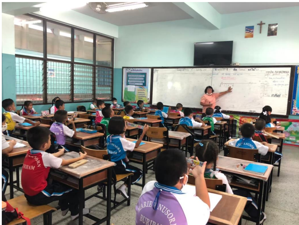
คณะครูสายชั้นประถมศึกษาปีที่ 2 ใช้สื่อเทคโนโลยีเพื่อการจัดการเรียนการสอน